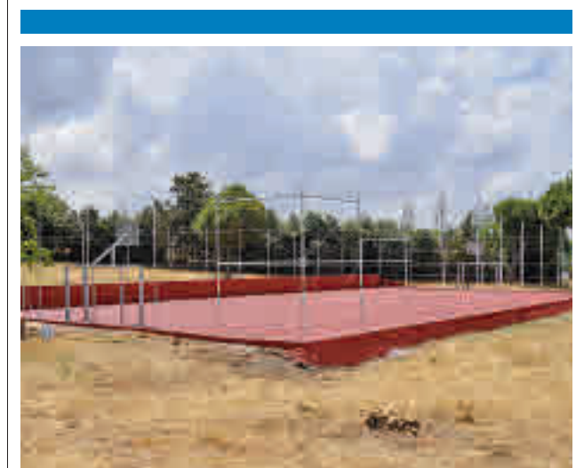
Nuevas instalaciones deportivas

La tasa más elevada corresponde a una semana más a Pozuelo de Alarcón, que ha bajado hasta los 181 casos por cada 100.000 vecinos. En Collado Villalba sube ligeramente hasta los 157, mientras Las Rozas y Majadahonda se quedan en 156. Boadilla baja a los 144.