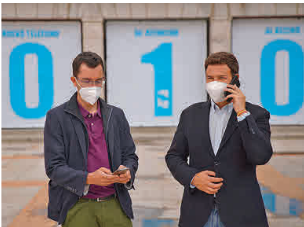
Un momento de la presentación