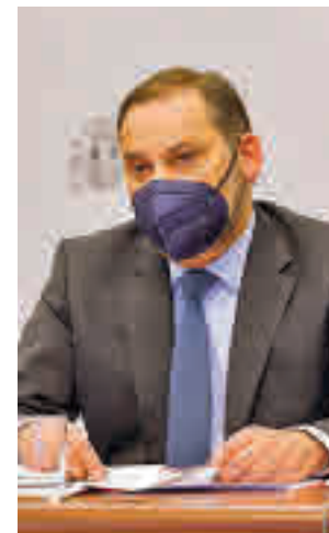
José Luis Ábalos

Durante su intervención, Ábalos ha transmitido a los consejeros de vivienda de las comunidades autónomas y de Ceuta y Melilla que la cogobernanza es "fundamental" para ejecutar con éxito