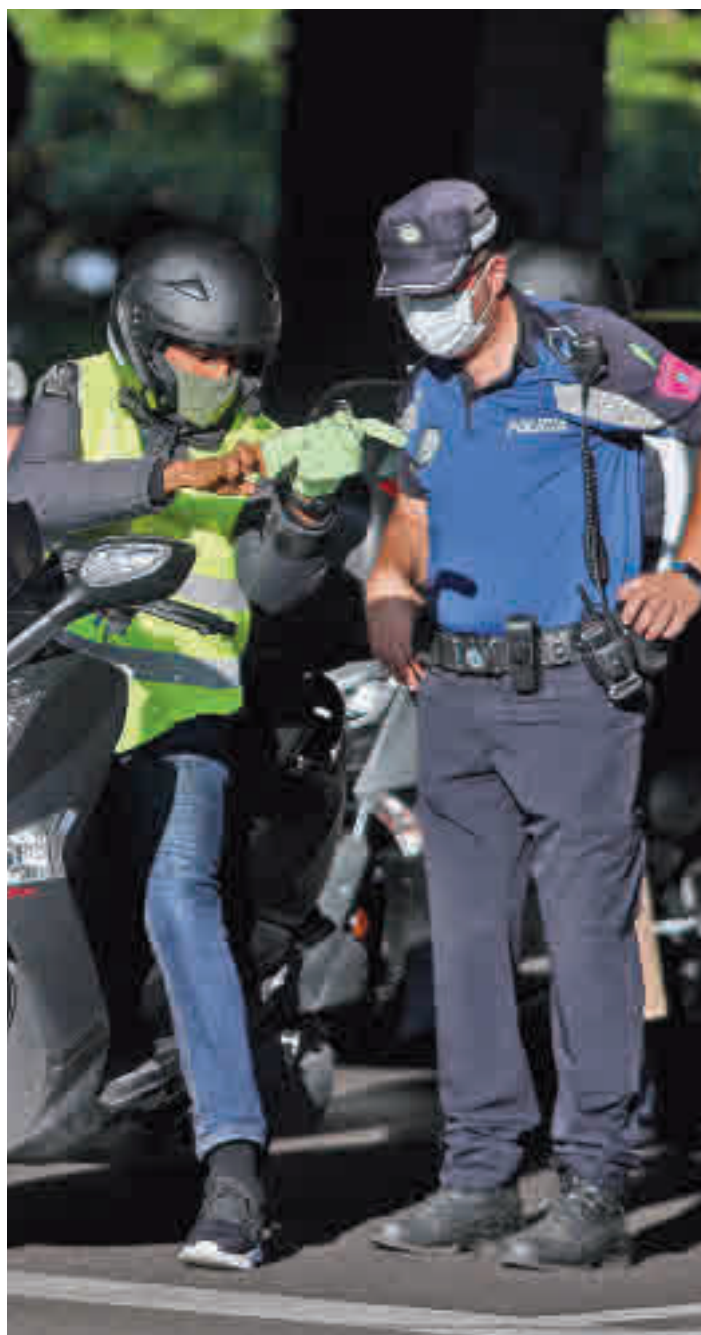
Control policial durante el estado de alarma

El segundo tipo de infracción con más denuncias es no usar la mascarilla obligatoria, con el 25,82%, mien-