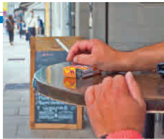
La pandemia ha disparado el consumo de cigarrillos

con el resto del sistema sanitario, los farmacéuticos disponemos del procedimiento de intervención breve: una serie de preguntas que se pueden personalizar en función del perfil del paciente que desea dejar de fumar",