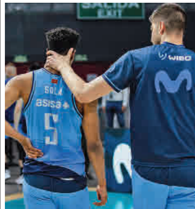
Desolación en el Movistar Estudiantes

Mirando un poco más adelante, el relevo generacional, en caso de tener que abordarse, está más que asegurado. Si semanas atrás uno de los representantes de las categorías inferiores subía al podio de la Competición Nacional Sub 23, el pasado fin de semana en San Cugat conquistaba el Campeonato de España M16, siguiendo los pasos de sus compañeros en el M18.