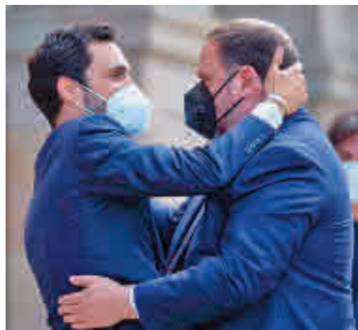
Los presos del procès vuelven a ser noticia

EL PERIÓDICO GENTE NO SE RESPONSABILIZA NI SE IDENTIFICA CON LAS OPINIONES QUE SUS LECTORES Y COLABORADORES EXPONGAN EN SUS CARTAS Y ARTÍCULOS