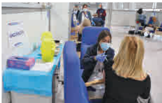
Vacunación en el Hospital Isabel Zendal

vocándoles para recibir AZ, que podrán aceptar o rechazar y que permitirá también solicitar un cambio de cita. Aunque el usuario acepte el mensaje para recibir AZ, in situ tendrá la opción de poder ser inoculado con Pfizer. En ambos casos, se deberá firmar previamente un consen-