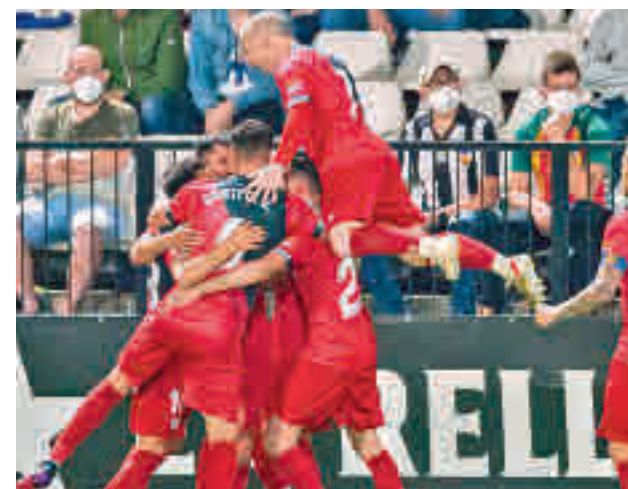
El Rayo dio un paso de gigante en Castellón

Por su parte, el Rayo Vallecano sabe que debe ganar su encuentro con el Lugo en casa o esperar a que el Sporting no gane al Almería para estar en un 'play-off' que arrancará el miércoles día 2.