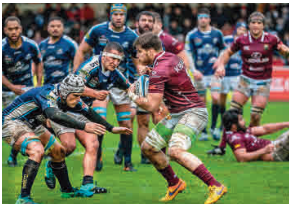
Campeón y aspirante cara a cara

secutiva en los últimos años. Por tanto, esta final reúne al campeón con el aspirante, un duelo que ya se dio el pasado 17 de enero, en aquella ocasión sobre el césped del Pepe Rojo de Valladolid. Entonces, el Lexus Alcobendas ya mandó un aviso a navegantes: su candidatura al título era muy firme. Un triunfo por 19-20 que tuvo continuidad el 11 de abril, con una nueva victo-