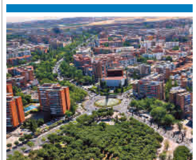
Vista aérea de Móstoles

La Policía Local de Valdemoro ha detenido a un individuo por exhibir sus genitales delante de un grupo de menores de edad.