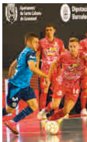
Otra vez el 'Clásico'