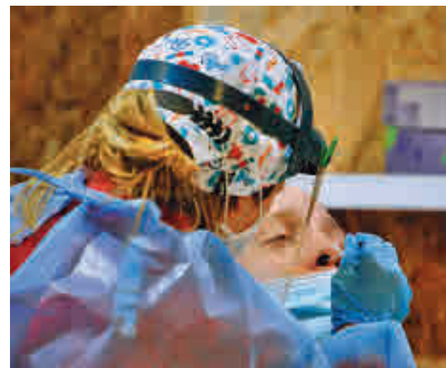
La incidencia sigue a la baja en el Sur