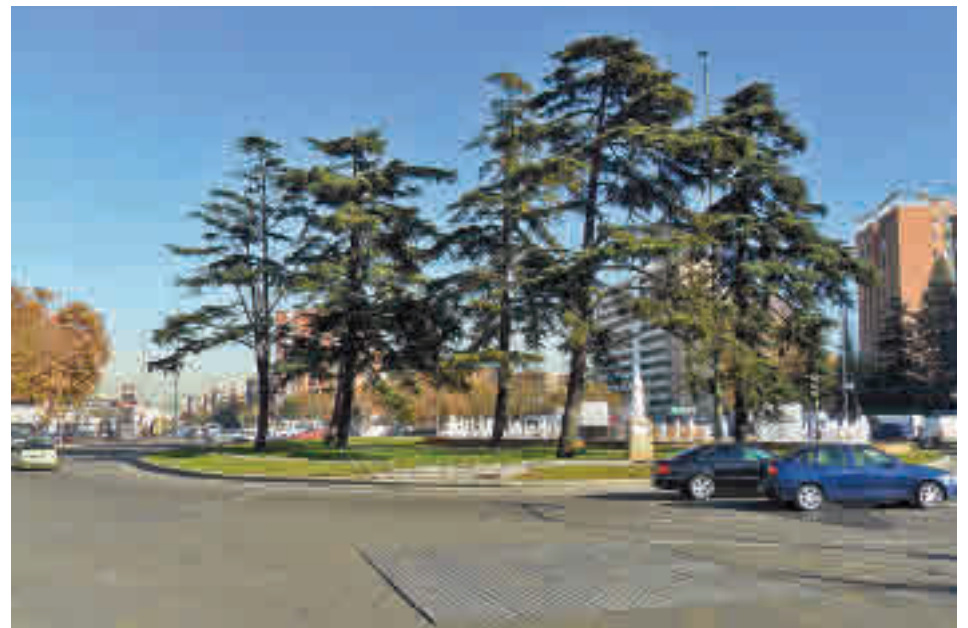
Varios vehículos circulan por el entorno de Plaza Elíptica

El propio delegado ya adelantó el pasado diciembre la instalación este verano de cámaras para controlar el acceso a la zona de bajas emisiones de Plaza Elíptica y precisó que un estudio de la Dirección General de Infraestructuras estimaba que la