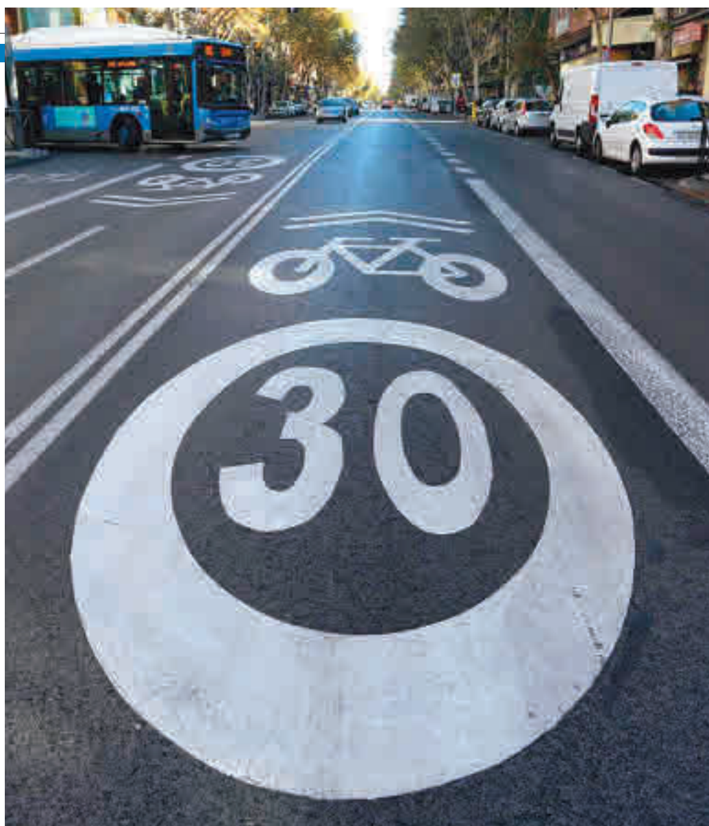
Los seguros también se verán afectados

Reducir la siniestralidad también podría afectar positivamente al seguro del co-