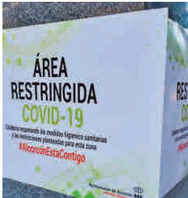
Los cierres perimetrales se han levantado

Las buenas noticias se han trasladado también a las Zonas Básicas de Salud en las