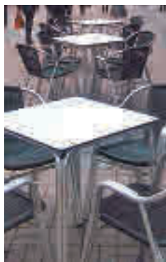
Mesas en terrazas

El consejero ha destacado el "gran esfuerzo" que en este sentido está realizando la Consejería de Sanidad, "que