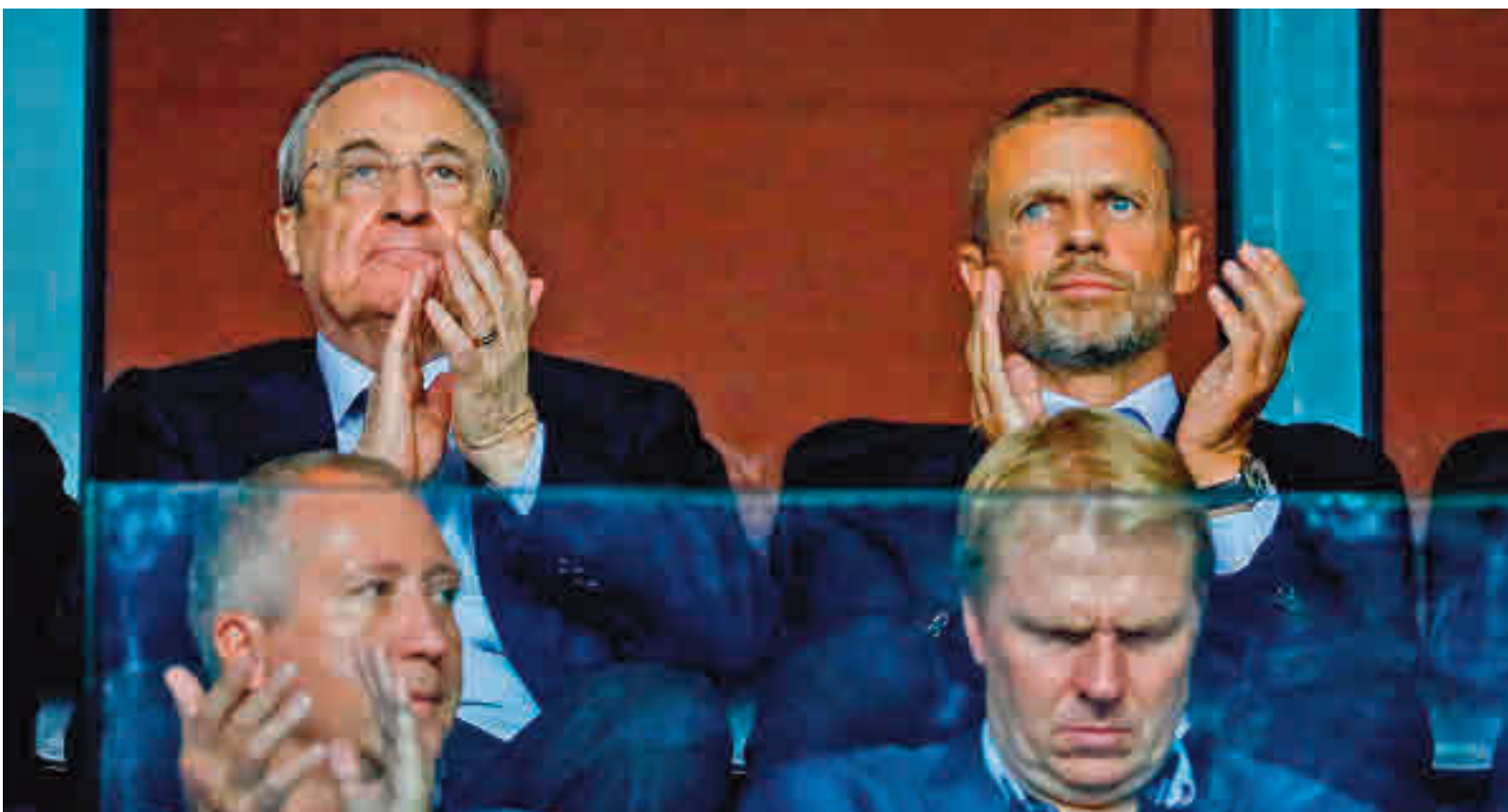
Florentino Pérez, presidente del Real Madrid, junto a su homólogo de la UEFA, Aleksander Ceferin