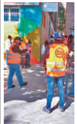
Una de las 'colas de hambre'

Toda la actualidad de los distritos de Madrid, en nuestra web