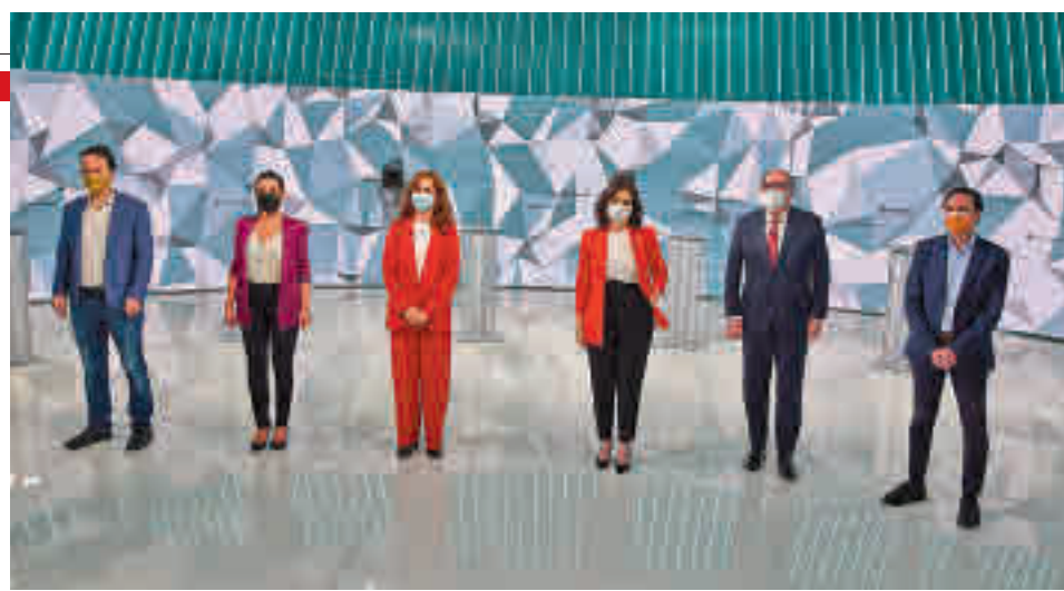
Debate de candidatos en Telemadrid

La posición más difícil fue la de Bal, cuyo partido corre el riesgo de quedarse fuera de la Asamblea. Su estrategia fue la de poner en valor los logros del Gobierno regional y advertir sobre la entrada de Vox en el mismo.