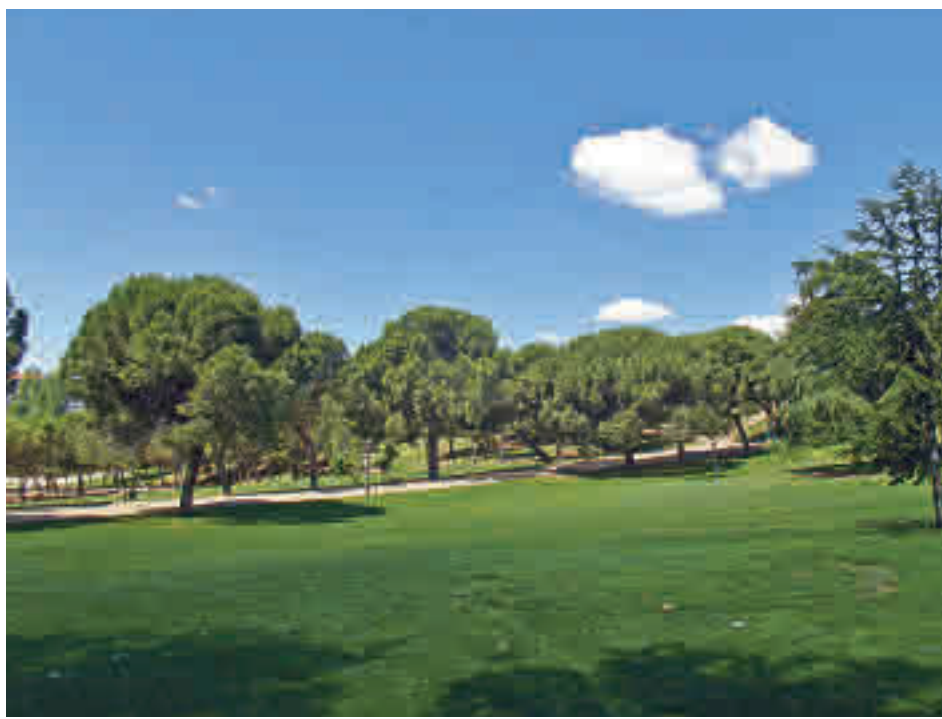
La zona verde carabanchelera tiene más de 40 años de antigüedad

Por su parte, la segunda fase hará más accesible la calle Pan y Toros, en la zona del lado de los números impares, incluidas las aceras de las áreas de aparcamiento que conectan con la calle de Gigantes y Cabezudos.