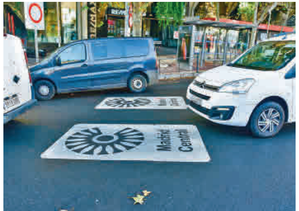
La zona de bajas emisiones Madrid Central

El primer edil explicó que el objetivo es contribuir a que se "revitalice" la economía de estos comercios dada la situación económica provocada por la pandemia, al tiempo que recordó que el anterior equipo de Gobierno "decidió prescindir de la consulta y devino en nulo de pleno dere-