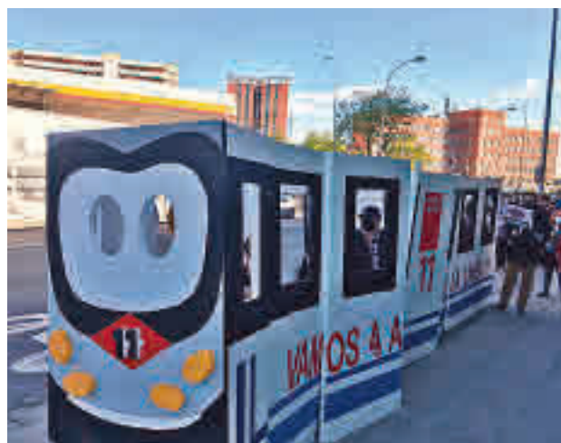
El tren de papel de los residentes AV CARABANCHEL ALTO

"En 2017 la Comunidad de Madrid se comprometió a ampliar la línea 11 hasta Atocha-Renfe y Conde de Casal, con fondos propios de la Comunidad y que estaría en funcionamiento en 2023. Pero el actual Gobierno tiene ralentizado o parado dicho proyecto, y ni siquiera ha licitado las obras de ampliación", critica la Asociación Vecinal Carabanchel Alto.