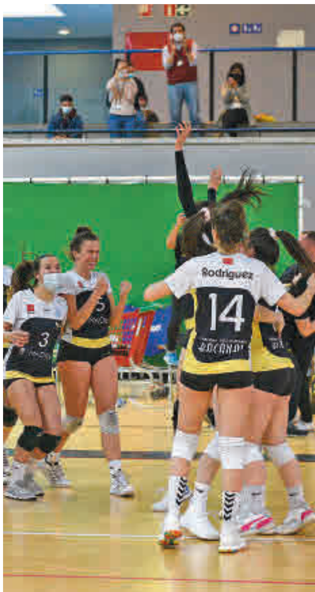
Celebración de las jugadoras del VP Madrid