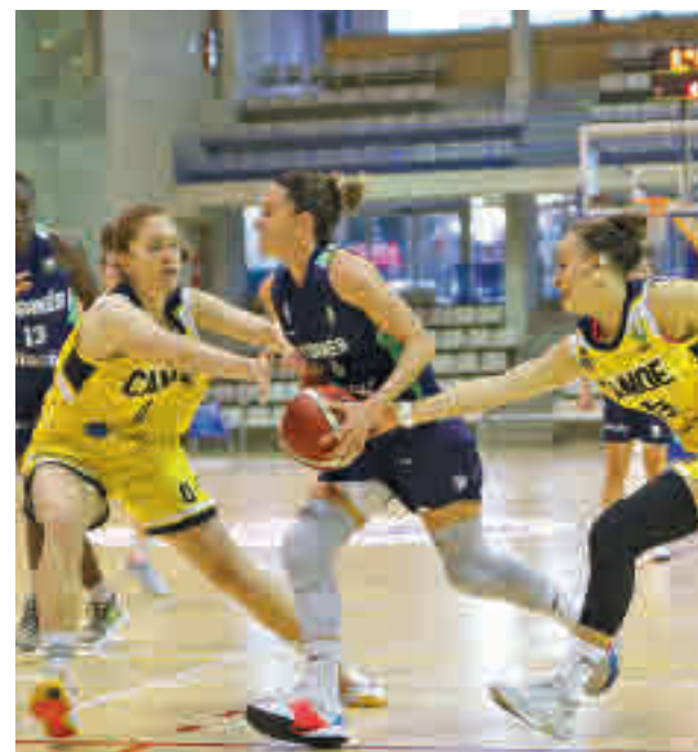
Gran ocasión para Leganés, Canoe y Alcobendas

AR Concepción-Ciudad Lineal y CDN Boadilla se ven las caras este sábado 10 (17:30 horas) en la Piscina M-86, en el marco de la jornada 13 dentro del grupo para lograr la permanencia.