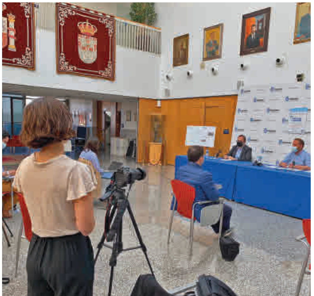
Presentación de las actuaciones en toda la ciudad

También se llevará a cabo la peatonalización del casco urbano, en calles como Vicente Aleixandre, La Luna, Espejo, Ordóñez, Barrionuevo, El Charco y El Sol, con un presupuesto de 4,5 millones de euros. Esta iniciativa prevé actuaciones en el ajardinamiento,