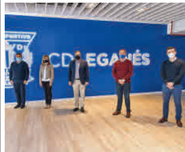
Acto de presentación de la iniciativa

gentedigital.es Toda la actualidad de Leganés Norte en nuestra página web