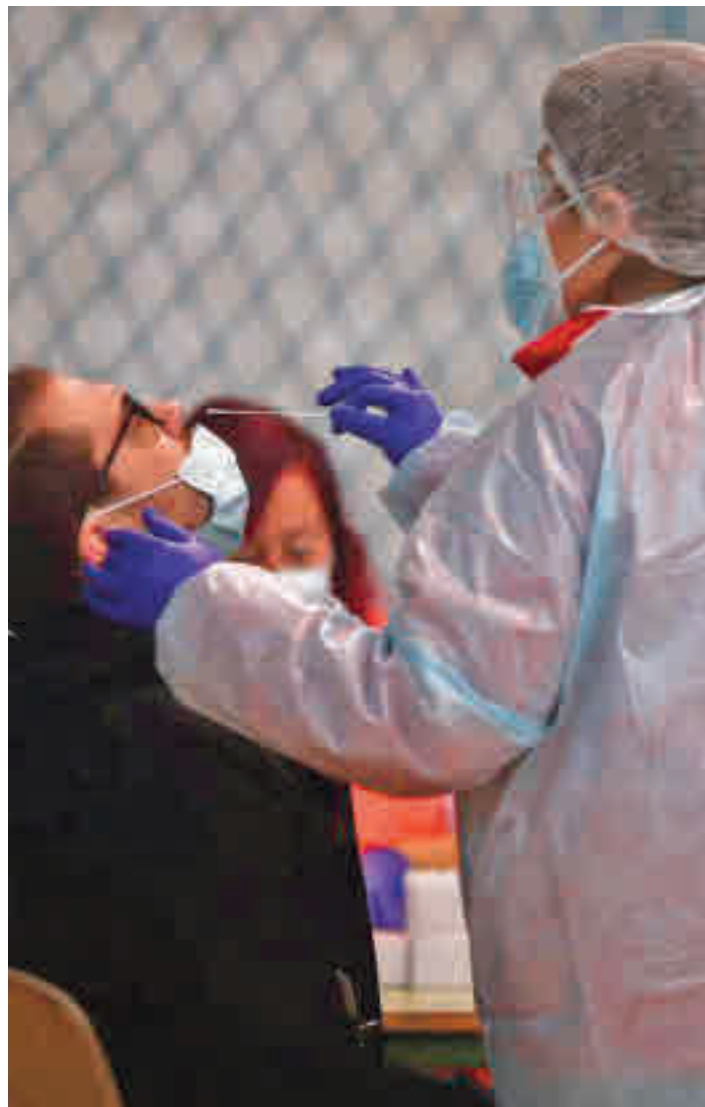
La incidencia está subiendo en Leganés

de 182, lo que supone la tercera subida consecutiva. Hay que recordar que el pasado 16 de marzo la tasa era de 145. Por encima de Leganés se sitúan localidades como Alcorcón (220), Pinto (247), Fuenlabrada (255), Valdemo-