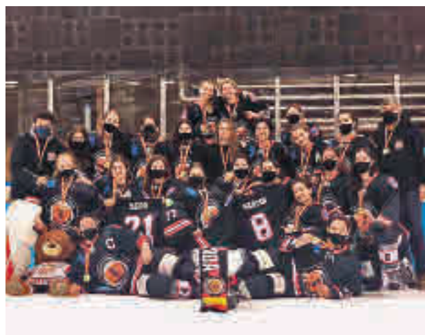
Nuevo éxito de las majariegas