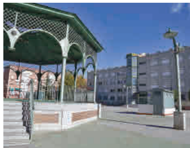
Edificio de la Escuela de Música

"Son proyectos de centros culturales nuevos en dos barrios que en estos momentos no tienen ninguna dotación cultural y a los que les hace