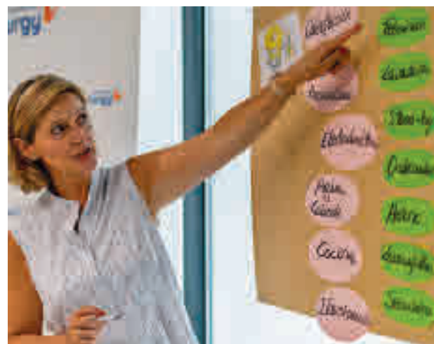
Formadora de la Escuela de Energía FUNDACIÓN NATURGY