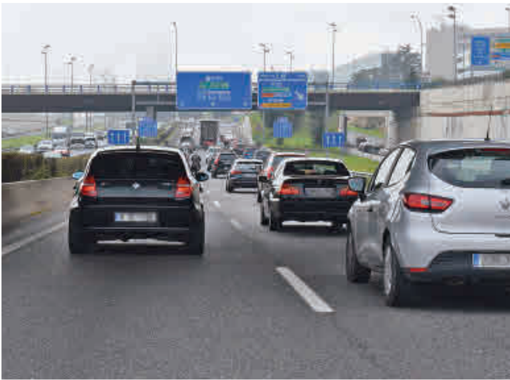
Los atascos, una constante en esta vía