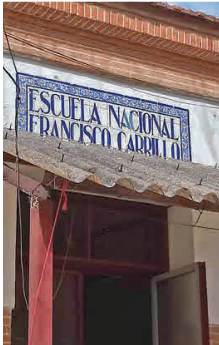
Espacio donde se ubicará el centro de mayores

tes 16, fuentes municipales informaban del inicio de las obras en dos parques inclusivos que estarán ubicados en los barrios de Tempranales y Dehesa Vieja. Dichos trabajos se prolongarán durante tres