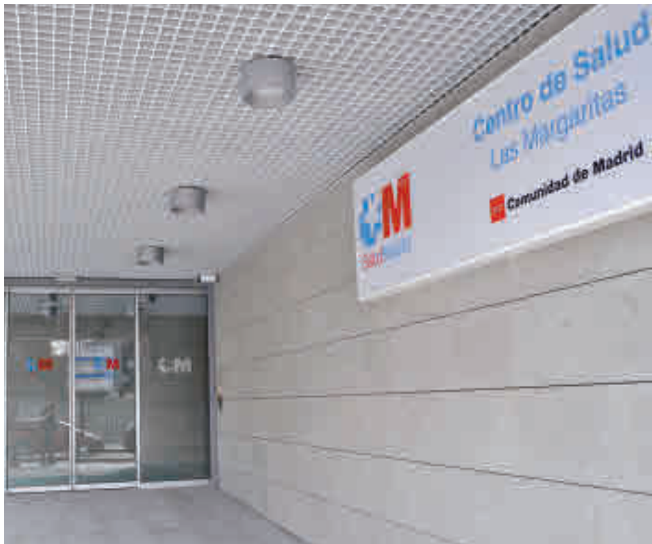
La incidencia ha vuelto a bajar en Getafe

La Consejería de Sanidad ha justificado este levantamiento en la mejora de los datos sanitarios, ya que este área sanitaria registró la semana pasada 302 casos de Covid-19 por cada 100.000 habitantes en los 14 días anteriores, una cifra que ha bajado hasta los 224 en el informe epidemiológico publicado este martes 2 de marzo. Estos datos son muy inferiores a los que se dieron en el pico de la tercera ola, a finales de enero, cuando se superaron los mil casos por cada 100.000 vecinos.