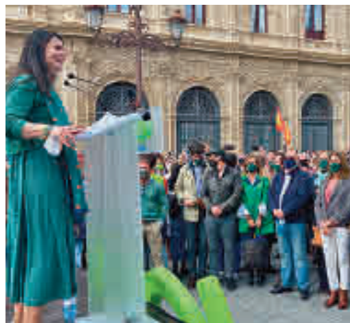
Mitin reciente de Vox en Sevilla

EL PERIÓDICO GENTE NO SE RESPONSABILIZA NI SE IDENTIFICA CON LAS OPINIONES QUE SUS LECTORES Y COLABORADORES EXPONGAN EN SUS CARTAS Y ARTÍCULOS