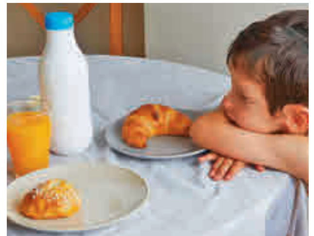
El desayuno infantil, una puerta para el azúcar en los hogares

“La adherencia a la dieta mediterránea se va perdiendo entre los niños. Estos cada vez prefieren desayunar más productos industriales preparados con alto contenido de azúcar”, indica Montaña.