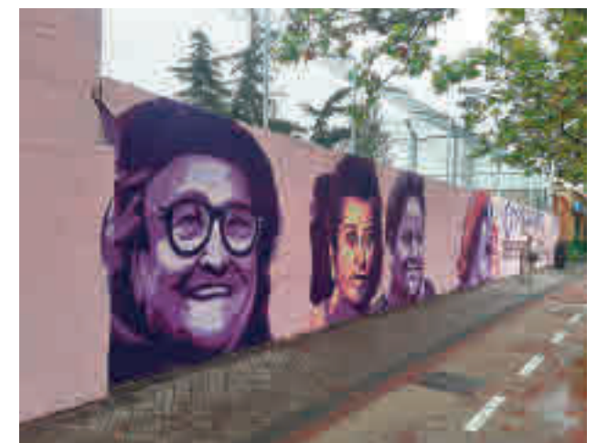
El mural de Ciudad Lineal llegará a Getafe Central

En el mismo aparecen los rostros de diversas mujeres como Rigoberta Menchú, Frida Khalo, Valentina Tereshkova, Kanno Sugako, Rosa Parks, Federica Montseny o Angela Davis, que han logrado grandes hitos a lo largo de la historia y han luchado por la defensa de los derechos humanos y de las mujeres.