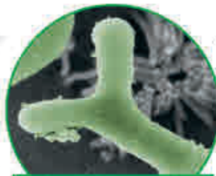
Ayuda eficaz con la bifidobacteria B. bifidum HI-MIMBb75

El secreto de Kijimea Colon Irritable PRO: sus bifidobacterias especiales inactivadas térmicamente y con Efecto-Parche PRO. Las bifidobacterias se adhieren como un parche protector a las áreas dañadas de la pared intestinal. Así, esta puede recuperarse y está protegida contra nuevas irritaciones. De esta forma, pueden reducirse la diarrea, el dolor abdominal y la flatulencia.