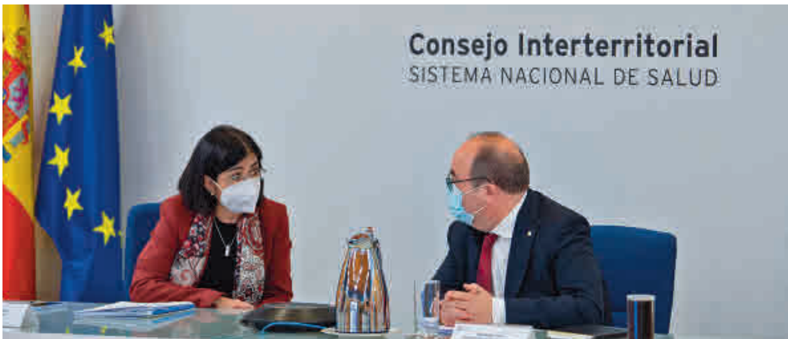
La ministra de Sanidad, Carolina Darias, junto con el titular de Administraciones Públicas, Miquel Iceta