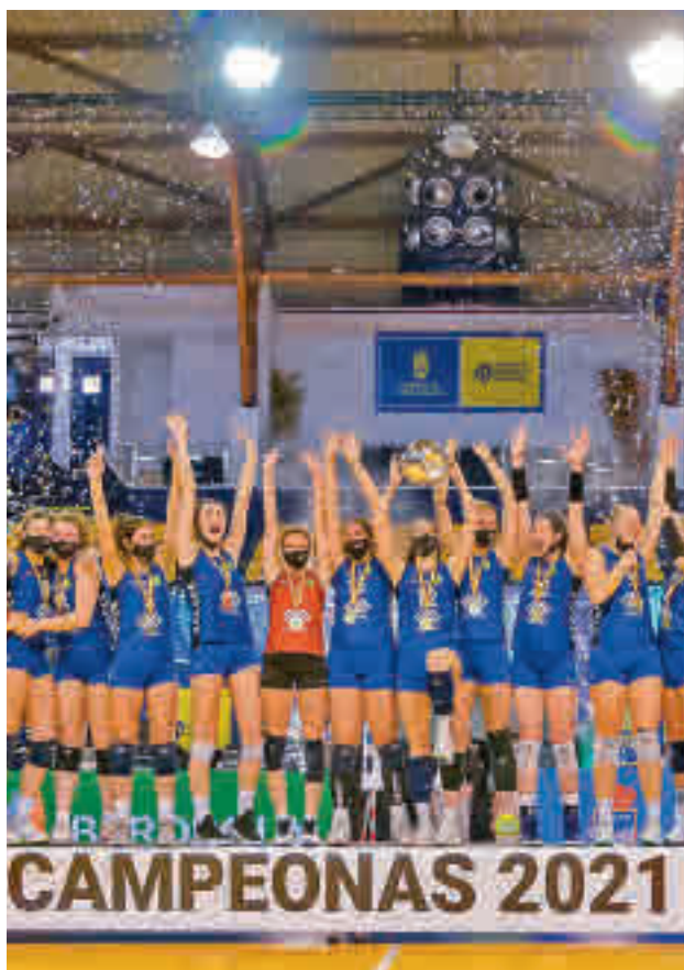
El Alcobendas, en el podio de campeonas

LA ÚLTIMA VEZ QUE LA COPA VIAJÓ A LA COMUNIDAD FUE EN EL AÑO 1994