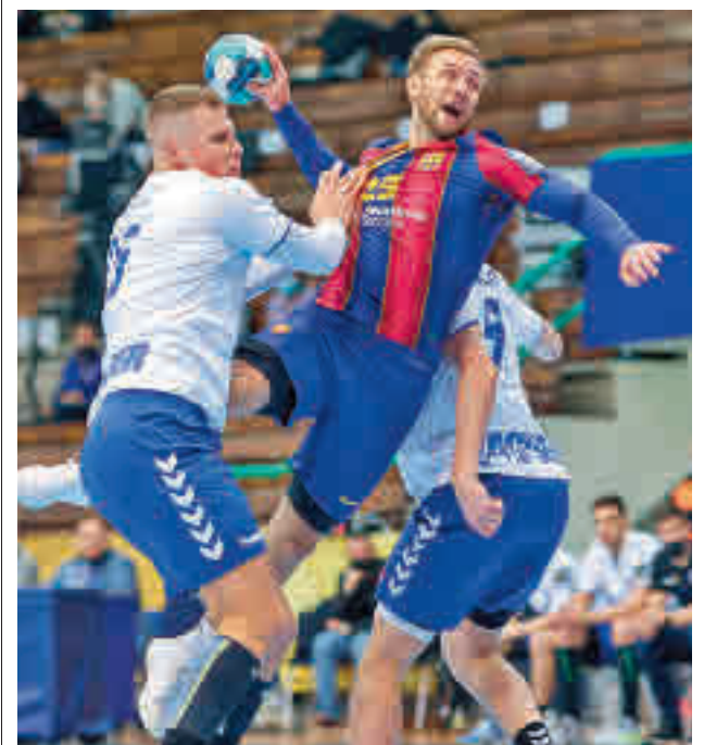
El Barça lleva ganando este título desde 2014

Este fin de semana arranca el Grupo D de la División de Honor femenina de waterpolo donde se decidirá la permanencia con los choques CDN Boadilla-Zaragoza y Sant Feliu-AR Concepción.