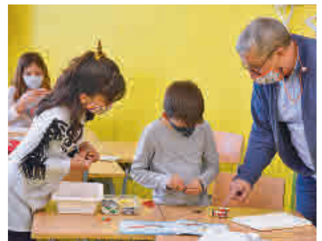
Uno de los centros participantes

Las solicitudes para participar en la segunda edición están abiertas hasta el día 19.