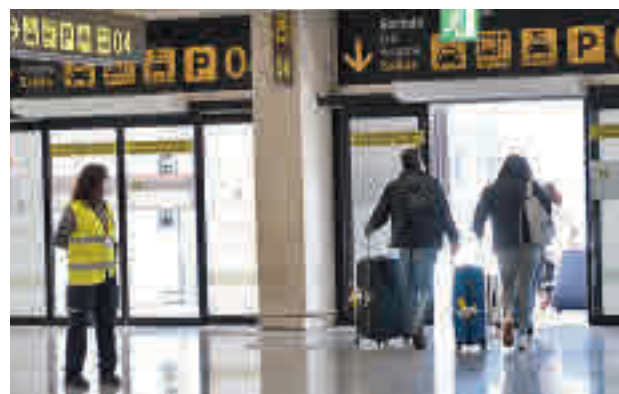
Los vacunados podrán viajar

De este modo, la jefa del Ejecutivo cede a los países que como Grecia y España reclamaban una suerte de