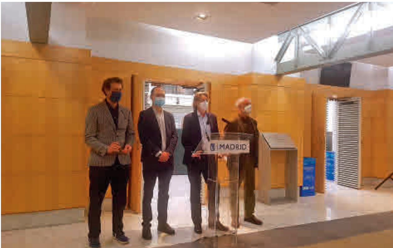
Un momento de la rueda de prensa, celebrada en Cibeles