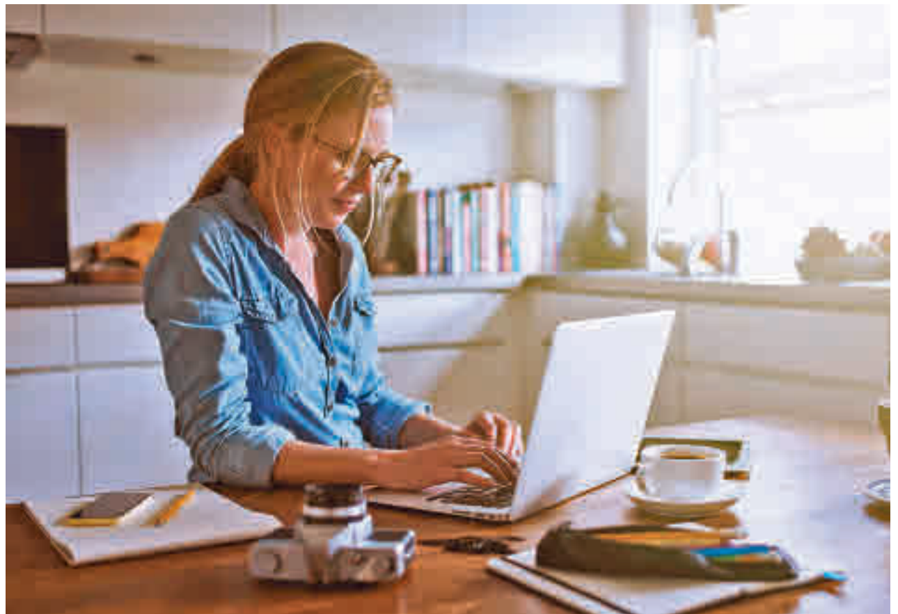
El teletrabajo ha venido para quedarse y abre un amplio abanico de oportunidades

Trabajar y generar ingresos desde el dormitorio o el salón es posible. Incluso desde la cocina. Así lo hacen las personas que se están animando a realizar tartas o bizcochos con sus propias manos y en sus hornos con el fin de comercializarlos luego por internet aprovechando que a nadie le amarga un dulce. Son solo algunos ejemplos que demuestran que en un mundo que está cambiando de forma repentina dadas las circunstancias, existen más oportunidades de las que uno cree siempre y cuando haya gente dispuesta a adaptarse.