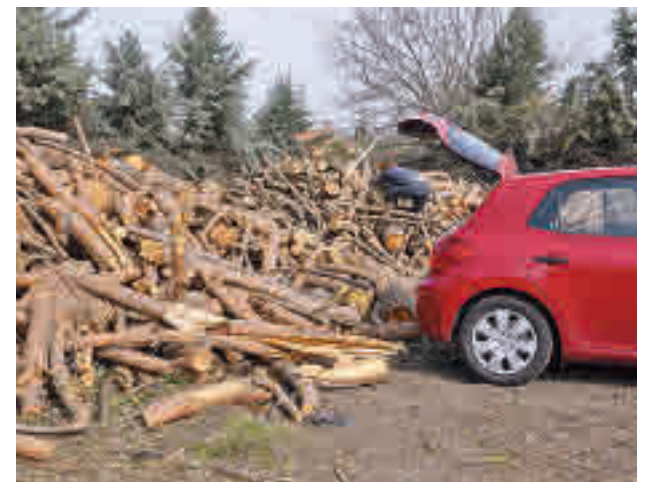
Leña caída por la borrasca 'Filomena'

En total se acreditará a 540 vecinos y solo podrá formalizar la solicitud un miembro de la unidad familiar. Será obligatorio estar empadronado en Boadilla.