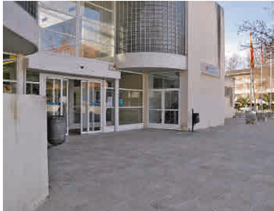
Centro de salud de Boadilla del Monte

Collado Villalba sigue teniendo la tasa más elevada, pero es cuatro veces más baja que la que presentaba hace apenas un mes, lo que podría suponer el fin de su cierre perimetral • Las Rozas es la única que deja atrás el riesgo extremo