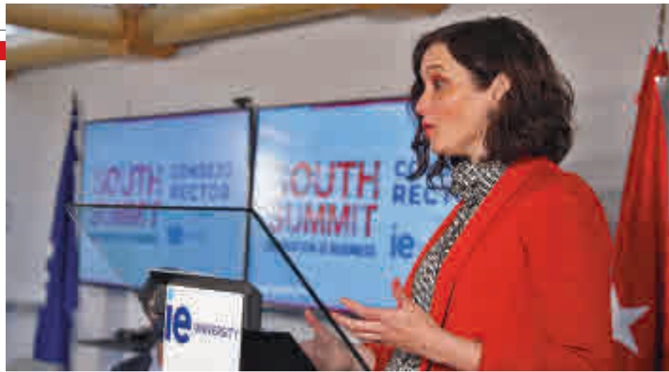
Isabel Díaz Ayuso, durante su intervención

La infraestructura, inaugurada por la presidenta regional, Isabel Díaz Ayuso, ha contado con una inversión de 1,5 millones de euros.