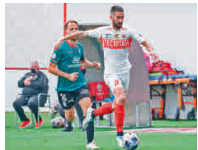
El club de Matapiñonera atraviesa un buen momento UD SANSE

En una situación similar está Las Rozas, que recibe este domingo en Navalcarbón al Atlético Baleares.