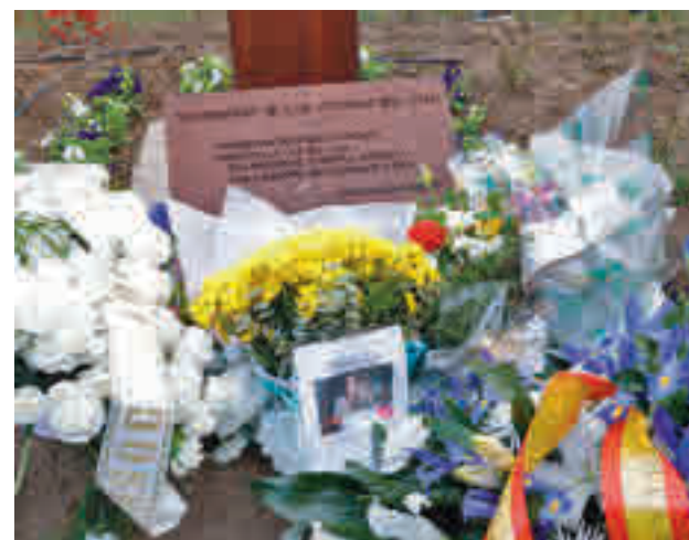
Una de las ofrendas florales en Santa Eugenia

Una hora y media antes, en la estación de Atocha, se guardará un minuto de silencio y se hará una ofrenda floral con la asistencia de representan-