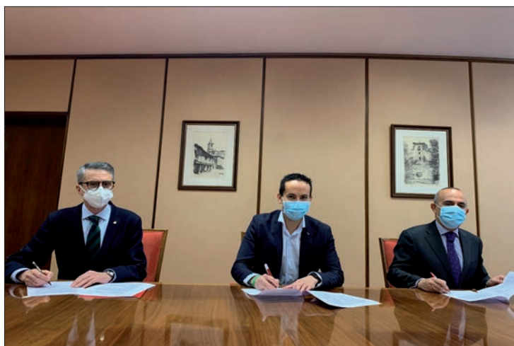
Firma del convenio de colaboración, el martes 9.

'EducaInnova' surge en el año 2018 como una iniciativa pionera que ahonda en la relación entre neurociencia -estudio del cerebro y su funcionamiento- y educación, con el objetivo de potenciar el conocimiento y la experimentación a través de planes y programas, creando un referente educativo,