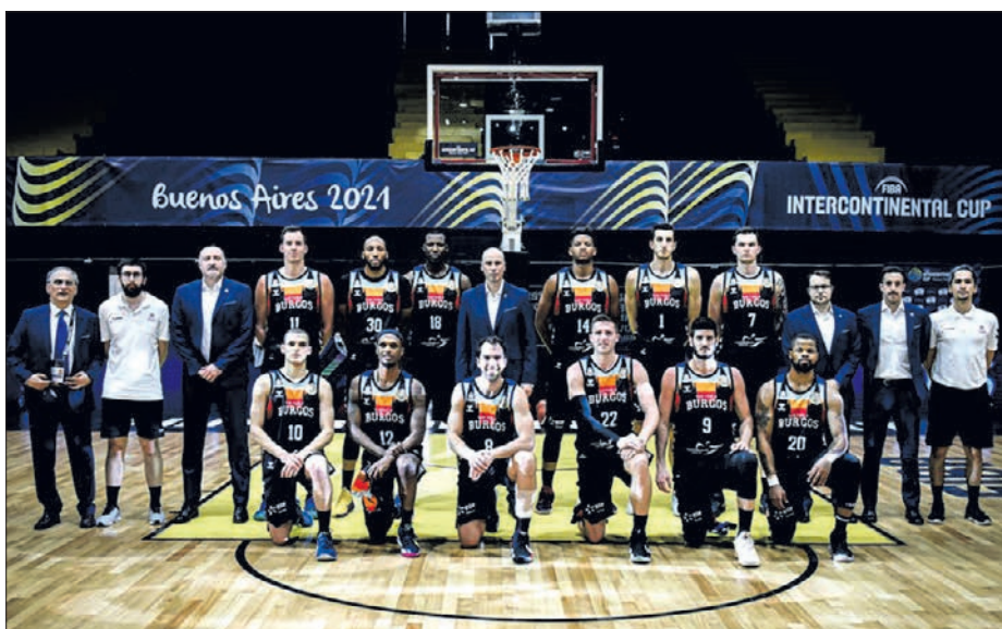
Toda la expedición burgalesa en el pabellón Obras Sanitarias de Buenos Aires.