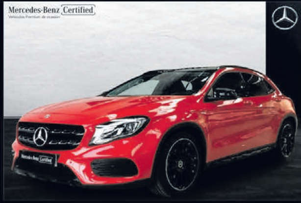
GLA 200 d. AMG Style Black. Automático. 7G-DCT. 31.900€*.