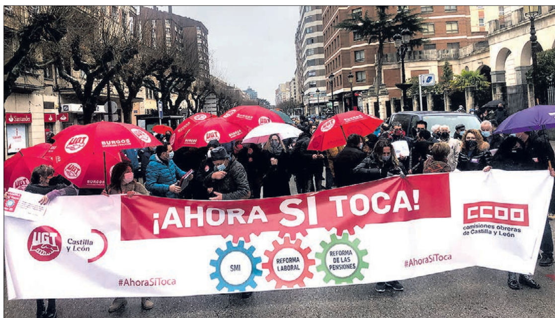
Concentración frente a la Subdelegación del Gobierno, el jueves 11.