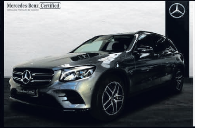
GLC 250. 4MATIC, AMG Line. Automático. 9G-TRONIC. 41.900€*.