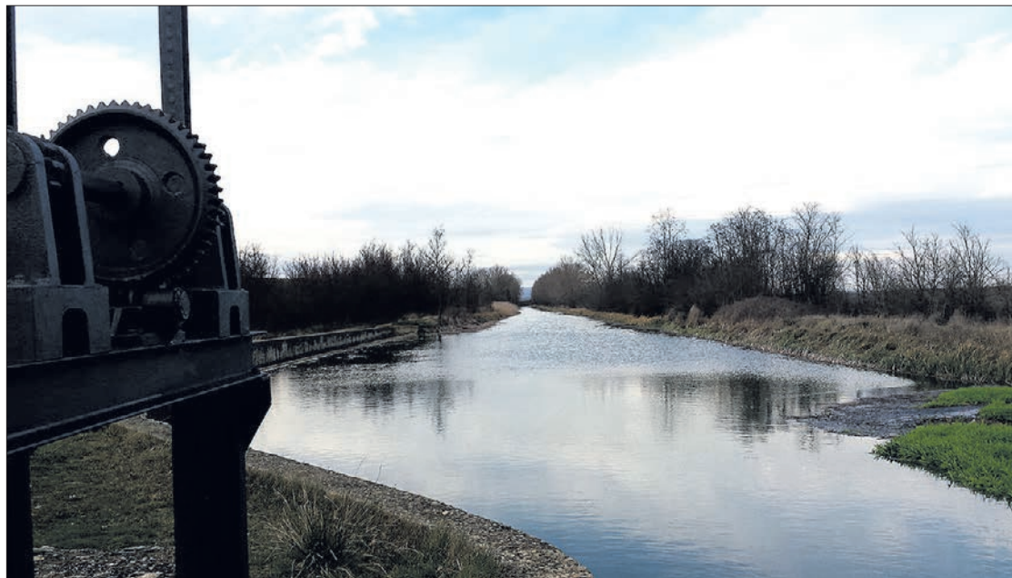
Imagen de archivo del Canal de Castilla.