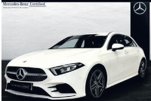
Clase A 180 d. AMG Line. Automático. 7G-DCT. 29.900€*.