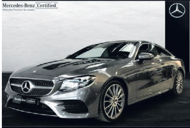
Clase E 220 d Coupé. AMG Line. Automático. 9G-TRONIC. 39.500€*.