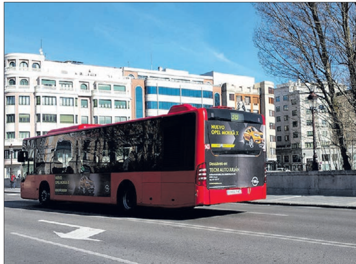
El nuevo mapa de líneas de autobuses se puso en marcha en enero.

En este sentido, el edil aprovechó para realizar un breve balance del nuevo mapa de autobuses, que lleva algo más de un mes operativo y ha supuesto pasar de 32 líneas a 23. Si bien señaló que