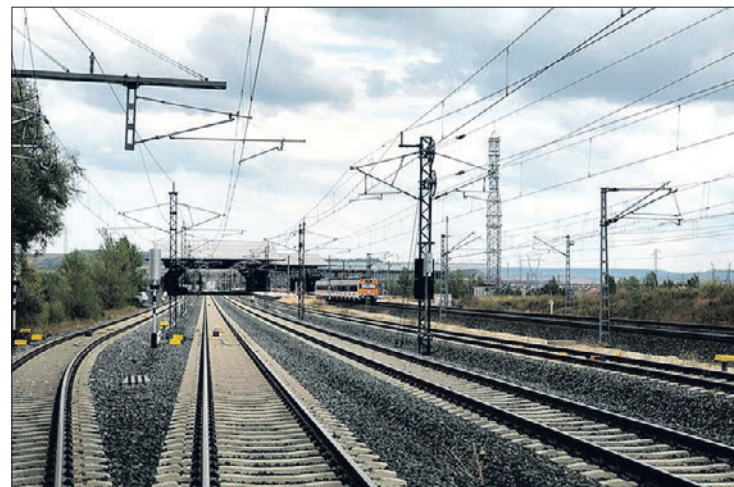
Pasarán aún meses hasta que el primer AVE llegue a la estación de Burgos.

Ante esta situación, dijo, el PP en el Senado ha canalizado dos líneas de trabajo. Por una parte, ha registrado una batería "importante" de preguntas para conocer la realidad de la alta velocidad de cara a los próximos meses. Con ellas se espera dar respuesta a cuándo llegará