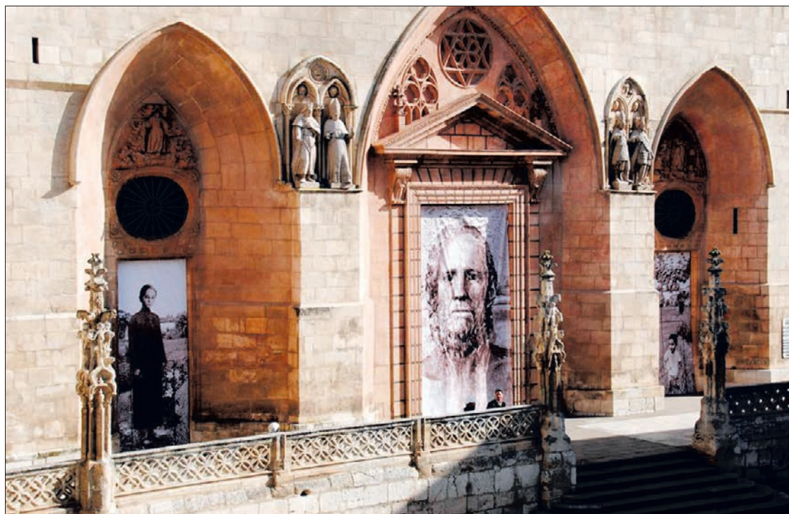
Montaje de la imagen que presentaría la fachada principal de la Catedral con el cambio de las actuales puertas de madera por otras de bronce.

Por ello, entiende que son el Centro del Patrimonio Mundial y las Administraciones competen-