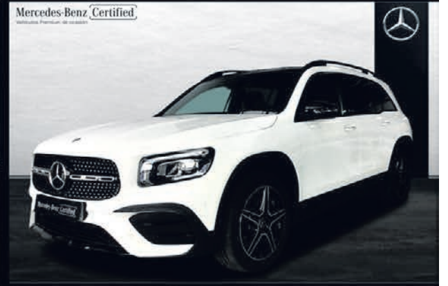
GLB 250. 4MATIC, AMG Line. Automático. 8G-DCT. 54.000€*.