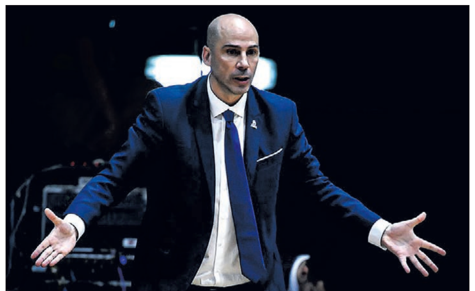
Los de Joan Peñarroya dominaron la primera mitad.