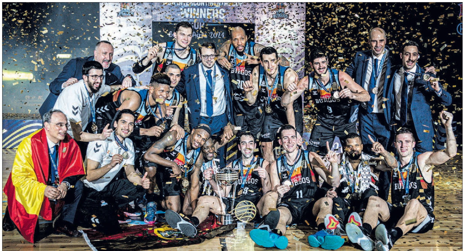
El Hereda San Pablo Burgos, campeón de la Copa Intercontinental de la FIBA en Buenos Aires.

El equipo de Joan Peñarroya se impuso a la Asociación Atlética Quimsa 73-82