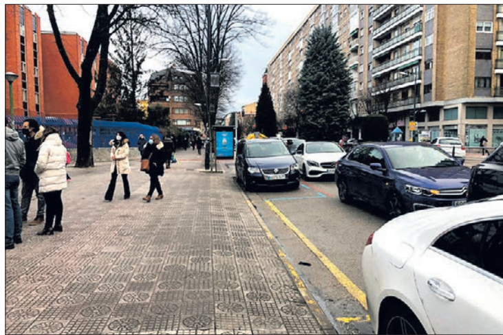
La doble fila es una imagen frecuente a ciertas horas en el entorno de La Salle.

Se han elegido los colegios La Salle y Jesús María, por ser centros que "se suelen colapsar" en los momentos de entrada y salida de las clases. "Antes de implantar esta iniciativa en otros colegios -explicó Rodríguez-Vigil-, hay que ver no solo las ventajas que va a suponer la puesta en funcionamiento de la misma, sino también los inconvenientes que puede acarrear, como por ejemplo la reducción de plazas de aparcamiento para los vecinos y trabajadores de la zona en determi-