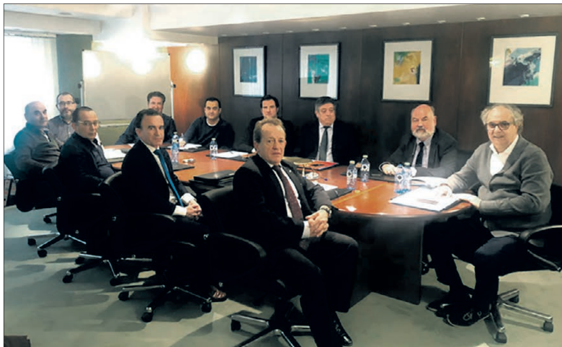
Imagen de archivo de una reunión de la Mesa Intersectorial de Juego Privado en la Comunidad Autónoma de Castilla y León.

En definitiva, aunque a la Junta de Castilla y León se le va a compensar por ese concepto desde el Gobierno Central con unos fondos recibidos de la Unión Europea, resulta que desde la Consejería de Economía y Hacienda se pretende el cobro de la tasa de