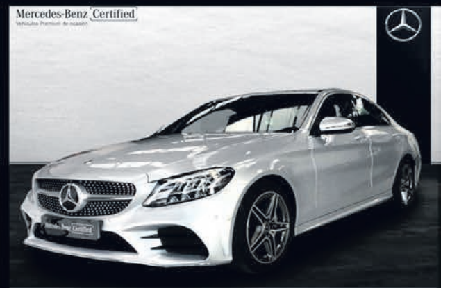
Clase C 220 d. AMG Line. Automático. 9G-TRONIC. 34.900€*.