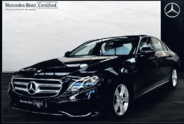
Clase E 220 d AVANTGARDE. Automático. 9G-TRONIC. 29.900€*.