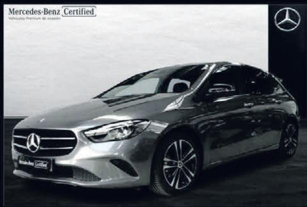
Clase B 180. Progressive. Automático. 7G-DCT. 29.500€*.