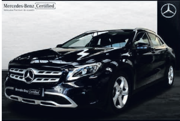
GLA 200 d. Urban. Automático. 7G-DCT. 23.900€*.