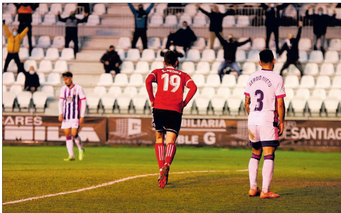
Partido aplazado correspondiente a la décima jornada, disputado en el Estadio Municipal El Plantío.