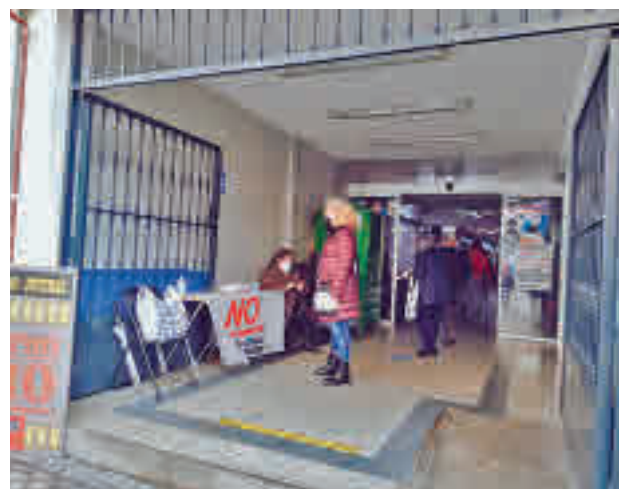
La mesa de recogida de firmas en el Mercado de Villa Rosa

mas contra el proyecto municipal de construir un aparcamiento disuasorio en esta zona del distrito de Hortaleza. Hasta el momento han recogido más de 3.000 apoyos, a través de Change.org y más de 500 rúbricas en las mesas