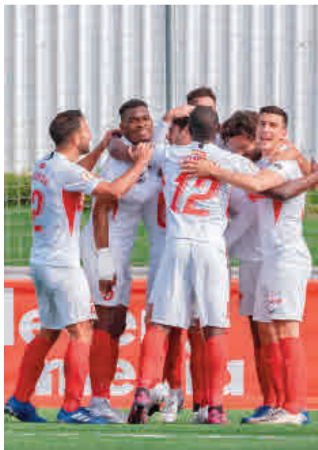
El Sanse camina con paso firme