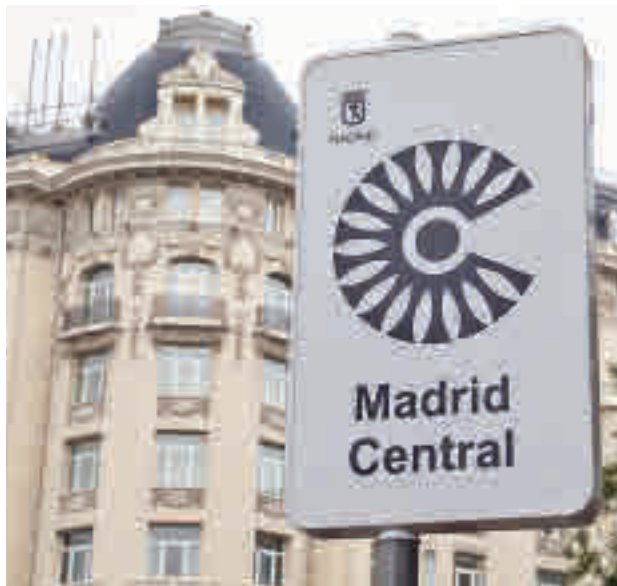
La zona de bajas emisiones que engloba al distrito Centro

Ecologistas en Acción considera inmorral la actuación