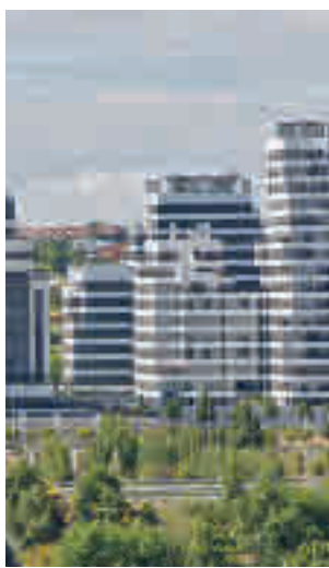
El nuevo barrio hortaleño