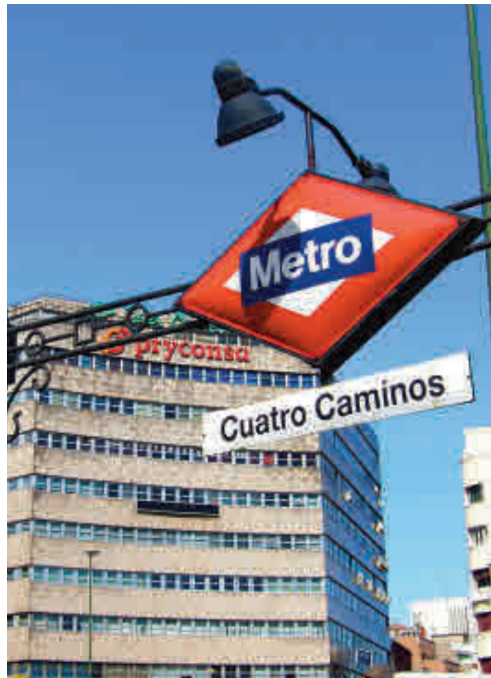
Una de las 'bocas' de Metro en la glorieta de Cuatro Caminos

bución de las líneas 1 y 2 y tienen como objetivo sustituir los revestimientos, instalaciones y tecnología obsoleta, localizados en los andenes y sus accesos, por otros