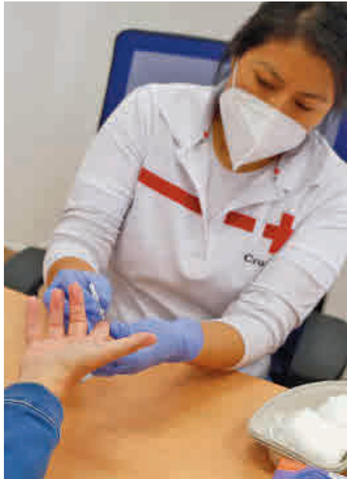
Una sanitario realiza una prueba de antígenos

Por su parte, Salamanca tiene un promedio de 954,2 casos por cada 100.000 habi-