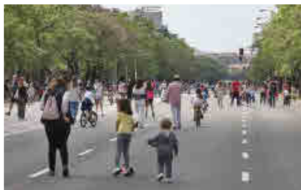
El peatón será el protagonista en 6,4 kilómetros de calle

Las mencionadas vías serán Laguna, en el tramo entre