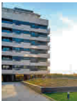
Una promoción de pisos

cálvaro. Por contra, la zona más exclusiva sigue siendo el barrio de Salamanca (6.105 euros). Así lo asegura el Estudio de Vivienda Nueva en Madrid elaborado por la Sociedad de Tasación, que analiza la evolución del valor de estos inmuebles en 2020. La capital cerró el año con una subida