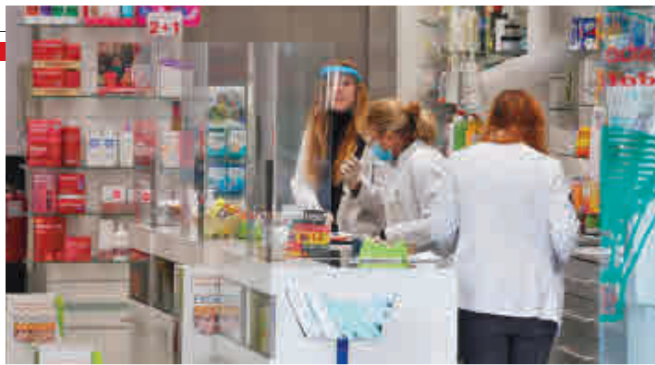
Las farmacias podrán hacer test de antígenos

Por su parte, el consejero de Sanidad, Enrique Ruiz Escudero, señaló que la participación en este programa se ofrecerá de manera voluntaria y los profesionales deberán realizar previamente en un curso formativo, impartido por sus respectivos colegios, al tiempo que ha insistido en que los test serán solo para aquellas personas asintomáticas que sean deriva-