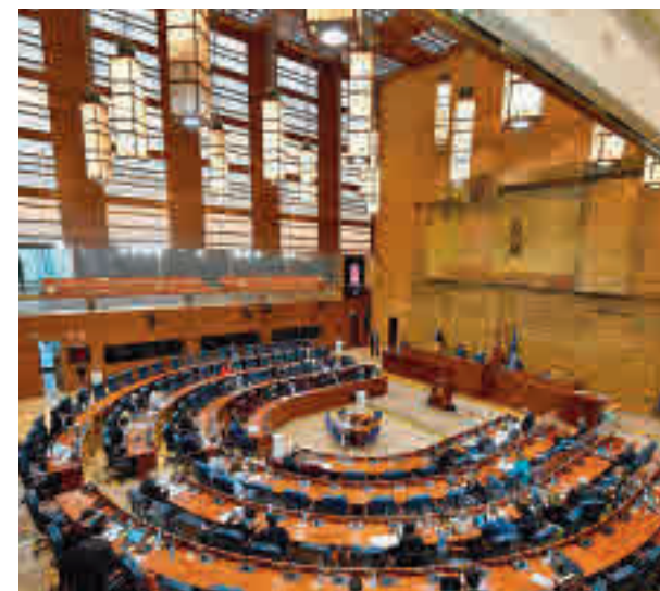
Asamblea de Madrid