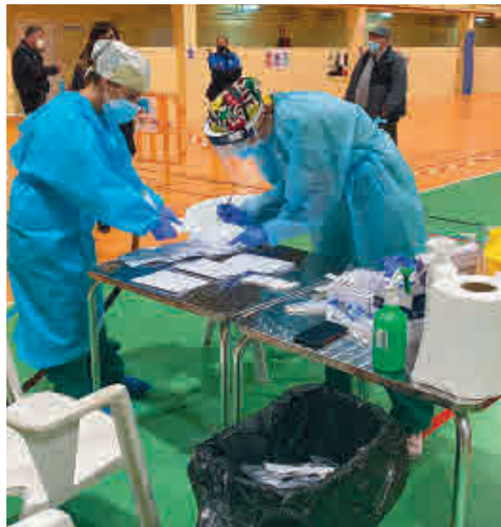
Los contagios siguen subiendo en el Sur

En cuanto a las Zonas Básicas de Salud (ZBS) en las que se