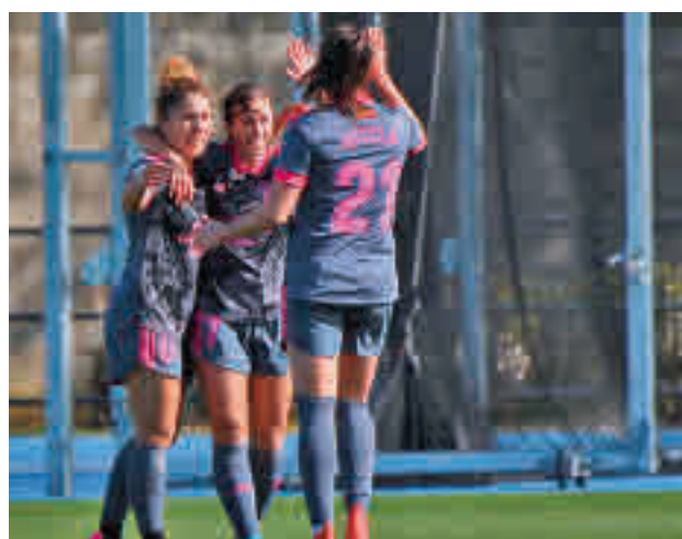
El Madrid CFF está firmando una gran temporada

y aspira a clasificarse para la Liga de Campeones, un objetivo al que se acercan tanto el Atlético de Madrid como el Madrid CFF. Este último protagonizará un derbi con el Rayo Vallecano, mientras que las rojiblancas actuarán como locales ante la Sociedad Deportiva Eibar.