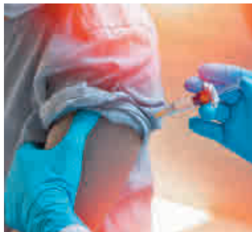
Las vacunas, en el punto de mira

EL PERIÓDICO GENTE NO SE RESPONSABILIZA NI SE IDENTIFICA CON LAS OPINIONES QUE SUS LECTORES Y COLABORADORES EXPONGAN EN SUS CARTAS Y ARTÍCULOS