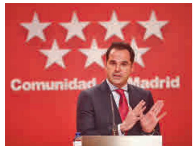
No habrá nuevas restricciones en la región

Entre la última batería de medidas que entraron en vigor este lunes 25 destaca el toque de queda a las 22 horas, el cierre de la hostelería y el comercio a las 21 horas o la prohibición de reunirse en domicilios con personas que no son convivientes.