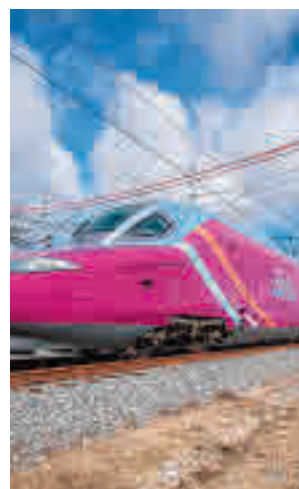
El nuevo tren Avlo

entre junio y diciembre entre Madrid y Barcelona. La compañía ya utilizó esta promoción el año pasado, momento en el que debía haberse estrenado el Avlo, algo que se tuvo que posponer por la pandemia. A diferencia de