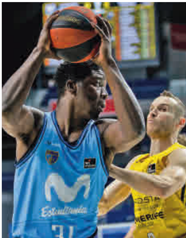
El equipo colegial quiere acercarse a la permanencia

Una agenda similar tendrá un Real Madrid que este vier-