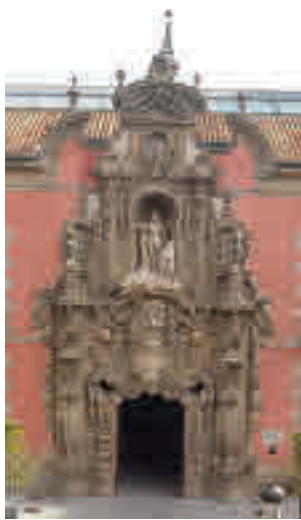
El Museo de Historia