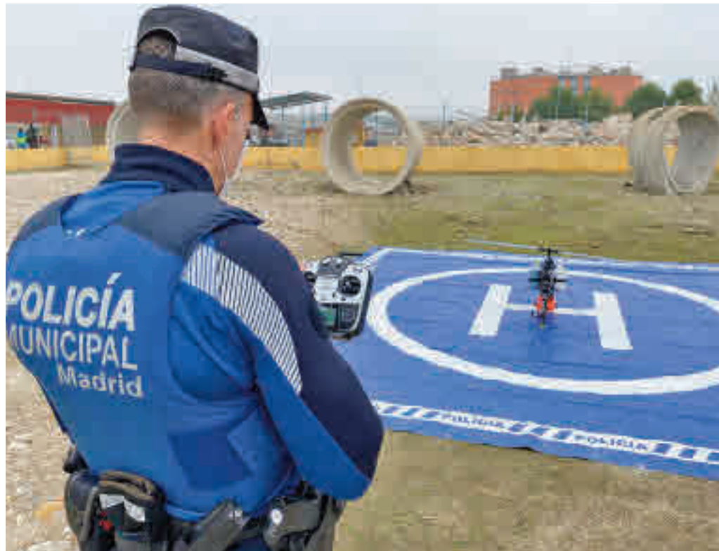
Un agente municipal maneja uno de los dispositivos de la unidad de drones

El alcalde de Madrid, José Luis Martínez-Almeida, pre-