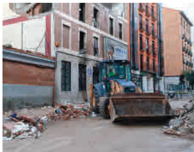
El desmontaje del edificio empezó el 25 de enero

la explosión del pasado 20 de enero de un edificio de la calle Toledo, 98. El mismo día del suceso se incoaron unas diligencias de investigación para determinar lo ocurrido. La juez está a la espera de dicho informe y conforme a las