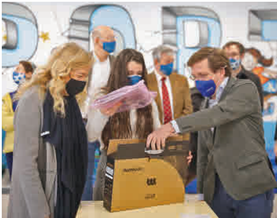
El alcalde de Madrid entrega un ordenador a una alumna

El programa favorecerá, además, a más de 10.000 alumnos de más de 225 centros educativos y para ello se desarrollará un programa de economía circular dándole un segundo uso a dispositivos de ciudadanos y empresas. En una fase más avanzada, el objetivo es llegar a 35.000