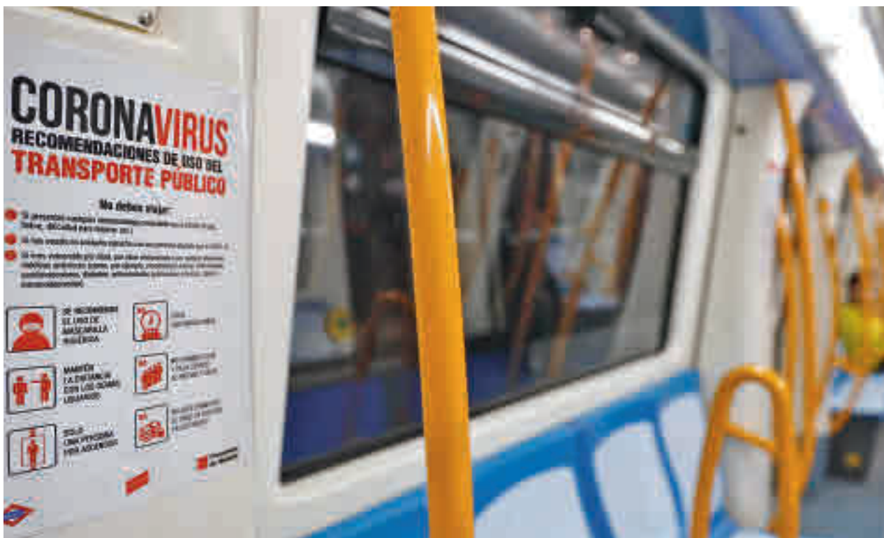
Normativa contra la Covid-19 en el Metro de Madrid