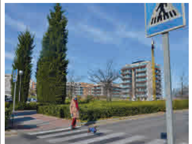
Uno de los pasos de cebra que se iluminarán

La ciudad con una tasa más baja es Pinto, que registra 150 contagios por cada 100.000 habitantes, cuando el pasado 9 de diciembre tenía 146. A continuación aparece Valdemoro, que ha pasado de 161 a 164, mientras que Parla ha crecido de 184 a 192. Ninguna Zona Básica de Salud se acerca a los 400.