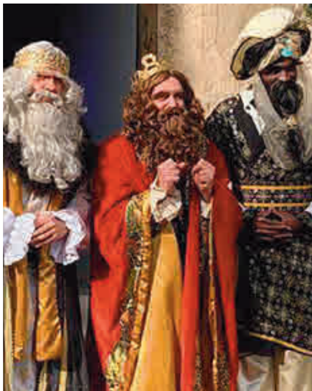
La Navidad ya se vive en la zona Sur

En el caso de la localidad parleña, los menores podrán acudir con cita previa entre el 21 de diciembre y el 4 de enero de 17 a 20 horas a la Casa de la Cultura para entregar las cartas a sus pajes. Sus Majestades tendrán una recepción el martes 5 en la que dirigirán un mensaje 'online'.