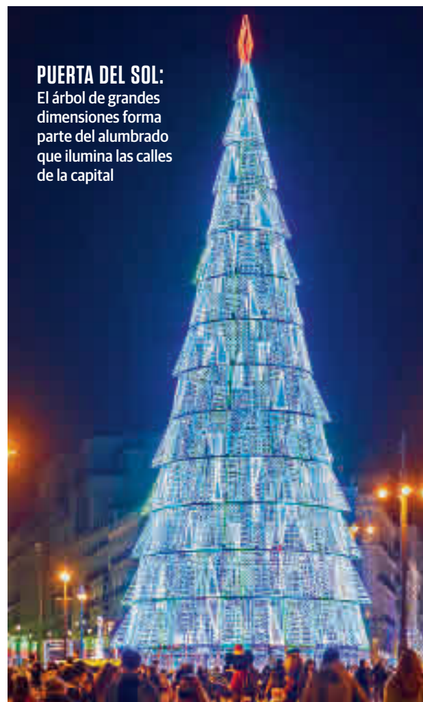
PUERTA DEL SOL: El árbol de grandes dimensiones forma parte del alumbrado que ilumina las calles de la capital

Habrà cinco escenas diferentes: un bosque de abetos, (del 21 al 23 de diciembre); un pesebre (24 y 25 diciembre); una montaña rusa de juguetes (del 26 al 28 de diciembre), los mejores deseos para el 2021 (del 29 al 31 de di-