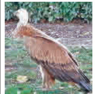
Imagen del ejemplar