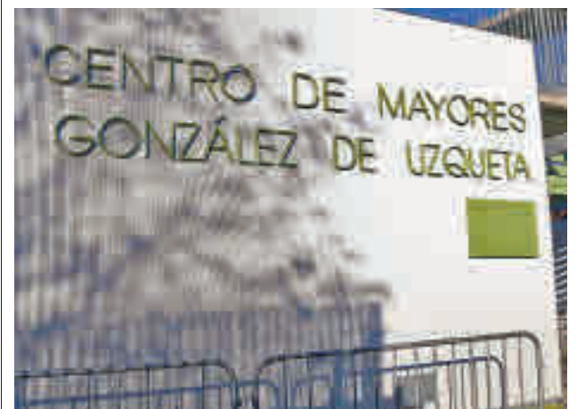
Centro de mayores Juan González de Uzqueta

Toda la actualidad de la zona Noroeste en nuestra web