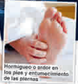
Hormigueo o ardor en los pies y entumecimiento de las piernas

¿Pregunte a su farmacia de confianza por el nuevo complejo Mavosten Forte!