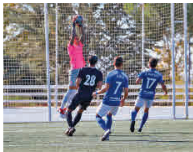
Las Rozas obtuvo su billete gracias a la Copa Federación

A pesar de ello, el fútbol madrileño también tiene representación de los más modestos. El Navalcarnero, campeón de Tercera División en la 2019-2020, recibirá al Badajoz (jueves, 18 horas), mientras