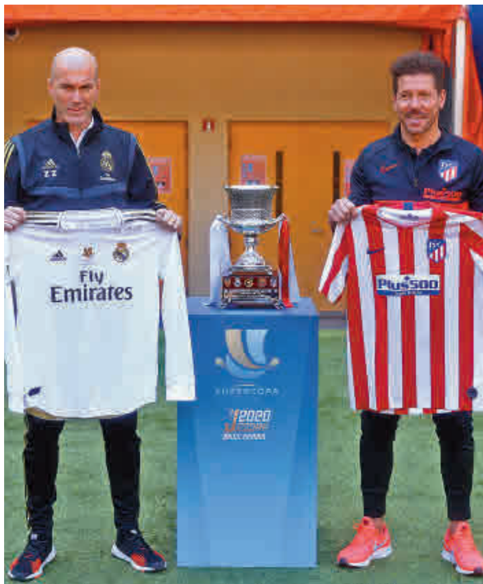
Una de las últimas veces que se enfrentaron fue en la final de la Supercopa

A pesar de esas extraordinarias estadísticas, al igual que Zidane, Diego Pablo Simeone también ha tenido que lidiar con las críticas. Dos empates consecutivos sin goles ante el Huesca y el Villarreal invitaron a un sector de aficionados