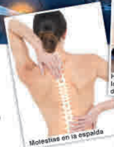
Molestias en la espalda

plir su función. Por esta razón el nuevo Mavosten Forte contiene los 8 tipos de vitamina B. Por ejemplo, la vitamina B5 ayuda a la síntesis y al metabolismo de ciertos neurotransmisores. Las vitaminas B2 y B12 promueven, a su vez, la preservación de la capa de mielina, una capa grasa que rodea y protege las fibras nerviosas, y asegura que las señales se puedan transferir sin inconvenientes.