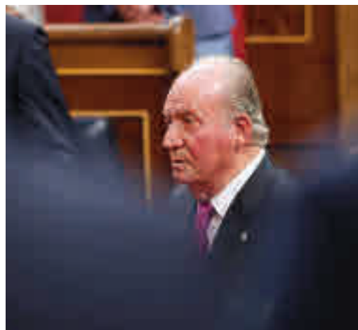
El rey emérito, en una imagen de archivo

EL PERIÓDICO GENTE NO SE RESPONSABILIZA NI SE IDENTIFICA CON LAS OPINIONES QUE SUS LECTORES Y COLABORADORES EXPONGAN EN SUS CARTAS Y ARTÍCULOS