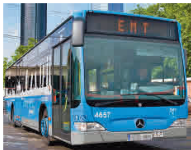
Una de las líneas urbanas que recorren la capital

EMT acaba de licitar con el objetivo de retirar de la circulación la flota más contaminante del organismo público y mejorar la calidad del aire. Según fuentes municipales, de esta manera se adelanta tres años la previsión que establecía el plan de calidad del aire vigente donde se fijaba de límite temporal 2025 para que todos los autobuses de la EMT fueran flota