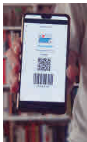
Actual aplicación sanitaria

tual estará accesible a partir del lunes 14 de diciembre en móviles y tablets, donde se podrá registrar el historial de test Covid. Tendrá el mismo uso que la tarjeta física, pero en ella además se podrá consultar la medicación prescrita y la fecha de su disponibilidad en farmacias. Los usuarios podrán acceder a las