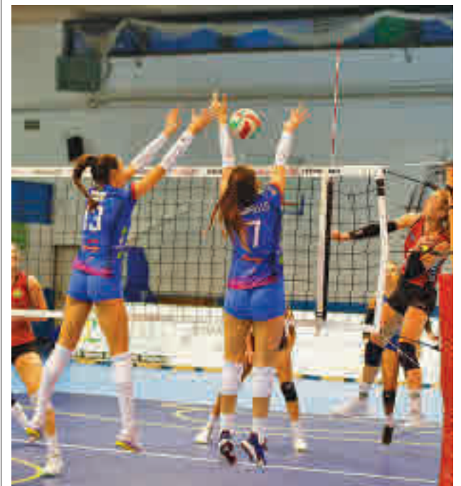
Las alcobendenses cayeron en La Rioja

Por su parte, el Madrid Chamberí tratará de enderezar su rumbo. Este sábado 12 (19:30 horas) recibirá al colista, el Cartagena, con el que está igualado a seis puntos.