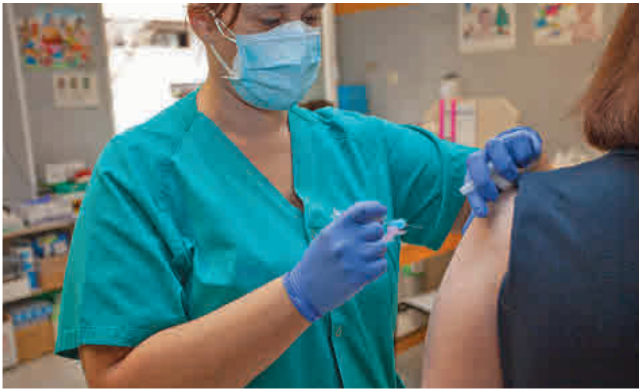
Campaña de vacunación contra la gripe en la Comunidad de Madrid