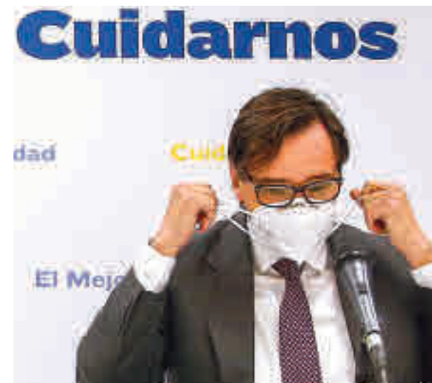
El ministro de Sanidad, Salvador Illa

"Por eso ahora pedimos extremar las medidas de precaución y también al valor de la solidaridad: lo que hacemos afecta al resto de ciudadanos", recordó Illa, que insistió en que hay que reducir mucho más las cifras de contagiados.