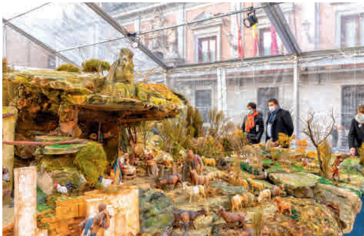
Varias personas contemplan el Nacimiento situado en la Plaza de la Villa

Permanecerá abierto hasta el 5 de enero, con turnos cada 15 minutos y el acceso es gratuito previa descarga de