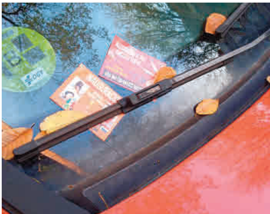
Un parabrisas con varios folletos de prostitución

Asociaciones vecinales y la plataforma 'No Acepto' solicitaron tiempo atrás al Ayuntamiento de la capital una mayor vigilancia para evitar la proliferación de este tipo de