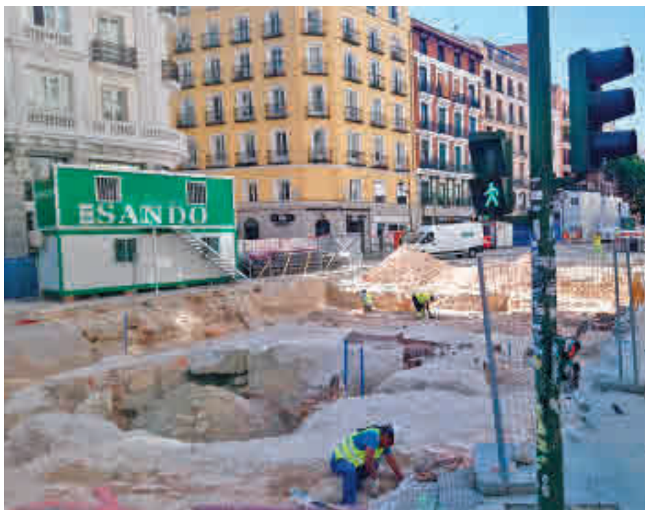
Los trabajos de remodelación en la calle de Montera

Según fuentes municipales, con la ejecución de este proyecto el Consistorio dará cobertura a las necesidades y aspiraciones de ocio tanto de las personas mayores como de los jóvenes, una petición largamente demandada por los vecinos.