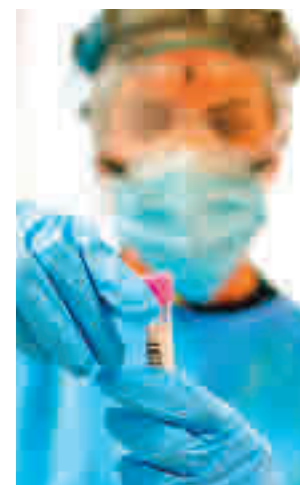
Una sanitario hace una PCR

Al margen de las limitaciones en las zonas básicas de salud, en toda la región sigue vigente el toque de queda, con la prohibición de movimien-