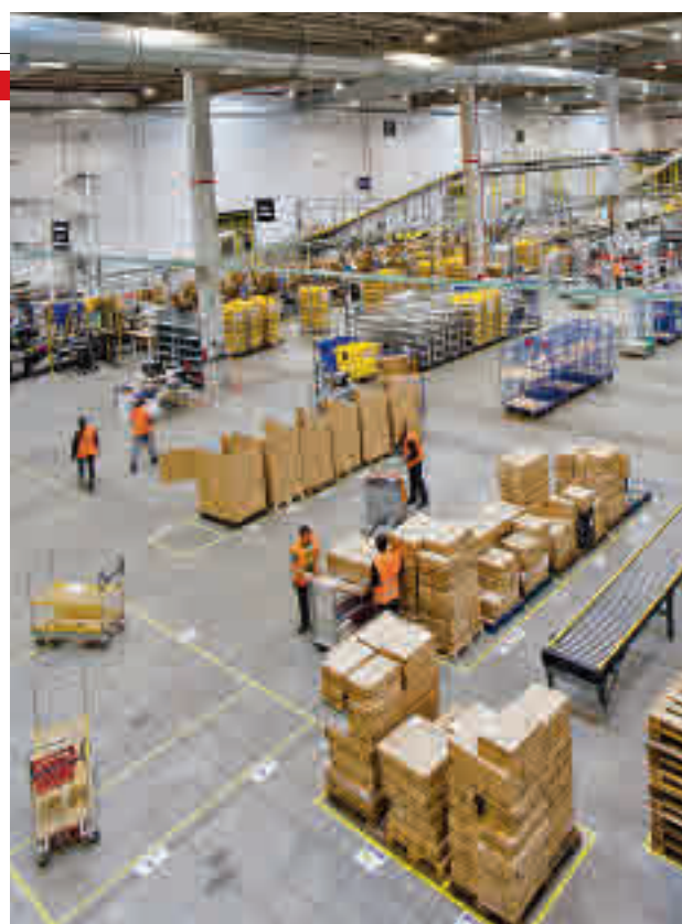
Los centros logísticos necesitarán empleados

Junto a estos perfiles ligados al comercio ‘online’, el sector del gran consumo de-