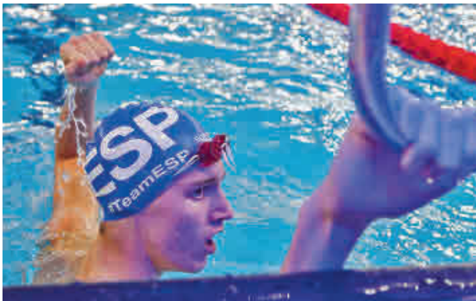
El madrileño ya se entrena en la Residencia Joaquín Blume