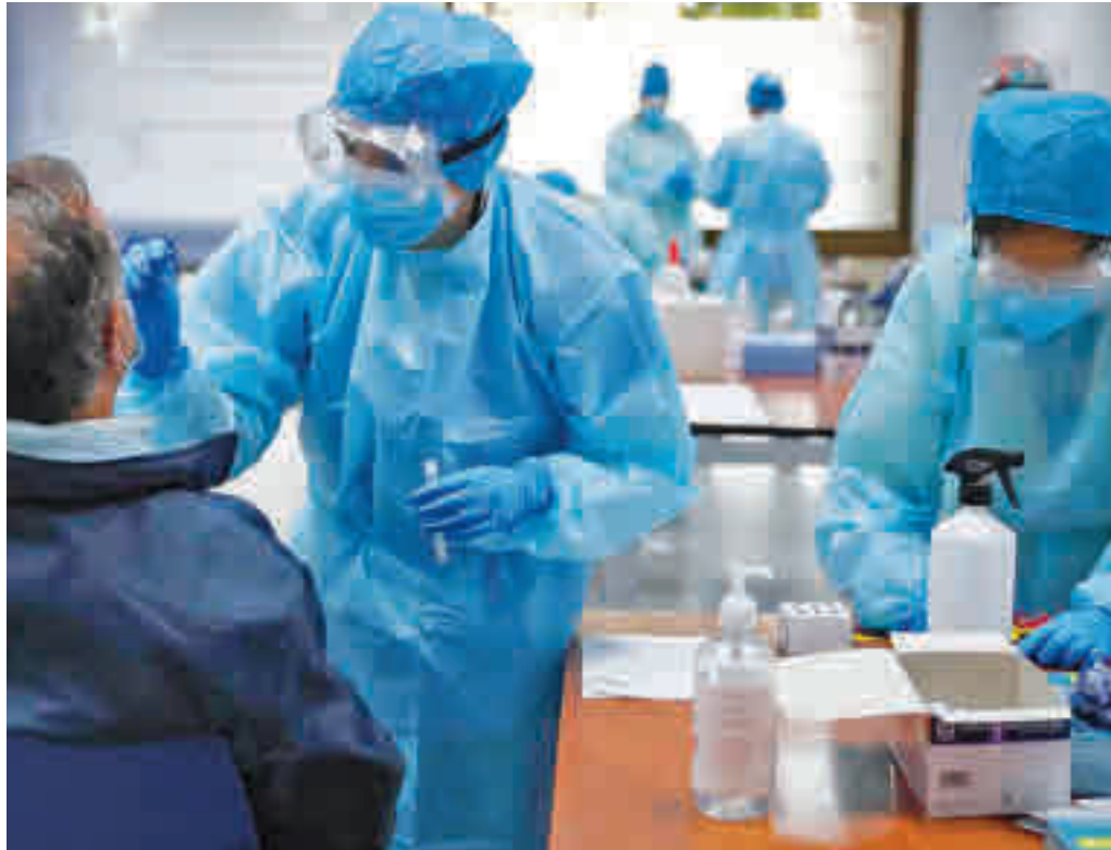
Los test de antígenos se han realizado en varias localidades

Desde ese prisma, las perspectivas a corto plazo para los municipios del Corredor del Henares son bastante positivas, dentro de la gravedad de esta pandemia. Así, solo una de todas las ZBS de este área, la de Jaime Vera, tiene una tasa de incidencia acumulada por encima de los 300 casos por cada 100.000 habitantes. En concreto, esa zona de Coslada tiene un índice de 311,06, tras un repunte en los últimos siete días. Con una visión un poco más amplia, en la ZBS de Jaime Vera se han detectado un total de