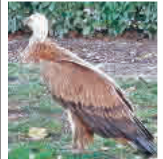
Imagen del ejemplar