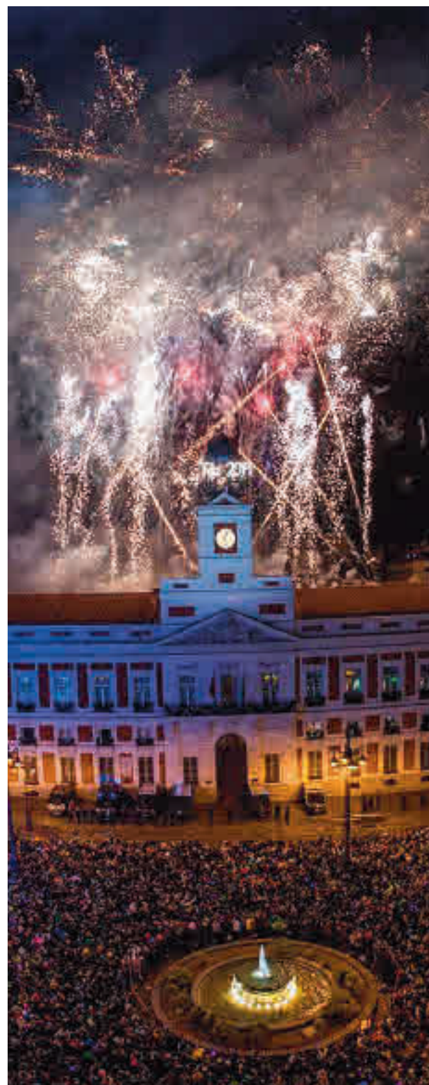
Campanadas en la Puerta del Sol

La Comunidad ha realizado un llamamiento para que los jóvenes que estudian en otras partes de España o de Europa y que vayan a regresar a la región para pasar las fiestas con sus familias restrinjan sus contactos sociales en la medida de lo posible durante los diez días anteriores a su viaje. En cuanto a los mayores que salgan de las residencias, se sugiere que se queden en un único domicilio y que solo interactúen con una única burbuja de convivencia.