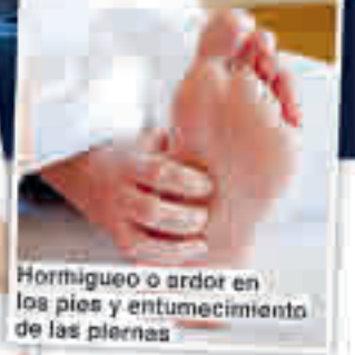
Hormigueo o ardor en los pies y entumecimiento de las piernas

¿Pregunte a su farmacia de confianza por el nuevo complejo Mavosten Forte!