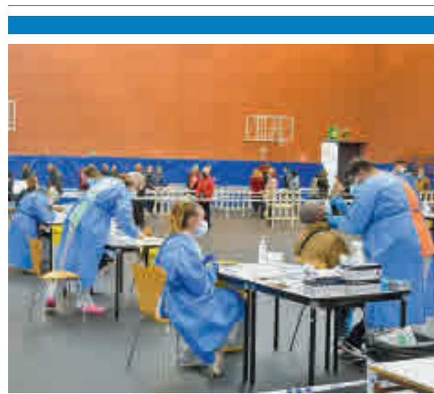
Test de antígenos en Torrejón de Ardoz