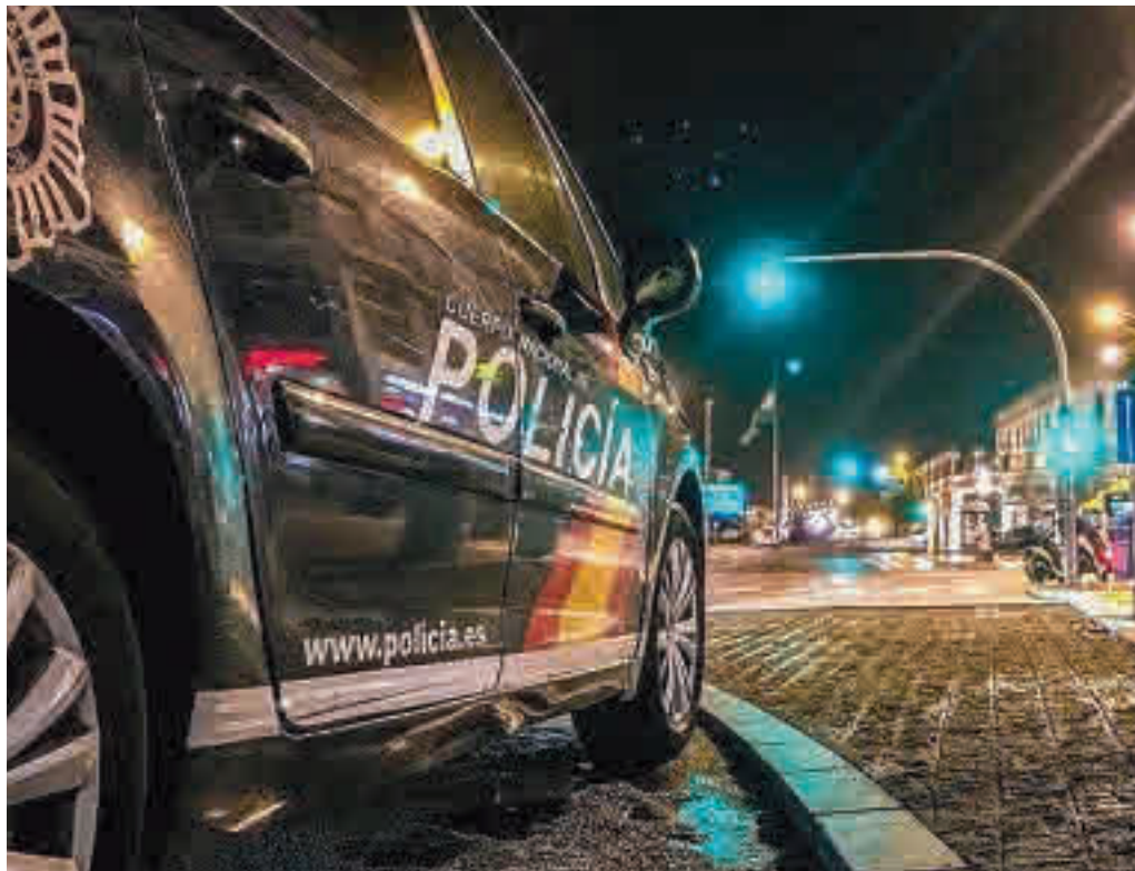
El 59% de los delitos denunciados en la región de Madrid, tuvieron lugar en la capital

Sin embargo, a diferencia del conjunto de España, tanto en la Comunidad de Madrid como en la capital los