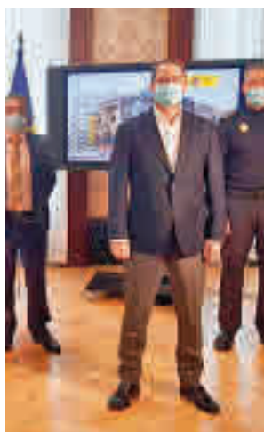
Imagen del encuentro

Sobre ello, el primer edil torrejónero pide que se endurezca la reincidencia para que los delincuentes con numerosos antecedentes no salgan en libertad después de cometer más delitos, así como que se valore la reforma de la Ley del Menor.