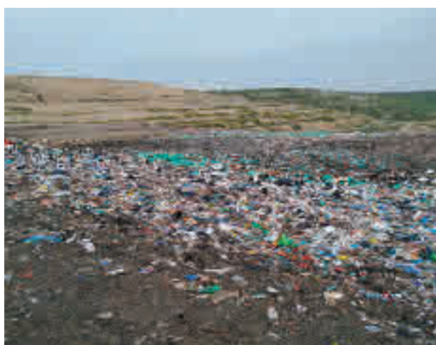
El vertedero situado en el distrito de Villa de Vallecas