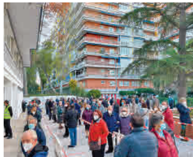
Imagen de test de antígenos en Torrejón