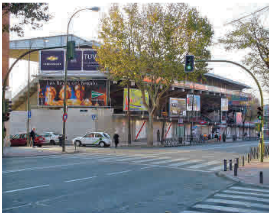
La avenida de la Albufera, una de las arterias viarias de Puente de Vallecas

Puente de Vallecas fue uno de los primeros distritos en ser objeto de medidas quirúrgicas para frenar el avance del coronavirus ante las protestas reiteradas de los colectivos vecinales, que acusaron al Gobierno regional de segregarlos con respecto a otros puntos de la región y de la capital. La Asamblea de Madrid y los centros de salud fueron los escenarios de diferentes actos de protesta en defensa de la Sanidad pública y contra la gestión de la pandemia por parte de la presidenta, Isabel Díaz Ayuso. El