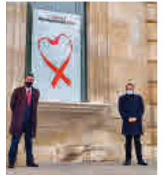
Celebración del día 1