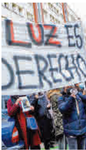
Una de las protestas