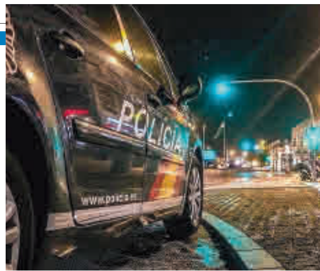
El 59% de los delitos de la región tuvieron lugar en la capital

les acabaron con penetración, solo siete menos que el año pasado pese al confinamiento. El recorte más pronunciado se produjo en los delitos contra la propiedad. Así, se notificaron 5.579 robos con violencia e intimidación, un 27,5% menos. A su vez, los