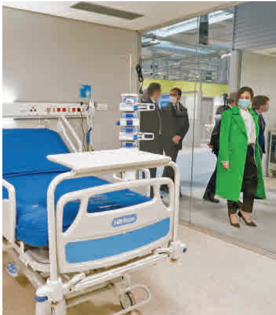
Inauguración del Hospital Enfermera Isabel Zendal

Su consejero de Sanidad, Enrique Ruiz Escudero, afirmó que Madrid es “capaz de hacer posible, lo que otros creen imposible”. “Los madrileños y el conjunto de los españoles van a estar más se-