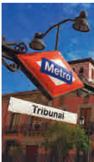
La estación de Metro