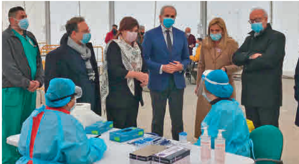
Pruebas de antígenos en Collado Villalba

Toda la actualidad del Noroeste en nuestra página web