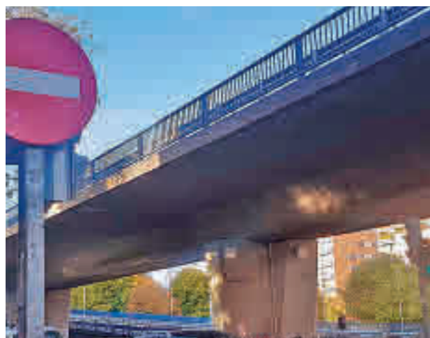
El de Pacífico es el último viaducto existente en la capital

Estos residentes alertan de los daños medioambientales que genera el viaducto, así como los problemas de ruido y contaminación.