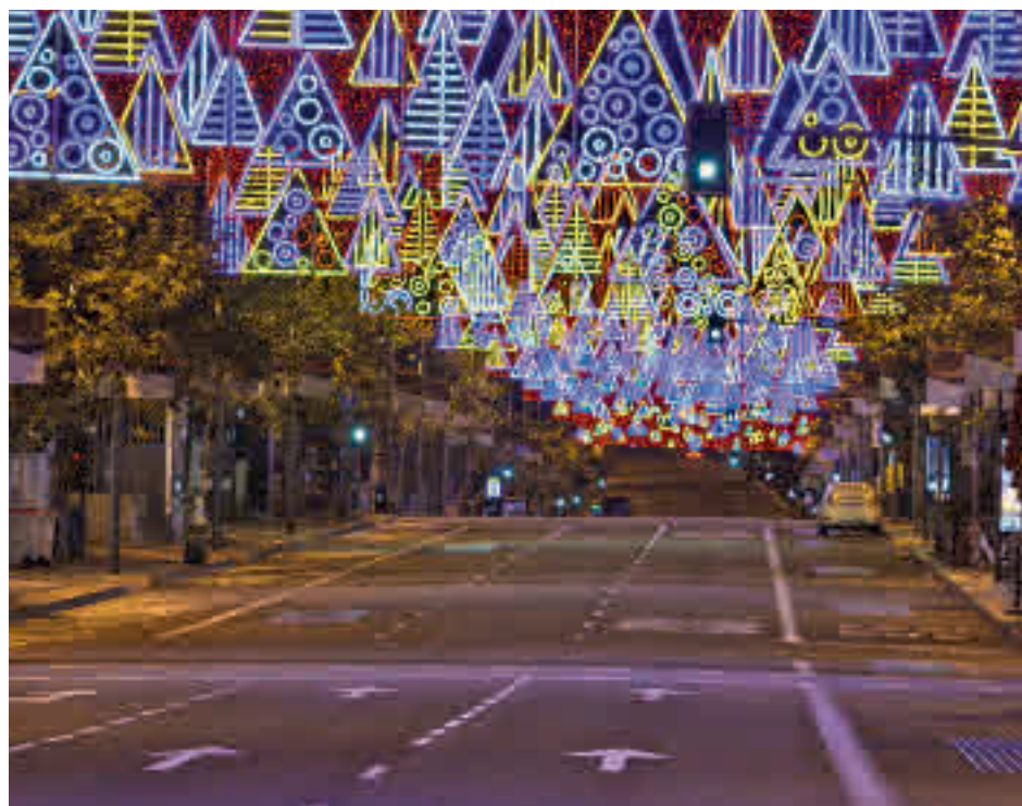
Las luces que iluminan la capital desde el pasado 26 de noviembre

Por otro lado, comentan que la subida y bajada al autobús se realizará por unidades familiares de forma ordenada y con un "riguroso control de acceso" llevando el registro de los datos de los viajeros. "La trazabilidad de los usuarios del bus de la Navidad está