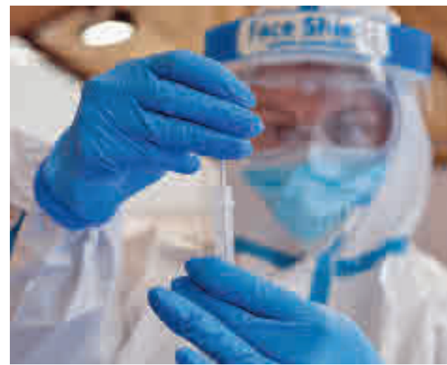
La incidencia acumulada se ha rebajado