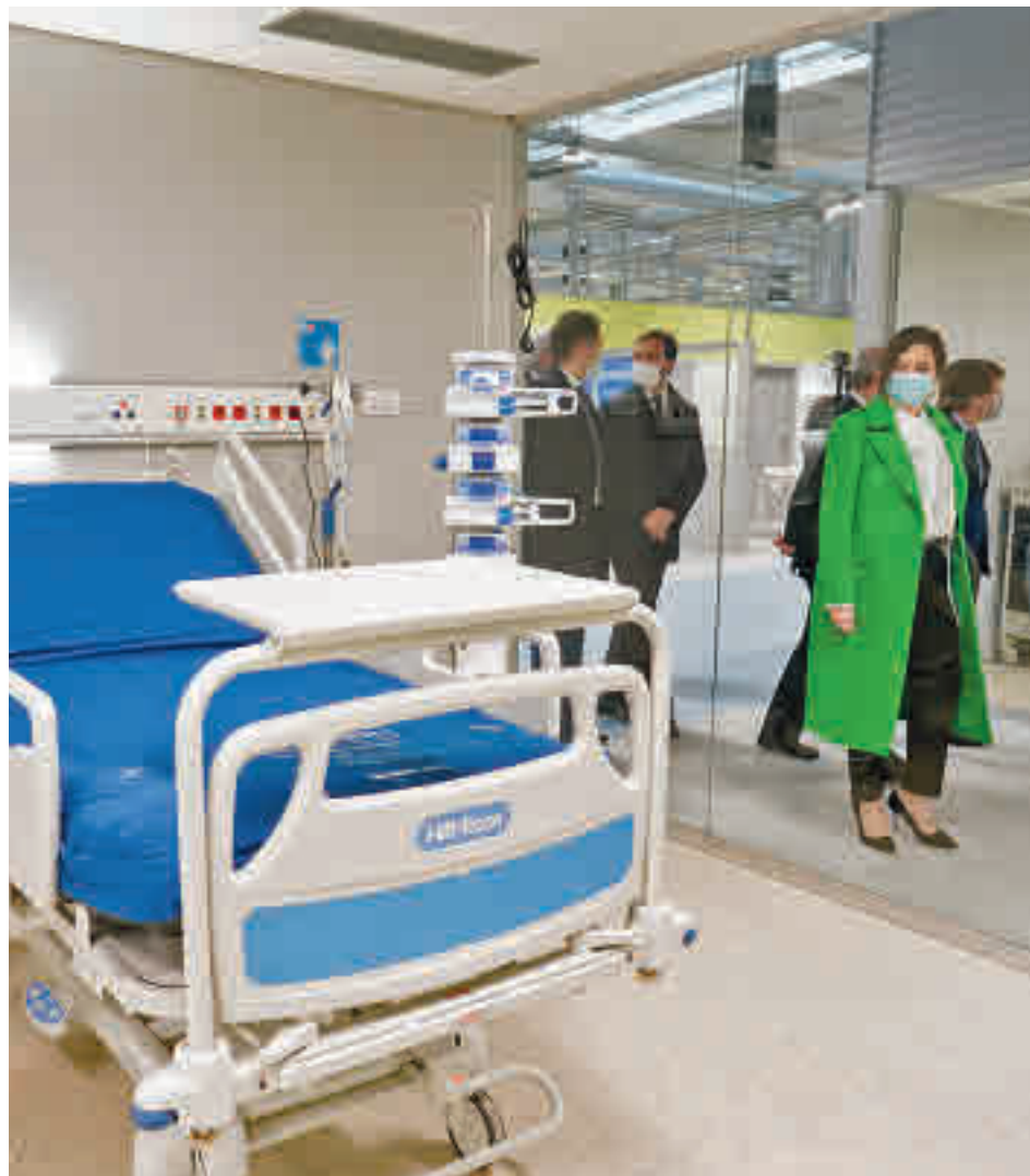
Inauguración del Hospital Enfermera Isabel Zendal