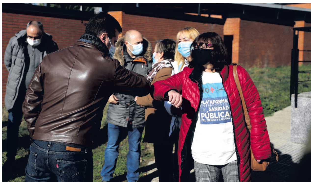
El secretario general del PSOE de Castilla y León, Luis Tudanca, en su visita al centro sanitario en El Bierzo (León).

los que no se atiende. Y señaló el caso de Oncología, lo que genera la “paralización” de las consultas. Por eso, reivindicó al Gobierno de Castilla y León una “solución inmediata a este problema y una planificación adecuada”.