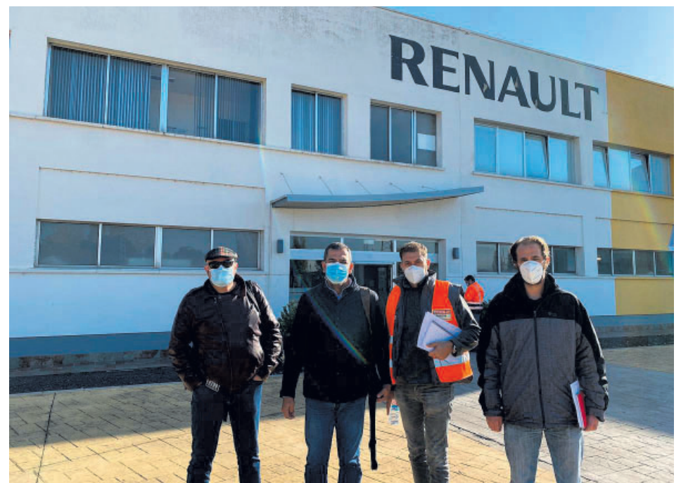
Comisión negociadora para el convenio colectivo de Renault España.