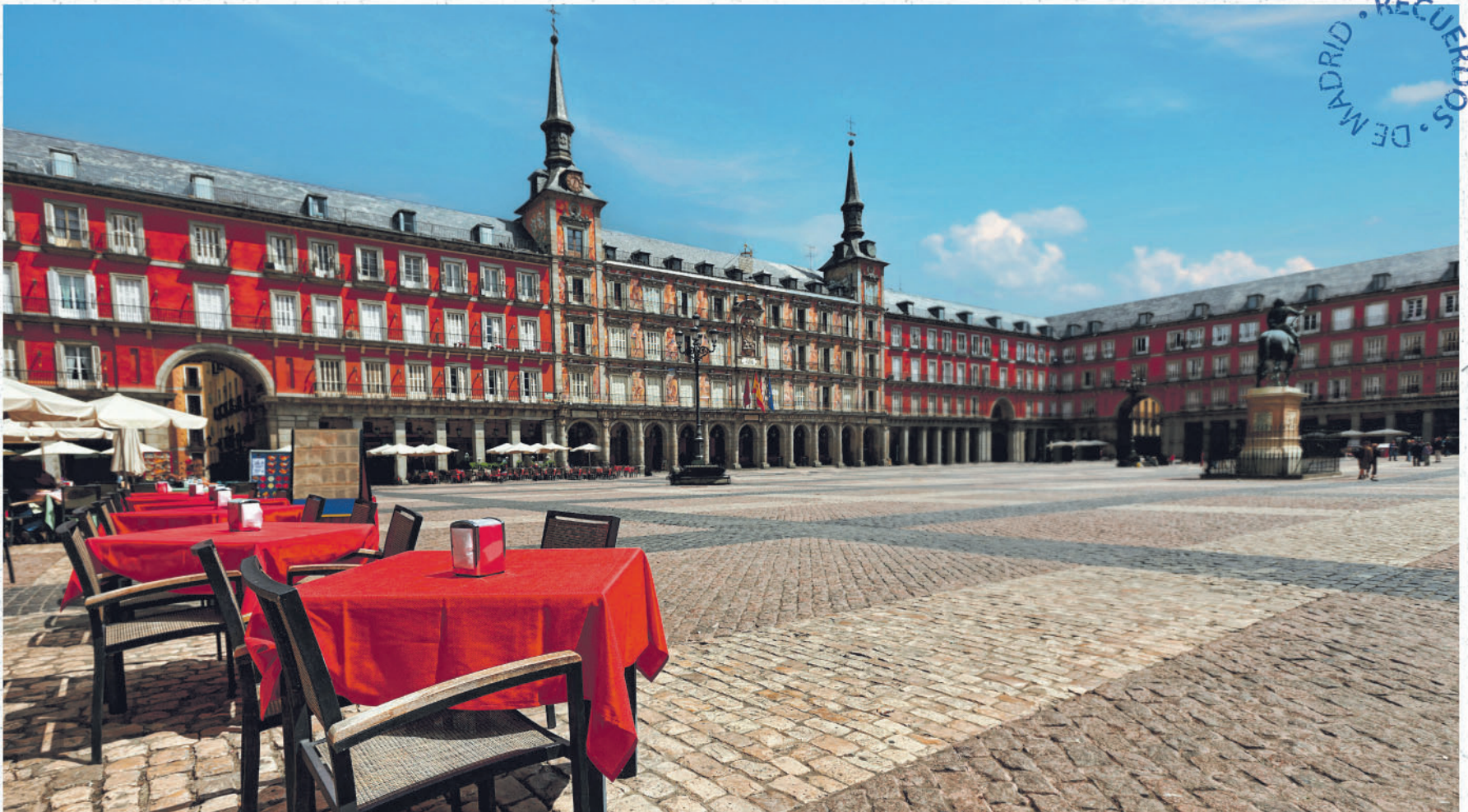
*PLAZA MAYOR DE MADRID.