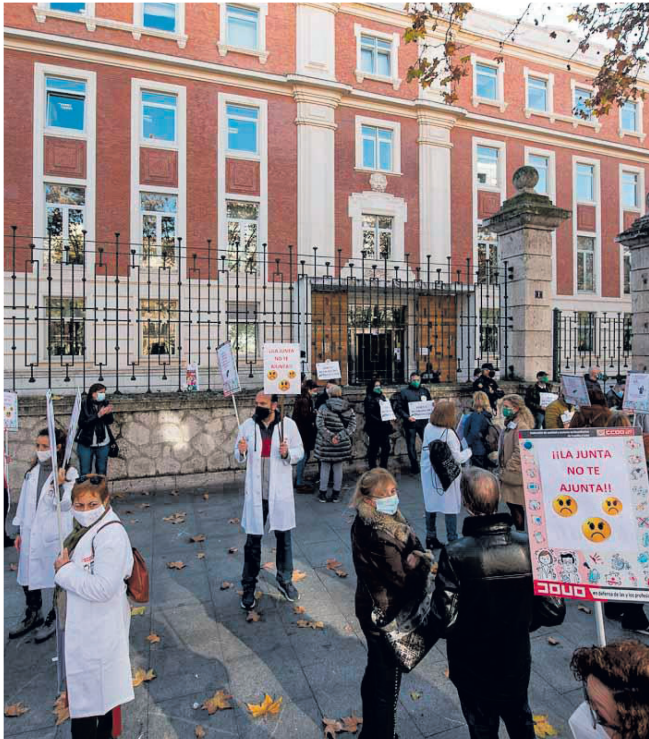
Concentración de sanitarios de Castilla y León contra el Decreto que modifica sus condiciones laborales.

Por eso, hizo un llamamiento a la cordura para que se reconduzca la situación, para lo cual, indicó, el PSOE hará todo lo que esté en su mano con el objetivo de reforzar la atención sanitaria y dotarla de más recursos siempre, advirtió, bajo las premisas de que estos cambios se hagan con