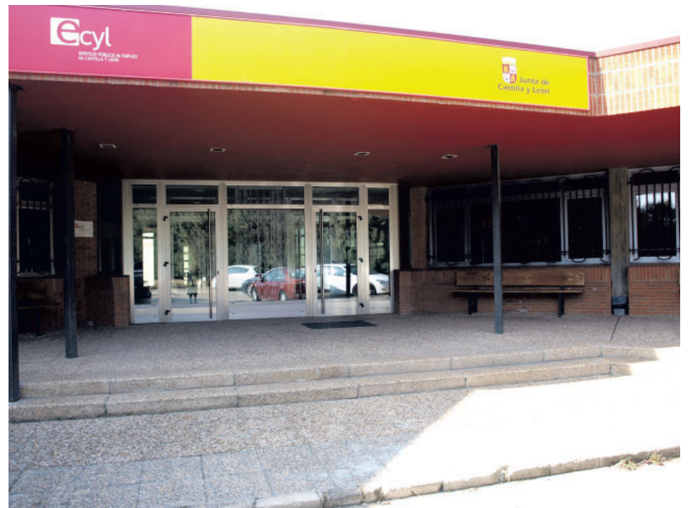
Oficina del Servicio Público de Empleo de Castilla y León (ECYL).

El secretario general del PSOE CyL, Luis Tudanca, lamentó hace unas fechas la incapacidad de la Junta de Castilla y León de garantizar una sanidad pública capaz de afrontar la pandemia. "El Gobierno de Castilla y León no puede limitarse a restringir, tiene también que poner medios a disposición de la sanidad pública", remarcó el líder del PSOE en la región, Luis Tudanca.