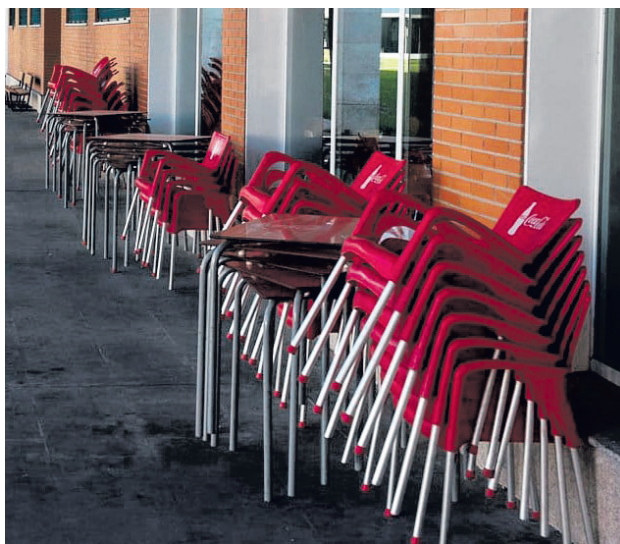
Los establecimientos de hostelería de la región permanecen cerrados.