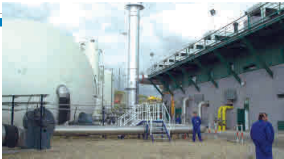
La incineradora de Valdemingómez

Además, los amantes del séptimo arte tienen una cita con proyecciones de cine español e internacional con especial atención al XI Ciclo ‘Miradas de Mujer’ en el Centro Cultural Buero Vallejo, con títulos destacados como ‘Madre’ o ‘Júlia Ist’, entre otros.