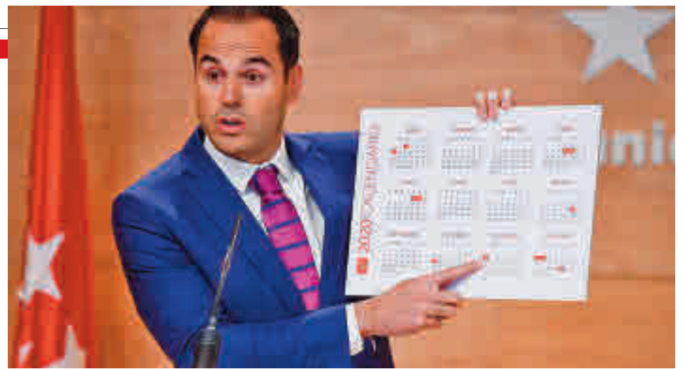
Ignacio Aguado, durante la presentación del calendario laboral de 2020

munidad (si es que se puede) serán los cinco días del Puente de Diciembre (del sábado 4 al miércoles 8, aunque el martes 7 es laborable) o las cuatro jornadas de la Semana Santa (del jueves 1 al domingo 4 de abril). El resto será para escapadas cortas.