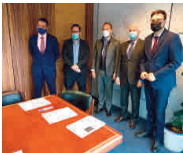
Representantes de diferentes localidades

Bienestar Social reconoce y elogia el esfuerzo de la Hermandad y la aportación de la ayuda directa por parte de dichos voluntarios, que contribuyen a favorecer un clima más integrador en comedores sociales y otros lugares, donde las personas más excluidas no solo reciben alimento sino que, además, encuentran un lugar para la socialización y la inclusión.