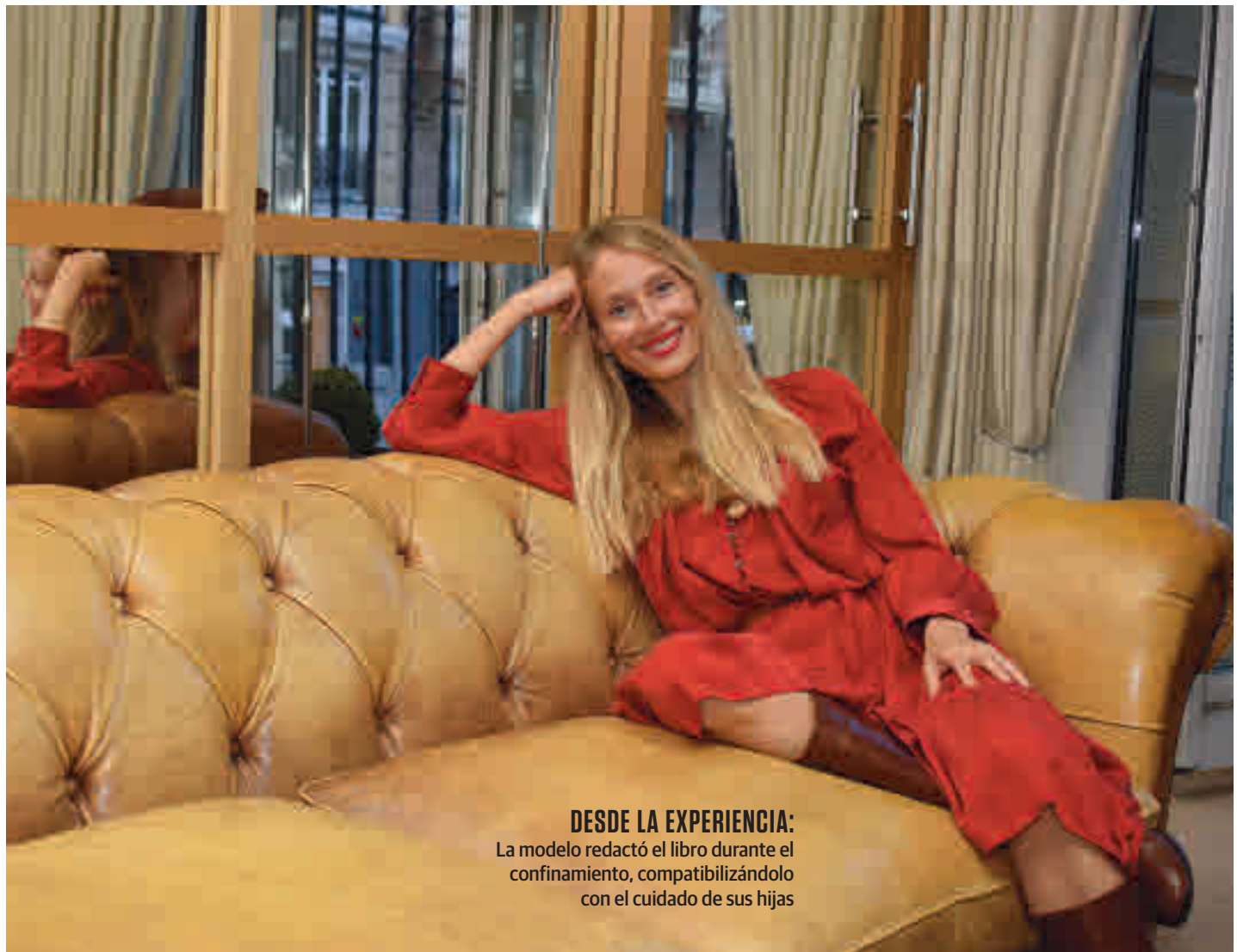
DESDE LA EXPERIENCIA: La modelo redactó el libro durante el confinamiento, compatibilizándolo con el cuidado de sus hijas

Creo que es fácil y nos sale de forma automática; el modelo educativo que conocemos es aquel en el que el padre y la madre deciden y los hijos obedecen. Nuestra sociedad también era muy jerárquica. Ahora las cosas están cambiando, también a nivel familiar, merece la pena revisarnos para mejorar. Yo estoy en esa búsqueda, en ese deseo, y te das cuenta como madre de que no tienes herramientas, necesitas que te ayuden, porque ser padre no significa ser un buen educador, para eso tenemos que informarnos. Se supone que por ser padre ya tienes que saber educar y eso no es cierto, nadie nos ha enseñado.