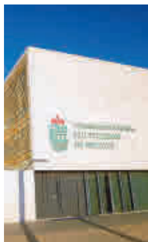
Fachada del Ayuntamiento

presentación en el Consistorio firmaron de forma conjunta un comunicado en el que condenaban estas manifestaciones, poniendo el acento en que San Fernando es "una ciudad inclusiva y acogedora, multicultural y multirracial en la que todas/os tenemos cabida, independientemente de nuestra nacionalidad, color, raza, sexo y/u orientación sexual".