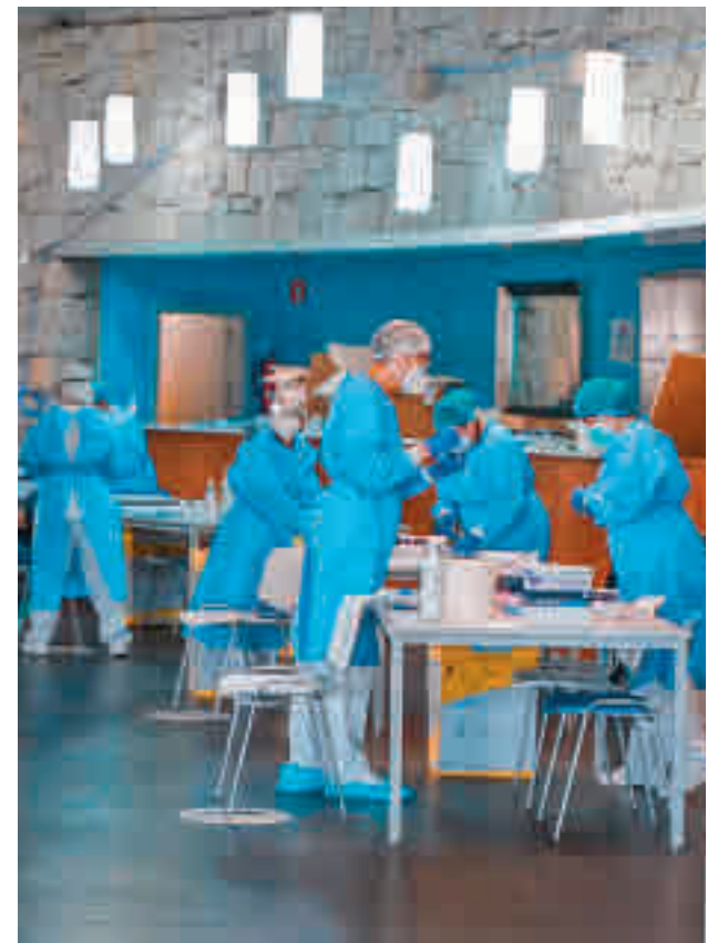
Test de antígenos en Colmenar Viejo

En lo que a Tres Cantos y Colmenar Viejo se refiere, este informe epidemiológico re-