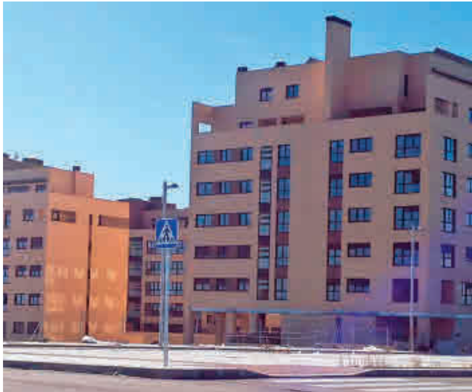
Una promoción de viviendas en construcción en el barrio de El Cañaveral

Asimismo, el análisis destaca que la evolución de la actividad en el sector de oficinas registra su cifra más ele-