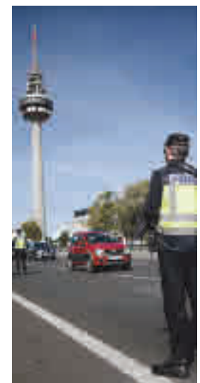
Control en Madrid

“Queda muchísimo por hacer pero las cosas van mejorando”, insistió Ayuso que destacó algunos de los datos que su consejero de Sanidad ha ido desvelando en los últimos días y que el Gobierno central puso en duda en un primer momento. Según estas cifras, la incidencia (número de contagios por cada 100.000 habitantes) en la región habría bajado de 869 a 586 en las últimas dos semanas.