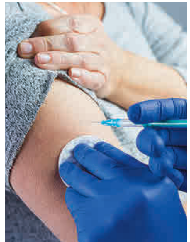
Vacunación contra la gripe