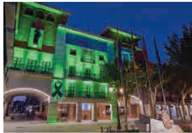
Iluminación verde por el Día Mundial del Ostimizado

Por otro lado, la Concejalía de Educación ha organizado Acogida Educativa, acti-