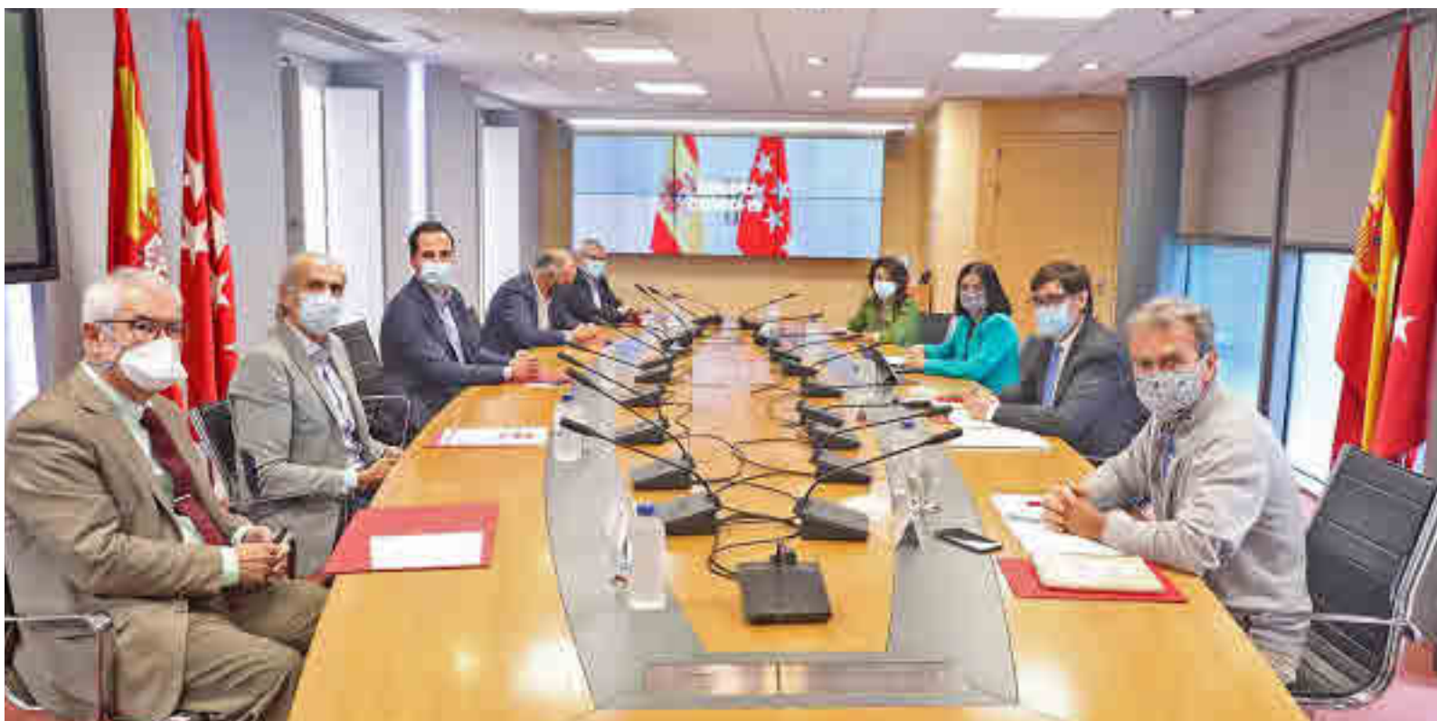
Una de las reuniones que han mantenido en los últimos días la Comunidad de Madrid y el Gobierno central