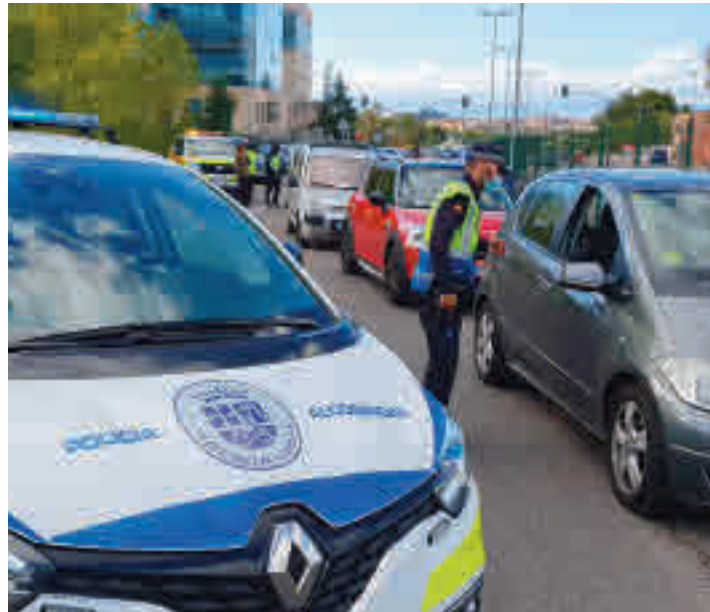
Control policial en Alcobendas

La localidad alcobendense es una de las diez que está bajo las restricciones del Gobierno central • En el caso de Sanse, solo está confinada la Zona Básica de Salud de Reyes Católicos