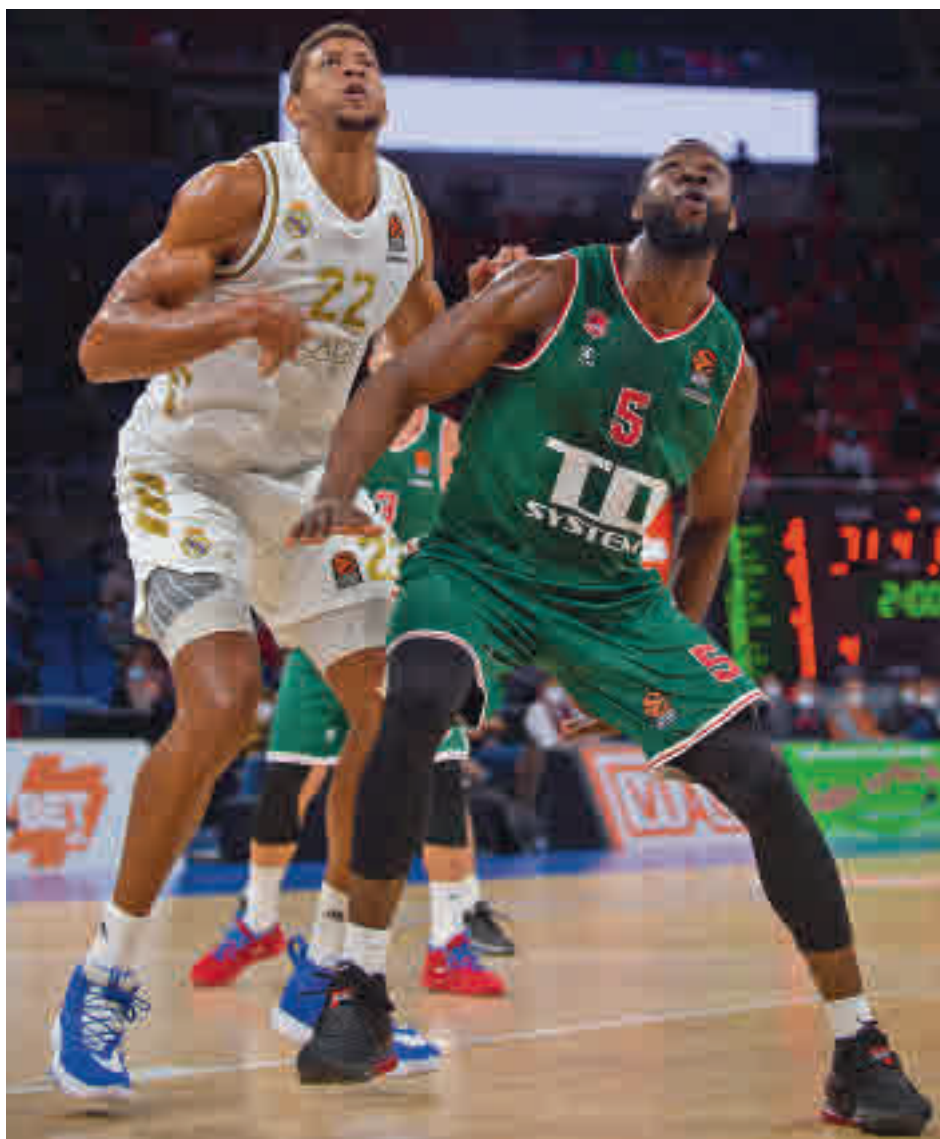
El Real Madrid inició su andadura en la Euroliga con una derrota en la pista del Baskonia

Un claro ejemplo de ello se pudo ver el pasado fin de semana en la Liga Endesa. Dos de los equipos con más cartel, el FC Barcelona y el Real Madrid, no disputaron sus encuentros ante el Acunsa GBC y el Herbalife Gran Canaria, respectivamente, por la misma razón. En el Barça fue su entrenador, Sarunas Jasikevicius, y dos miembros más