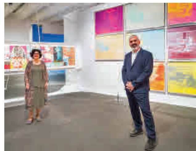
Presentación de la exposición