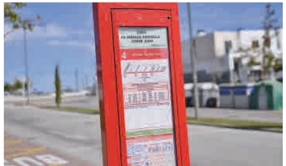
Una de las paradas de la L4 de Boadilla de Monte

Toda la actualidad de la zona Noroeste en nuestra web