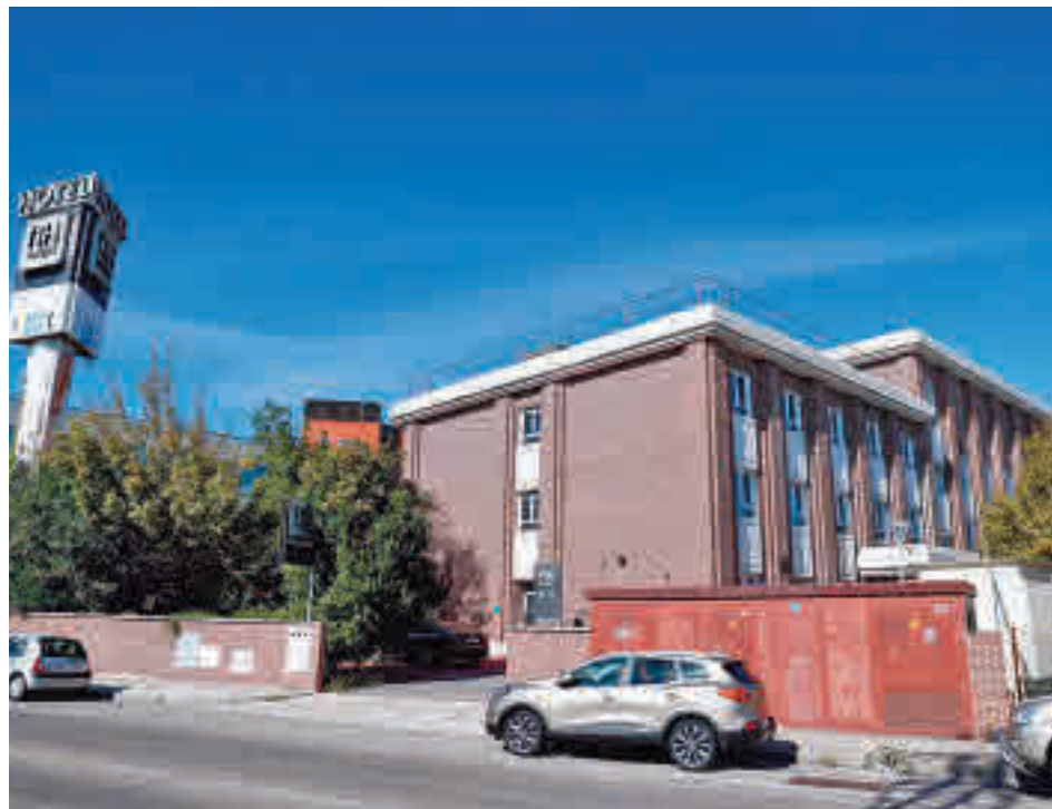
Hotel medicalizado de Leganés

El edificio cuenta con 69 habitaciones y capacidad para 120 enfermos, principalmente personas que necesitan hacer la cuarentena fuera de su hogar y que llegarán