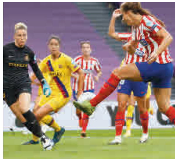
El Barça apeó al Atlético en cuartos de la Champions

El precipitado cierre de campaña por la pandemia del coronavirus y la llegada de nuevos fichajes dieron nuevos bríos al cuadro que ahora dirige Dani González, lo que se tradujo en una buena imagen en el partido de cuartos de final de la