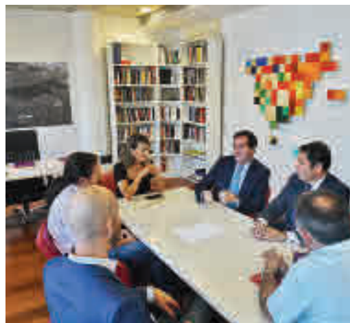
Una de las reuniones con CEOE y Cypyme

EL PERIÓDICO GENTE NO SE RESPONSABILIZA NI SE IDENTIFICA CON LAS OPINIONES QUE SUS LECTORES Y COLABORADORES EXPONGAN EN SUS CARTAS Y ARTÍCULOS