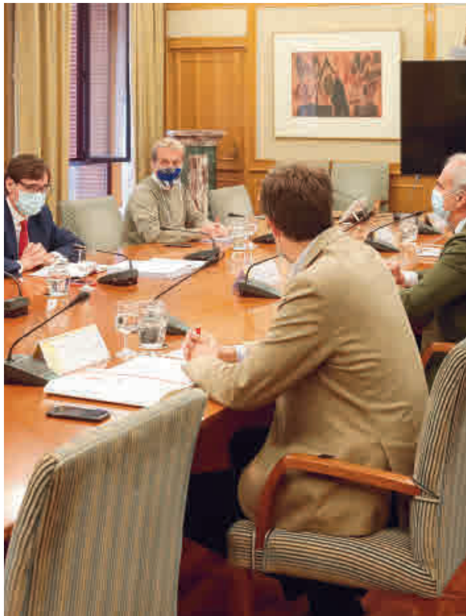
Reunión de esta semana entre el Gobierno y la Comunidad

La Comunidad de Madrid tiene de plazo hasta este sába-