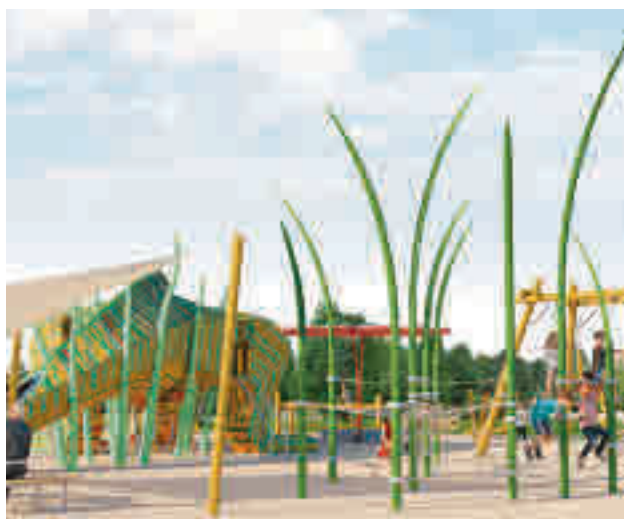
El Montecillo tendrá un nuevo parque

PSOE, Unidas y Más Madrid presentarán una petición administrativa formal para que la alcaldesa "revise su decisión" y, "de no ser respondida", se personarán en los juzgados, para "impedir que siga perjudicándose el comercio local".