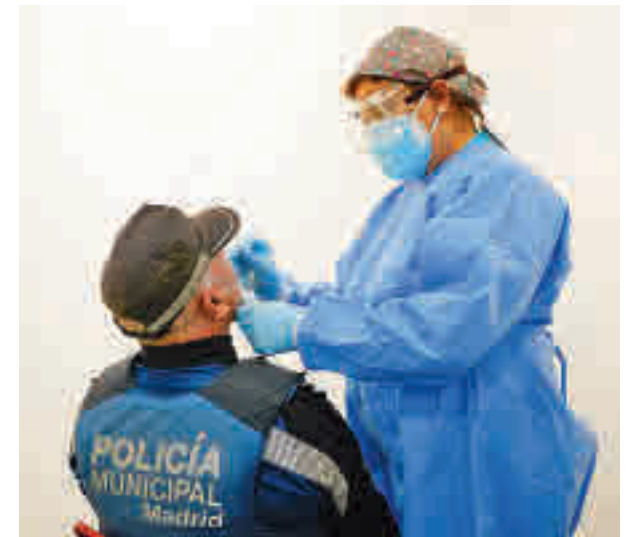
El resultado de los test se conoce en 15 o 20 minutos

En este contexto, los datos de la última semana recogidos en el Informe epidemiológico de la Dirección General de Salud Pública colocan de nuevo a Puente de Vallecas, Carabanchel y Latina como los distritos con más positivos.