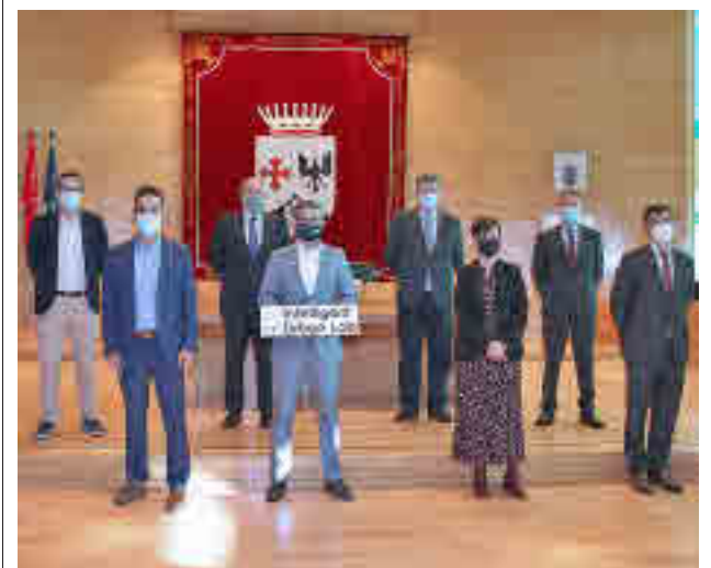
Presentación de Intelligent Urban Lab

En el acto de inauguración, el ministro Pedro Duque adelantó que desde el Gobierno central "seguiremos ayudando en todo lo que podamos a vuestra industria y a todo el sector biotecnológico para construir un sistema más sólido en el que podamos después confiar para el futuro. es el momento de llegar a un acuerdo para incrementar los esfuerzos que hacemos las administraciones". Por su parte, el vicepresidente regional, Ignacio Aguado, incidió en que la presencia de Algenex supone "una garantía geoestratégica para que en el casol como en el que vivimos existan problemas de abastecimiento".