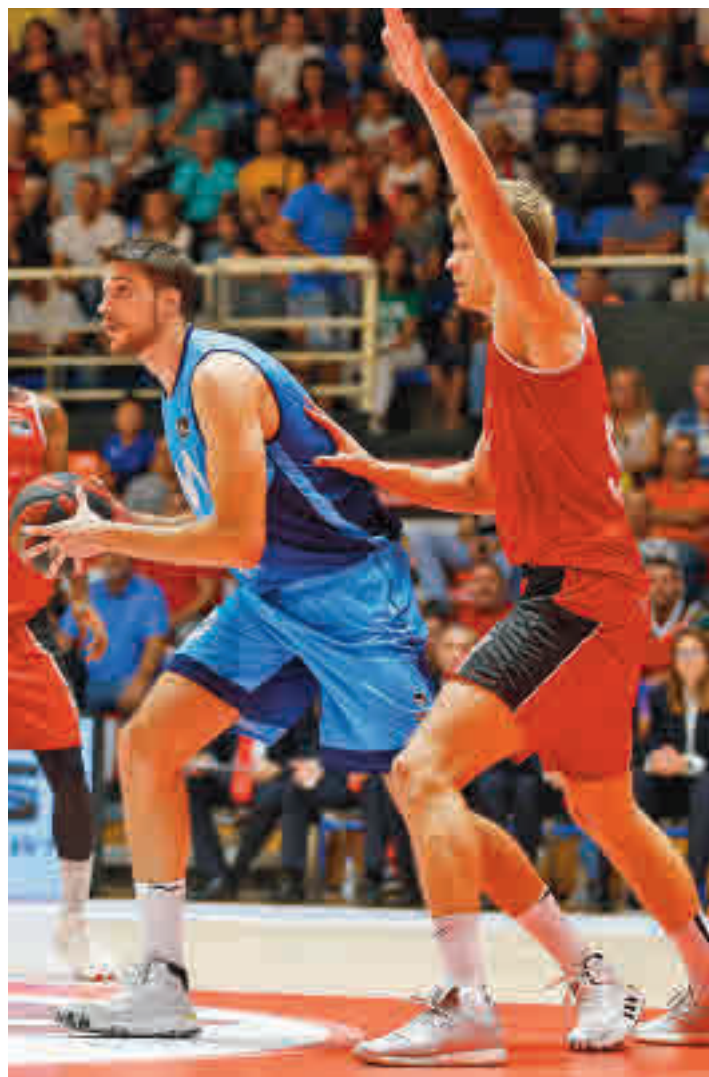
Artega, en un derbi de la pasada campaña MOVISTAR ESTUDIANTES

cación. Después de ese aviso, los dos conjuntos madrileños se toman este curso como una posibilidad de redimirse de sus errores del pasado, aunque, por el momento, no parecen haber encontrado el camino adecuado. El cuadro colegial ha encajado tres de-