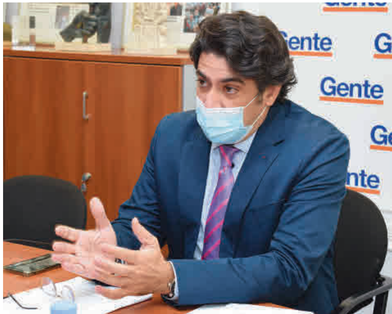
CHEMA MARTÍNEZ / GENTE