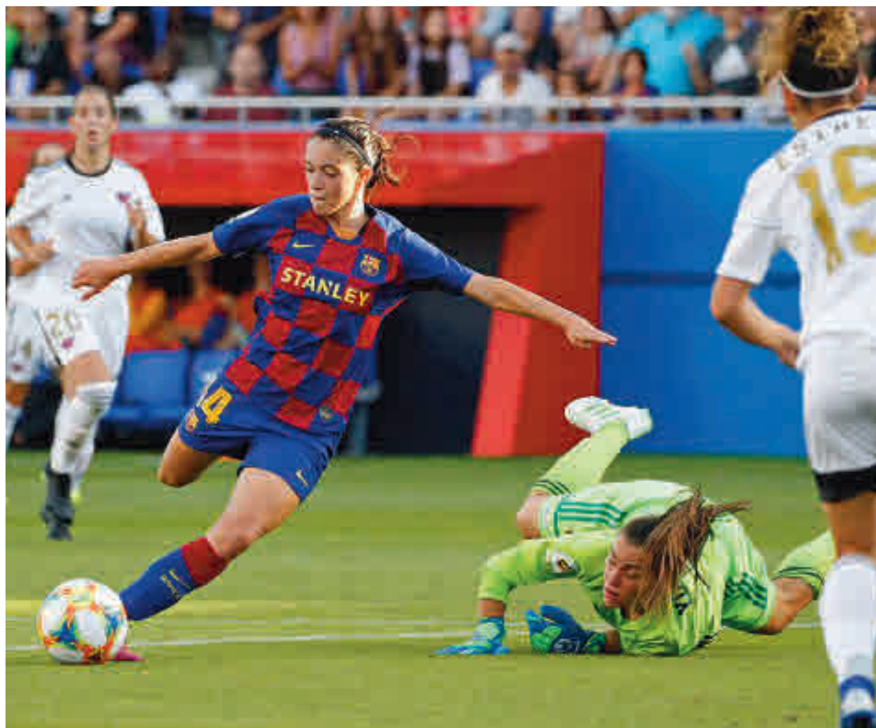
El Barça no dio opción el año pasado al equipo que aún competía bajo el nombre de CD Tacón

Después de un estreno en la Liga Iberdrola donde consiguió estar lejos de los puestos bajos (era décimo al cierre adelantado del campeonato), y a pesar de las goleadas encajadas ante el Barça, el club que ha pasado a denominarse Real Madrid ha decidido otorgar a David Aznar algunos fichajes ilusionantes, con el objetivo de que el equipo blanco se mueva por la zona noble de la tabla. Así, han llegado a Valdebebas dos ex del Atlético como Kenti Robles y Marta Corredera, o la extremo internacional Marta Cardona.