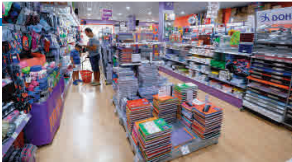
Las ayudas se tendrán que destinar a material escolar

El Ayuntamiento convoca el primer plan de este tipo en la ciudad ● Se podrán solicitar hasta el próximo 6 de octubre