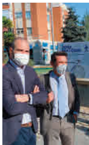
Visita a la instalación

Desde el Consistorio se puso en marcha la colocación de hasta 62 nuevos aparcabicicletas de acero inoxidable tipo U invertida en los