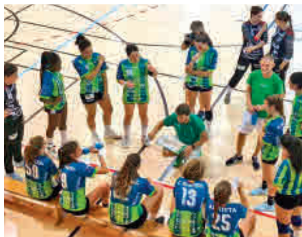
El Ikasa BM Madrid arrancó con una victoria en Getafe (19-25)

Curiosamente, este sábado hay programados otros dos derbis: Base Villaverde-Getasur (18 horas) e Ikasa BM Madrid Boadilla-Jesmon BM Leganés (20:30 horas).