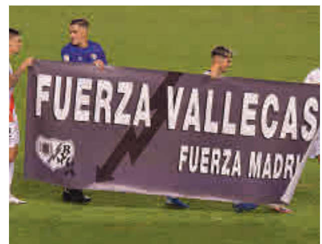
Los jugadores del Rayo saltaron con una pancarta

unidades. Los alfareros, que la semana pasada se imponían al Tenerife (2-0), viajan al campo del Málaga, mientras que el Fuenlabrada regresa al Fernando Torres (sábado, 20:30 horas) para recibir al Albacete después de su empate en Las Palmas (3-3). Por su parte, el Leganés también jugará como local (domingo, 20:30) ante el Cartagena.