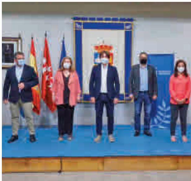
Los alcaldes del Sur se reunieron en Fuenlabrada

Justo antes de que se conocieran las medidas del Gobierno regional, los alcaldes socialistas de Fuenlabrada, Getafe, Alcorcón, Móstoles, Leganés, Parla y Pinto se reunieron en el Ayuntamiento fuenlabreño para pedir a la presidenta de la Comunidad, Isabel Díaz Ayuso, "coordinación" para