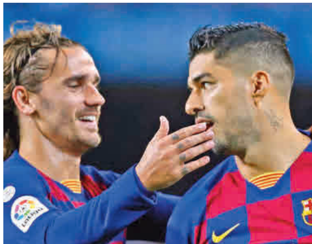
Antoine Griezmann y Luis Suárez, pasado y presente de la delantera del Atlético de Madrid

algo mermada tras la salida de Morata con destino a la Juventus. Por último, el propio Suárez continúa en una Liga competitiva y formando parte de un equipo que también disputa la Champions League. Parece que hay motivos de sobra para que la afición