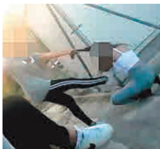
Captura de la agresión acontecida en Jaén

EL PERIÓDICO GENTE NO SE RESPONSABILIZA NI SE IDENTIFICA CON LAS OPINIONES QUE SUS LECTORES Y COLABORADORES EXPONGAN EN SUS CARTAS Y ARTÍCULOS