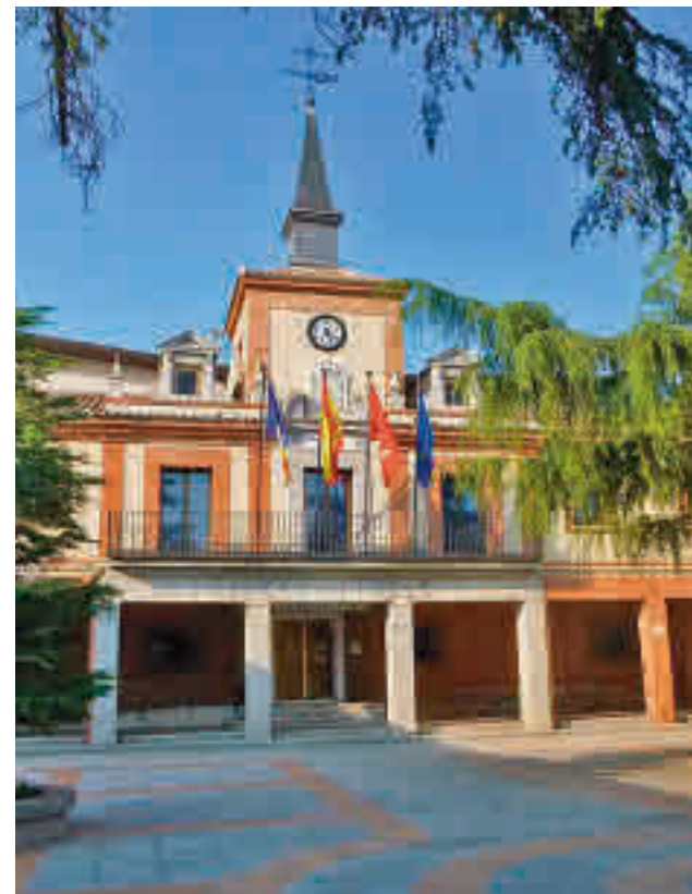
Ayuntamiento de Las Rozas