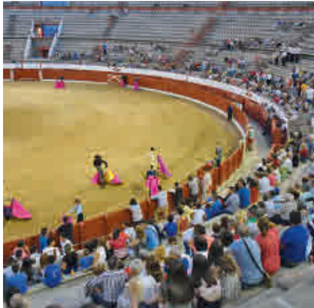
Imagen de anteriores ediciones

Esta semana el Ayuntamiento de esta localidad del Norte de la Comunidad de Madrid se veía obligado a anunciar la cancelación 'sine