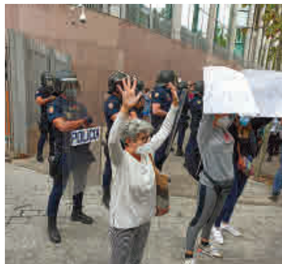
Protesta en la Asamblea de Madrid

Sobre esta posibilidad se manifestó Zapatero, apuntando que el objetivo del Gobierno regional es "evitar el confinamiento". Algo en lo que coincidió la presidenta, Isabel Díaz Ayuso, que señaló en una entrevista que hará "lo que sea" para acabar con el virus, pero que el estado de alarma sería "la muerte para Madrid".