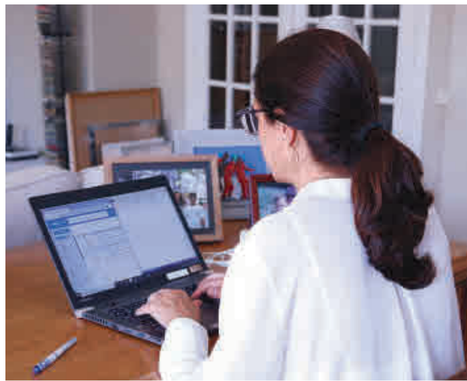
El teletrabajo se ha extendido durante la pandemia

La titular de Trabajo indicó que esta norma "inaugura una ola de reformas del Ministerio encaminadas al siglo