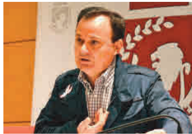
El alcalde de Coslada quiere una reunión con Ayuso

El propósito principal es evitar, en la medida de lo posible, el cese definitivo de actividad. Para ello, la Administración municipal pone a disposición de su tejido empresarial, de manera totalmente gratuita, un equipo multidisciplinar de consultores del