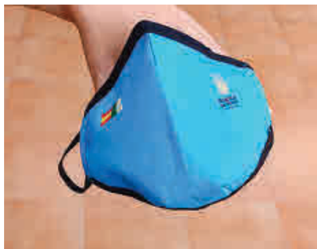
Mascarillas del Ayuntamiento de Boadilla

Se trata de mascarillas textiles reutilizables de tres tallas diferentes para cubrir todos los tramos de edad, a partir de los seis años. Al no ser obligatorio su uso antes de esa edad, las escuelas infantiles recibirán mascarillas únicamente para los profesores y el personal del centro. El objetivo es minimizar los riesgos de contagio en el entorno escolar de la ciudad.