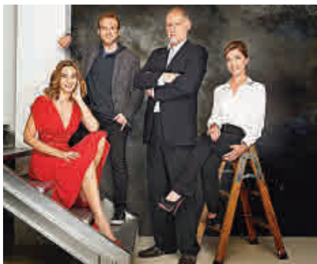
Reparto de la obra 'Trigo sucio'

El Ayuntamiento se compromete a financiar ese tramo de carretera.