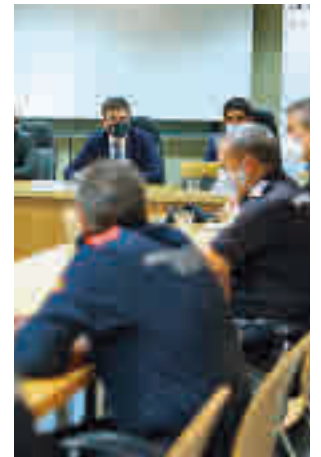
Reunión de los alcaldes

GENTE Después del paréntesis veraniego, la Comunidad de Madrid ya mira de frente a la segunda ola de la Covid-19. Las cifras de contagios llevaron al Gobierno regional a anunciar restricciones de movilidad a diferentes distritos de la capital, así como a diversos puntos de algunas localidades. Ante esta situación, las corporaciones municipales de Alcobendas y San Sebastián de los Reyes se han puesto manos a la obra para evitar que la situación empeore y con el objetivo claro de que se recupere la normalidad lo antes posible. Esa fue la hoja de ruta que presidió la reunión celebrada el pasado martes en dependencias municipales