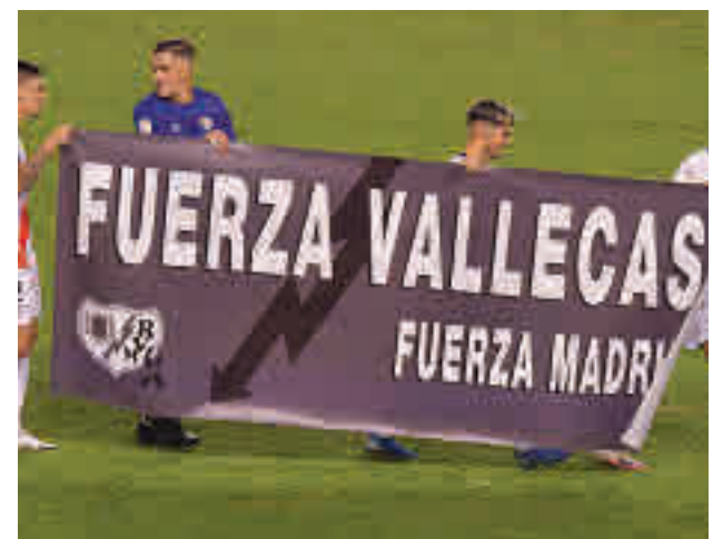
Los jugadores del Rayo saltaron con una pancarta

unidades. Los alfareros, que la semana pasada se imponían al Tenerife (2-0), viajan al campo del Málaga, mientras que el Fuenlabrada regresa al Fernando Torres (sábado, 20:30 horas) para recibir al Albacete después de su empate en Las Palmas (3-3). Por su parte, el Leganés también jugará como local (domingo, 20:30) ante el Cartagena.