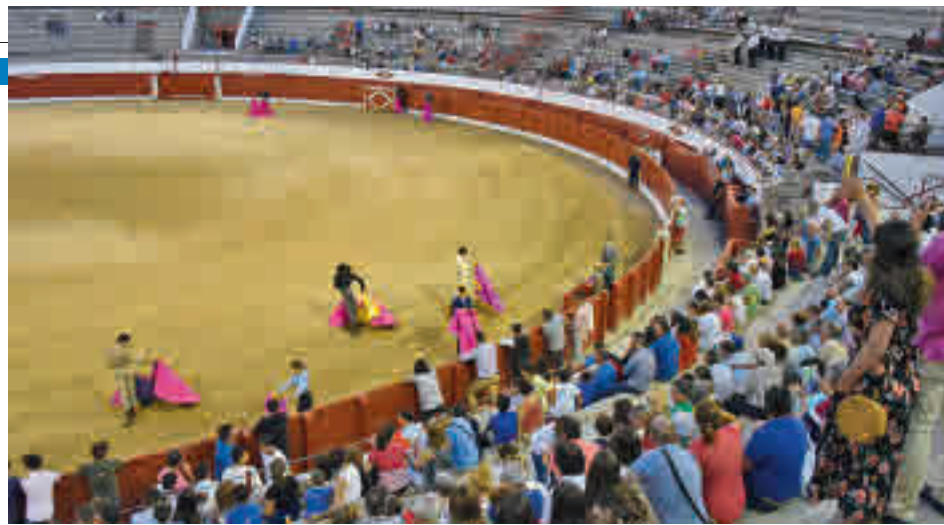
Imagen de anteriores ediciones

Los organizadores ya se habían visto obligados a cambiar las fechas ● Estaba prevista para este fin de semana, pero la situación ha llevado a su cancelación