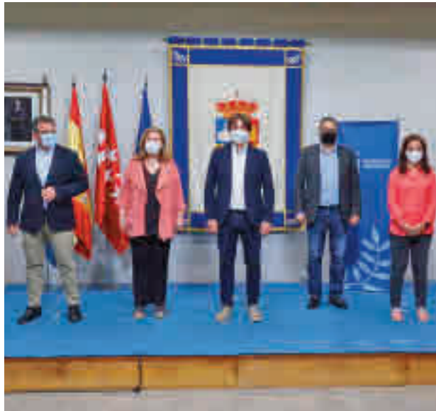
Los alcaldes del Sur se reunieron en Fuenlabrada

Justo antes de que se conocieran las medidas del Gobierno regional, los alcaldes socialistas de Fuenlabrada, Getafe, Alcorcón, Móstoles, Leganés, Parla y Pinto se reunieron en el Ayuntamiento fuenlabreño para pedir a la presidenta de la Comunidad, Isabel Díaz Ayuso, "coordinación" para