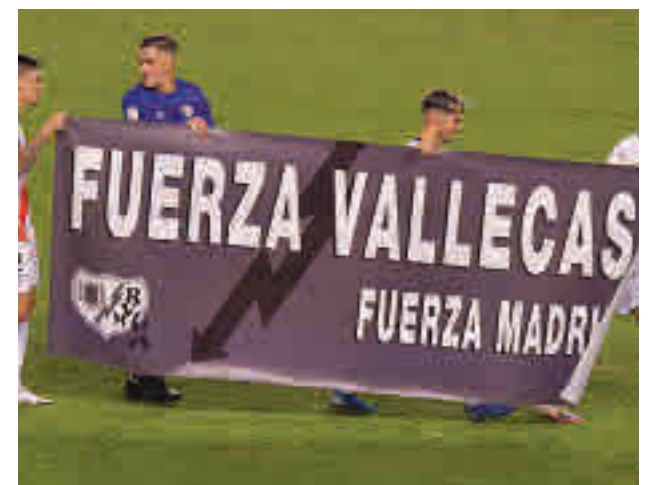
Los jugadores del Rayo saltaron con una pancarta

unidades. Los alfareros, que la semana pasada se imponían al Tenerife (2-0), viajan al campo del Málaga, mientras que el Fuenlabrada regresa al Fernando Torres (sábado, 20:30 horas) para recibir al Albacete después de su empate en Las Palmas (3-3). Por su parte, el Leganés también jugará como local (domingo, 20:30) ante el Cartagena.