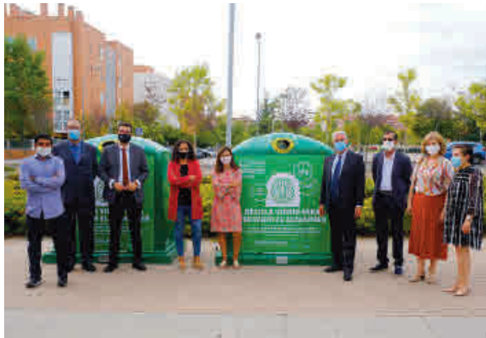
Imagen del acto de presentación