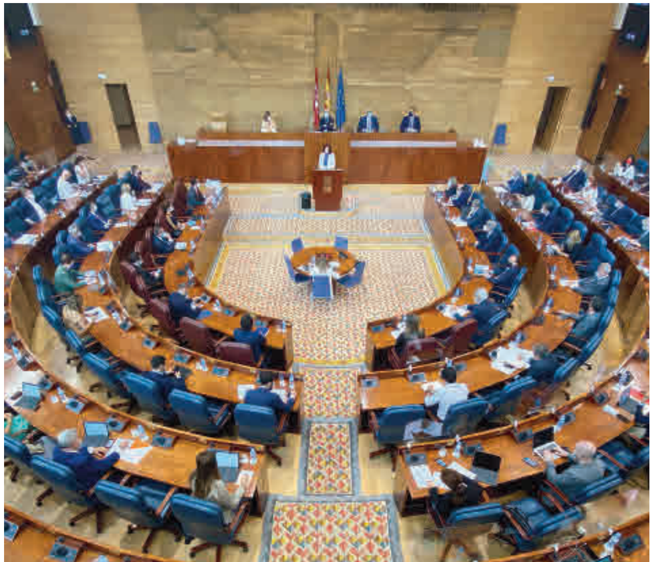
Isabel Díaz Ayuso interviene en el Debate sobre el Estado de la Región

Ayuso señaló que 248 pisos del Parque de Vivienda Social ya se están ejecutando,