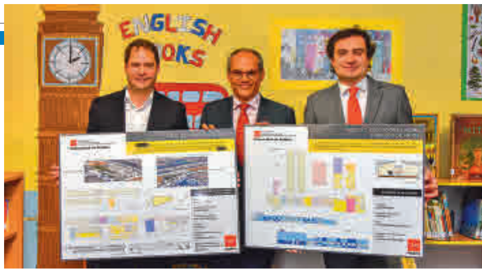
Presentación del proyecto en marzo de 2019

La Comunidad le ha asignado un presupuesto de 4,8 millones ● Entrará en funcionamiento el próximo curso escolar