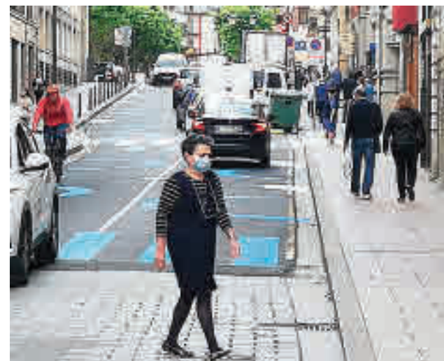
Varios distritos y municipios podrían verse afectados