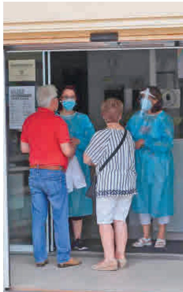
Los centros de salud de la zona están saturados

"A mí se me ponen los pelos de punta, porque es nuestra primera línea de choque, los sanitarios y los centros