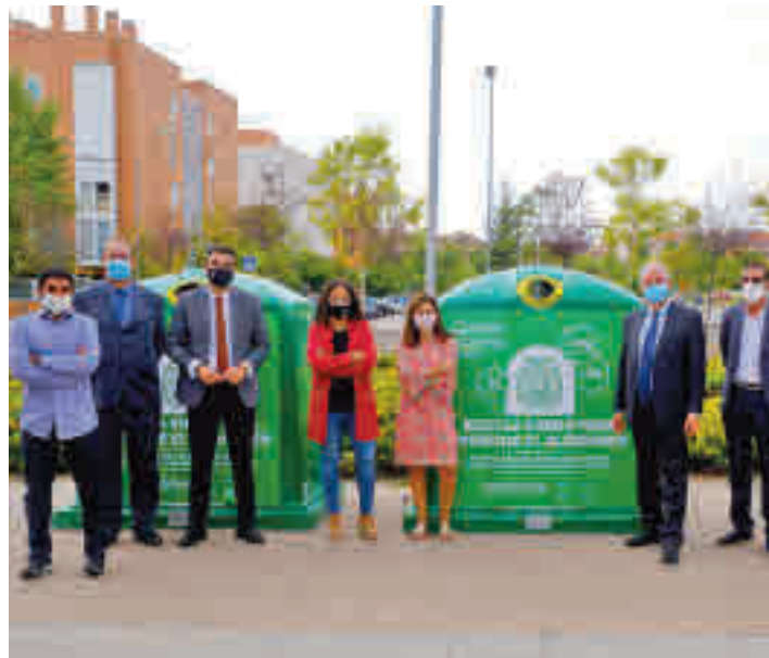
Imagen del acto de presentación

29 de septiembre. En Sanse los contenedores están ubicados en la calle Real con Plaza de la Constitución y en la avenida de la Plaza de Toros con calle Real, mientras que en Alcobendas se han colocado en las calles Codo con Soria, y en Dolores Ibarruri con Teresa de Calcuta.