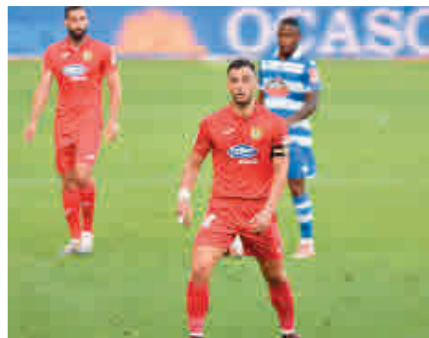
El Depor-Fuenla sigue coleando, casi un mes después