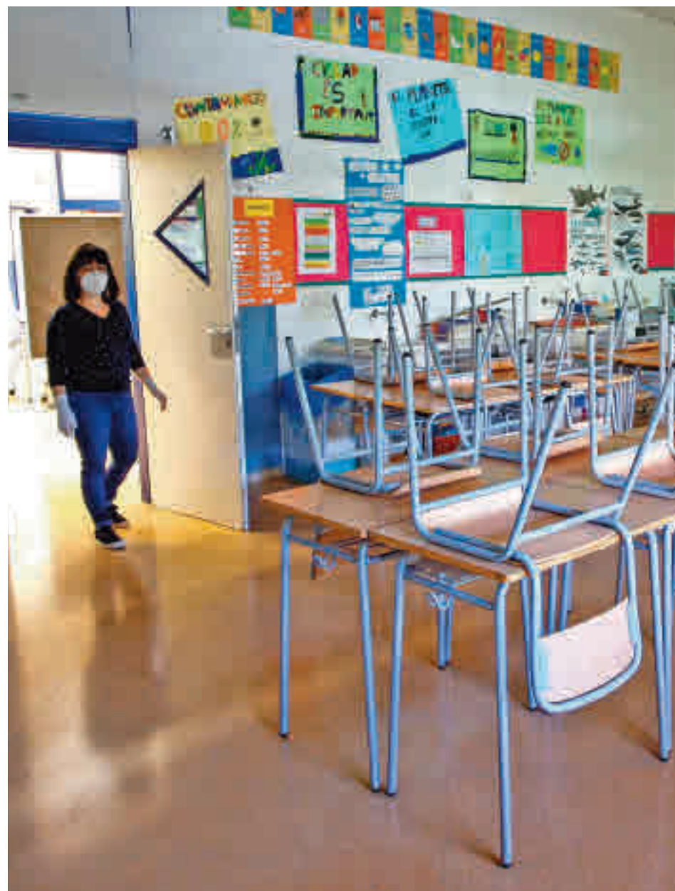
Los alumnos madrileños vuelven al cole entre dudas

La Comunidad facilitará que los centros que aún no la tienen puedan aplicar este curso de manera excepcional la jornada continua y posibilita-