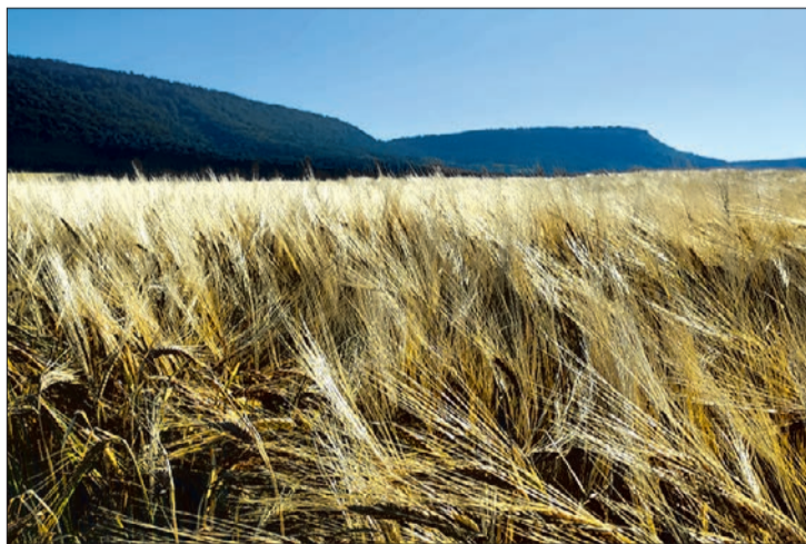
Campo de cereal en la provincia de Burgos.

En comparación con 2019, se han producido 489.423 toneladas más (+33%), a pesar de que se ha cosechado sobre una superficie de -3.839 ha menos. El rendimiento medio ha aumentado considerablemente, pasando de los 3.826 kg/ha de 2019 a los 5.158 kg/ha del presente año. Del total