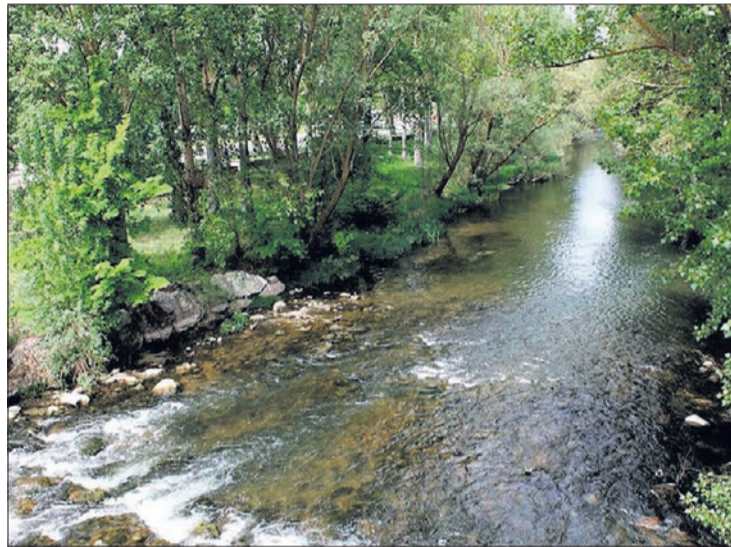
Los ecosistemas acuáticos se han visto fuertemente alterados en los últimos años.