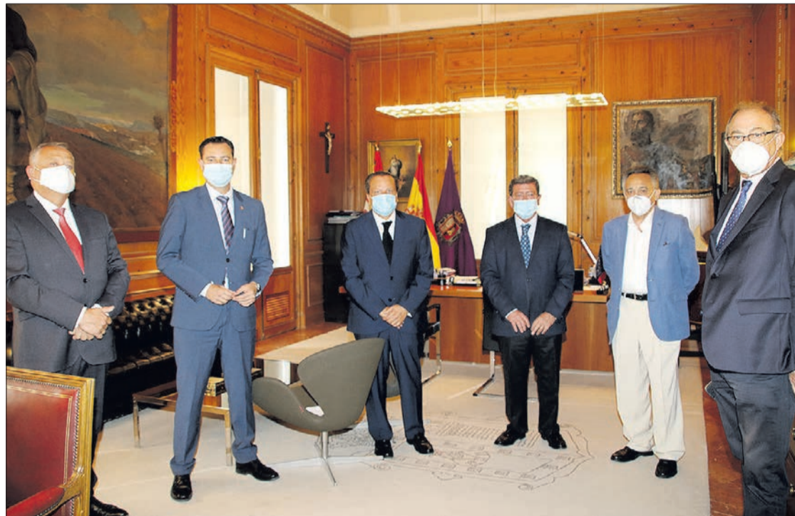
El Pleno del Consejo de Cuentas de Castilla y León se celebró en la Diputación de Burgos, el miércoles 15.

Asimismo, explicó que rindieron la cuenta un total de 433 entidades locales menores en Burgos, lo que representa un 67 % del total, con una bajada interanual de 4 puntos porcentuales. En conjunto, el presupuesto agregado de ingresos de las entidades locales de la provincia ascendió