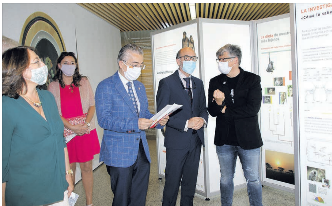
Autoridades, en el espacio dedicado a la exposición 'La Dieta. Pasado. Presente y Futuro'.

ESPACIO DINÁMICO "El MEH no se ha limitado a esa función expositiva, sino que ha ido al encuentro de la ciudadanía ofreciendo una rica y variada programación"