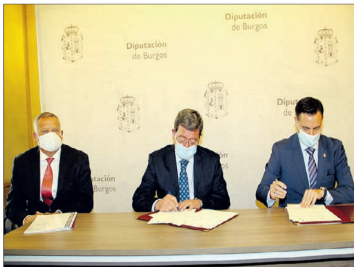
Firma del convenio entre el Ayuntamiento y la Diputación el día 15.

Por otra, la segunda novedad es la creación de la oficina 'Film Commission', que trabajará en la promoción de los espacios geográficos de ciudad y provincia susceptibles de ser escenario de rodajes de películas y series nacionales e internacionales. "Nuestro entorno -dijo- es espectacular para poder proporcionar