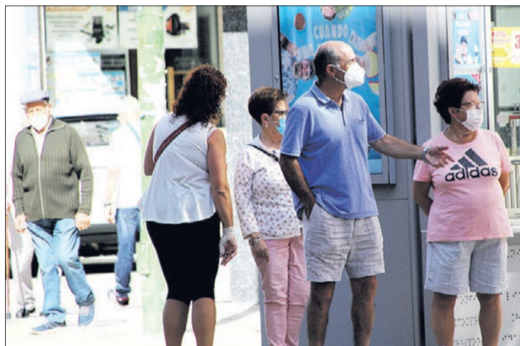
La mascarilla debe cubrir desde parte del tabique nasal hasta la barbilla incluida.

Además, se acuerda la obligación de aislamiento o cuarentena de personas con sintomatología compatible con infección por SARS-CoV-2, la prohibición del