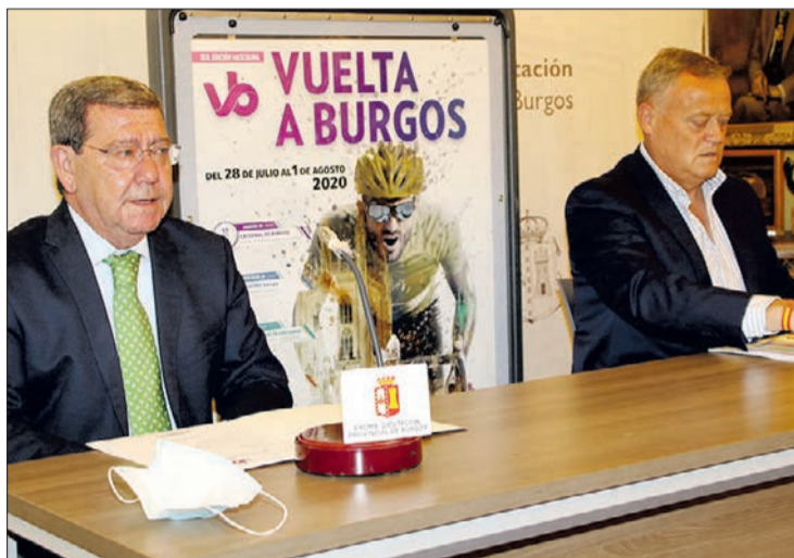
Presentación de la Vuelta a Burgos, el jueves 16.

Se ha trabajado en un "protocolo general" de sanidad y en 17 anexos que afectan a todos los colectivos que participan en esta competición deportiva, como voluntarios, agentes de la Guardia Civil, organización, ciclistas, etc. Todos ellos, insistió Rico, cuentan con unas medidas específicas para que la seguridad prime en todo momento. En este sentido, aprovechó para apelar a la responsabilidad individual del público que acuda a ver la prueba. En total, son 1.400 personas las que participan en la organi-