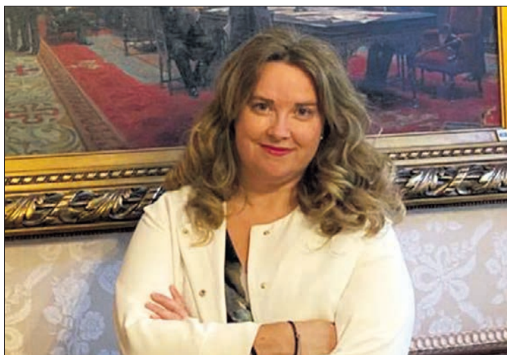
Cristina Ayala es senadora del PP por Burgos y Secretaria Cuarta de la Mesa del Senado.

Su objetivo es preservar y difundir los valores democráticos y éticos que encarnan las víctimas del terrorismo, construir la memoria colectiva de las víctimas y concienciar al conjunto de la población para la defensa de la libertad y de los derechos humanos y contra el terrorismo. El Centro Nacional