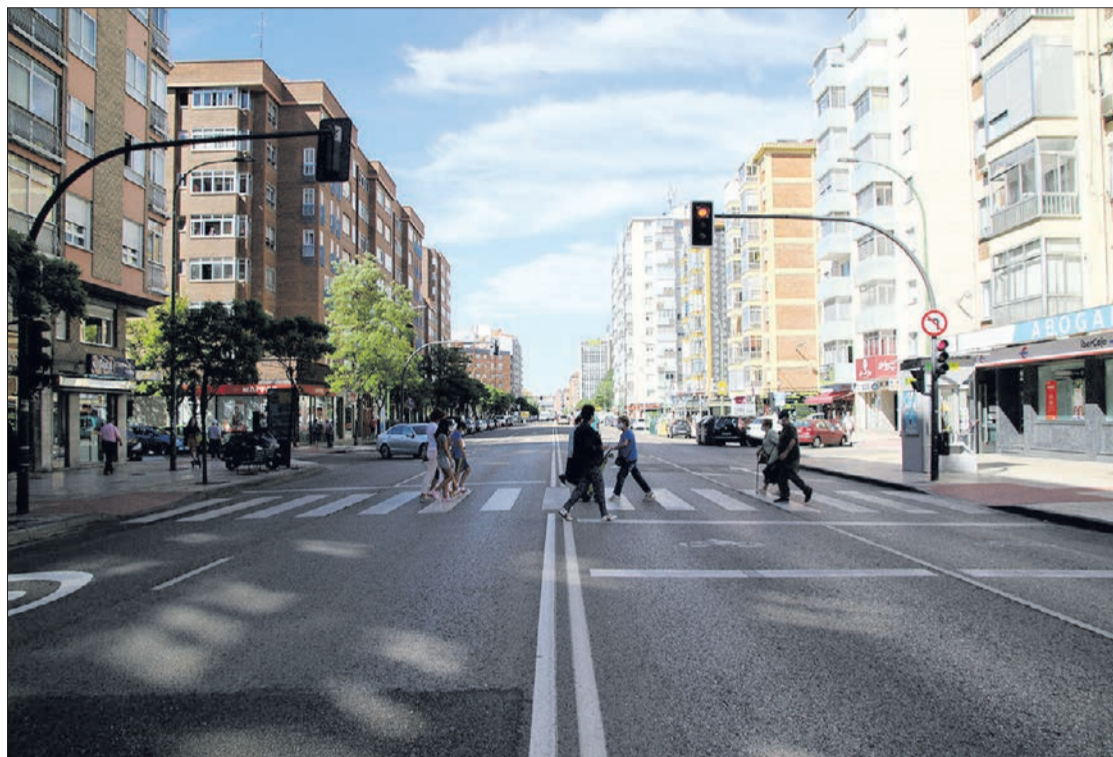
Imagen de la calle Vitoria actualmente, que pasará a ser una avenida comercial.

La segunda alternativa marca un sentido unidireccional