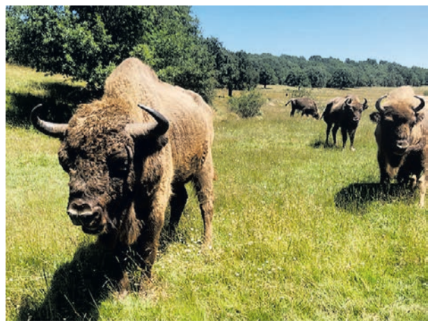
Bisonte, una especie en peligro de extinción.