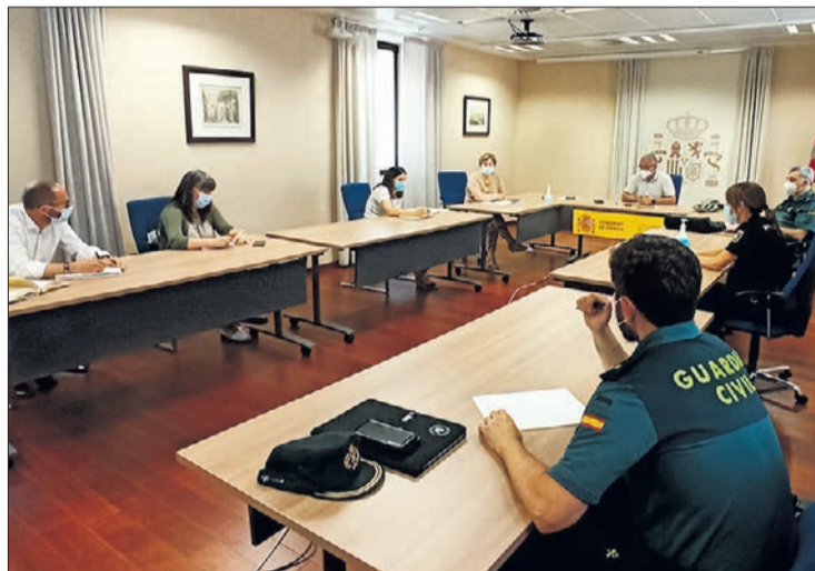
Reunión del grupo de trabajo de agentes de la Administración del Estado en la Mesa de Trata de Seres Humanos.

El subdelegado del Gobierno, Pedro Luis de la Fuente, manifestó que “mujeres, extranjeras, y prostitutas son las tres variables sobre las que en la mayor parte de los casos gira la trata de seres humanos”. Una realidad, afirmó, “que rompe nuestra construcción emocional e intelectual del mundo que queremos. No puedo creer en el mundo en que vivo si esta excrecencia de nuestra sociedad no es erradicada. Forma