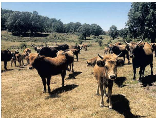
Uro, precedente de las distintas razas de ganado doméstico.