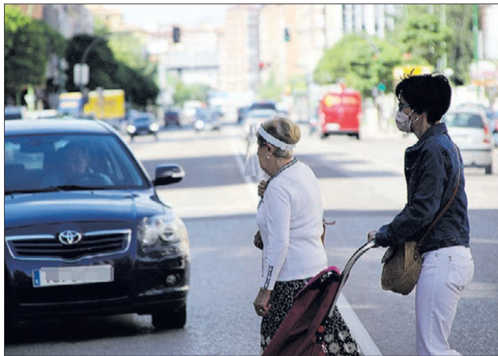
A partir de las 0.00h. del día 18 será obligatorio el uso de mascarilla en CyL con carácter general.

Las nuevas modificaciones al Plan de medidas de prevención y control para hacer frente a la crisis sanitaria ocasionada por la COVID-19 en la Comunidad de Castilla y León, aprobado el pasado 19 de junio, vienen justificadas, según expusieron ambos consejeros, por el incremento actual de la movilidad de personas en época estival, la aparición de determinados brotes epidemio-