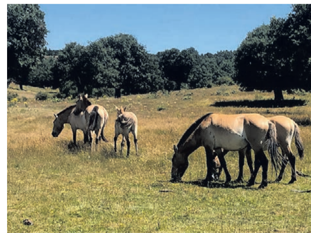
Caballo Przewalski, especie que casi se extinguió a mediados del siglo XX.