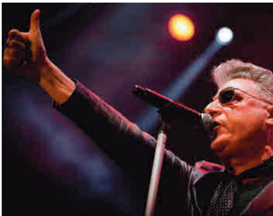
Loquillo será el encargado de cerrar Las Lunas del Egaleo 2020

Septiembre empezará con el concierto del cantautor Ismael Serrano (jueves 3), al que seguirá el de Chica Sobresalto (viernes 4, 18 euros), nombre artístico de la con-