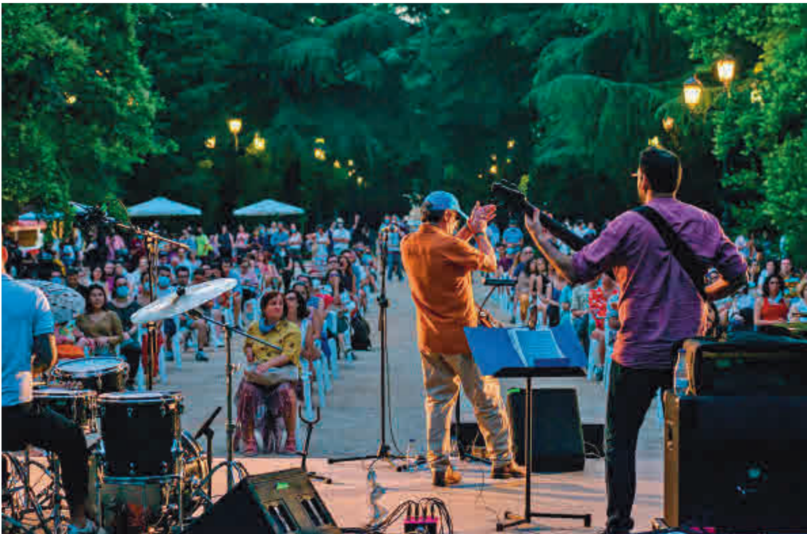
Lleno en todos los conciertos celebrados hasta la fecha