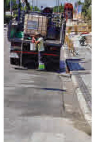
Los trabajos, en marcha

Fruto de estas conversaciones, el Consistorio roceño planificó una serie de me-