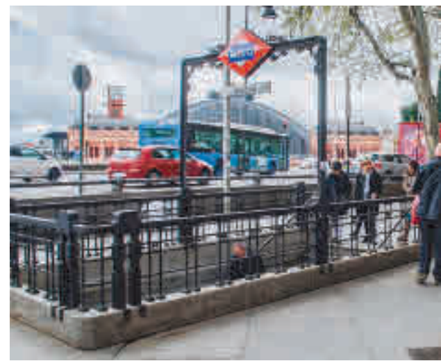
La Línea 11 de Metro pasará por Atocha

Una dermatóloga confirma sus efectos adversos y recomienda hidratar , una doble limpieza, tonificar y protección solar para combatirlos