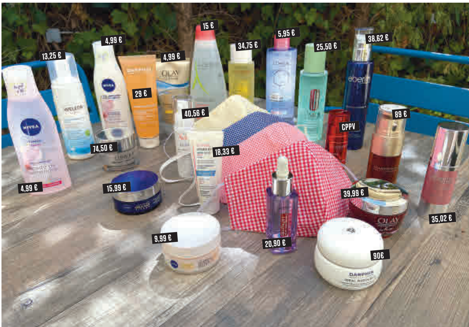
Una selección de productos de las mejores marcas AGRADecIMIENTOS: RESTAURANTE EL JARDÍN DE ALMA