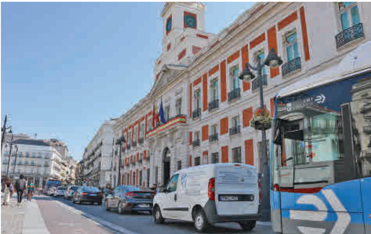
Los coches dejarán de pasar por la Puerta del Sol en poco más de un mes