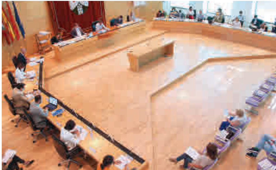
Pleno del Ayuntamiento de Alcobendas

El documento prevé que se destinen más de 1,5 millones de euros a la moderniza-