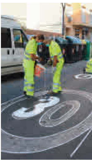
Calle de Getafe