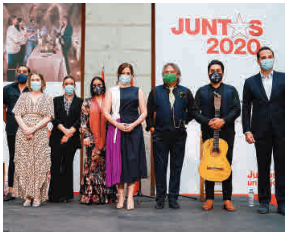
Presentación del Plan Juntos 2020

La Comunidad de Madrid pone en marcha el Plan Juntos 2020 para superar la crisis provocada por el coronavirus • Habrá 570 espectáculos de teatro, cine, flamenco, ópera o circo