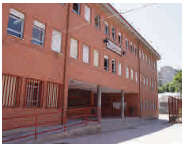
Colegio de Fuenlabrada

El Ayuntamiento de Fuenlabrada tiene un presupuesto de 1,2 millones de euros para estas ayudas a la compra de material escolar.