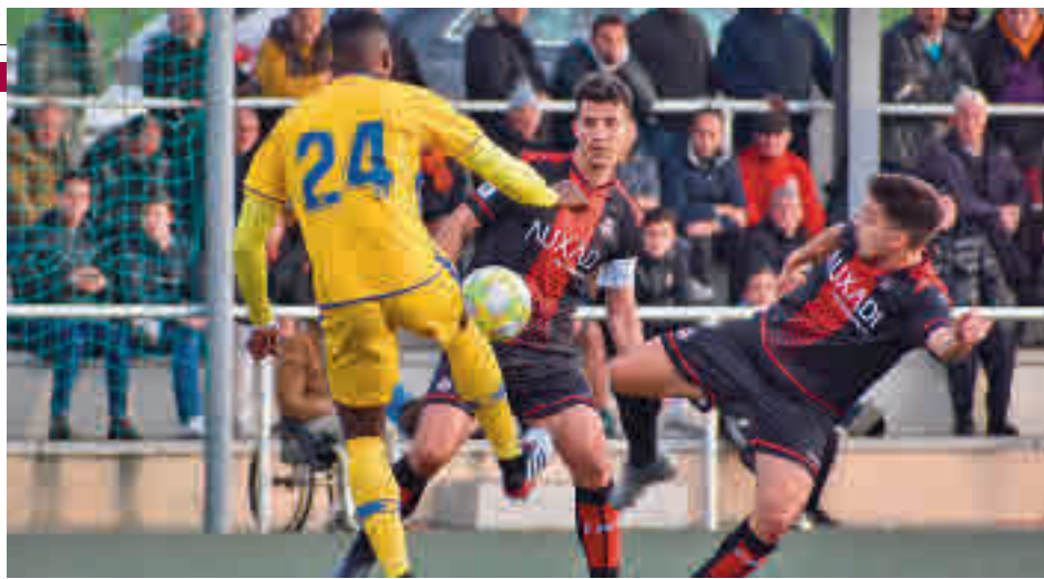
Unión Adarve y Alcorcón B jugarán este domingo

Al igual que el Navalcarnero, el Unión Adarve también tratará de regresar un año después a la Segunda División B. Para ello tendrá que superar, en primer lugar, a un