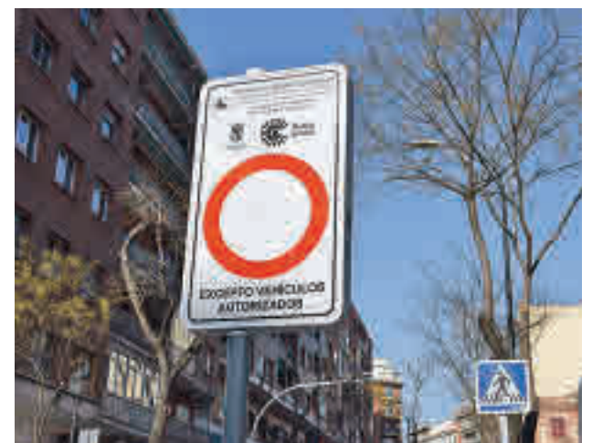
Restricciones de paso por Madrid Central

Se trata de la tercera línea de EMT, junto a las dos líneas Cero gratuitas que ya están en marcha, que se incluyen en la estrategia de sostenibilidad ambiental 'Madrid 360'. Martínez-Almeida señaló que este tercer recorrido "paliará las necesidades" de movilidad que se dan en la zona desde la implantación de Madrid Central.