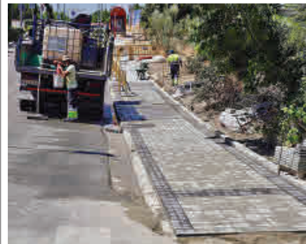
Los trabajos se realizarán durante julio y agosto

Por su parte, el IES Carmen Conde también verá reordenado los aparcamientos de su área más cercana, con el objetivo de lograr una entrada y salida de alumnos más segura gracias a la creación de plazas de estacionamiento en el lateral de la avenida de Atenas.