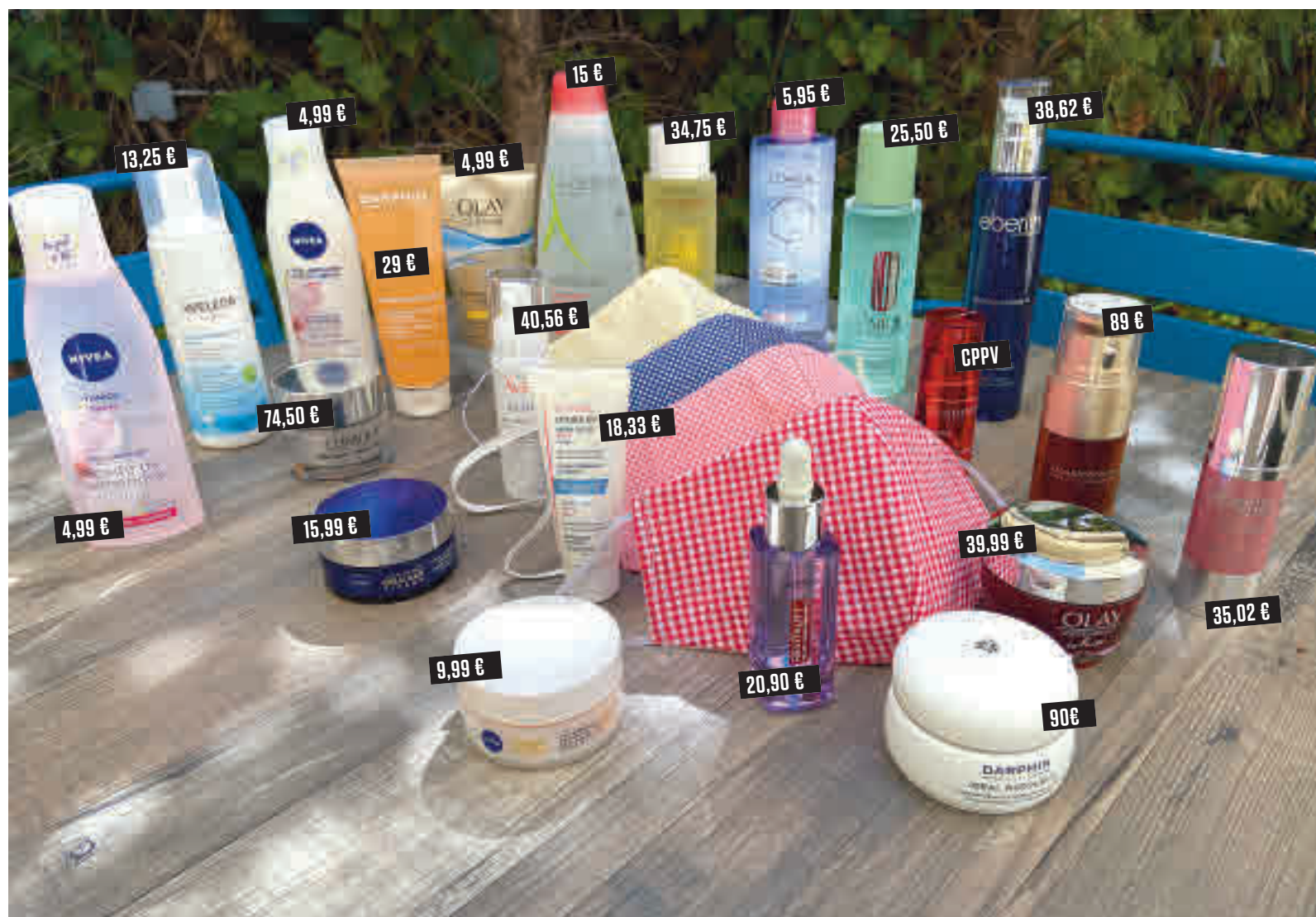
Una selección de productos de las mejores marcas AGRACIEMENTOS: RESTAURANTE EL JARDÍN DE ALMA