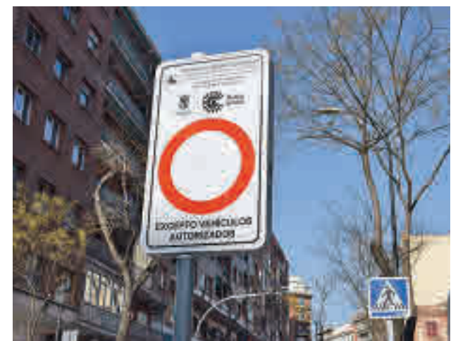
Restricciones de paso por Madrid Central

Se trata de la tercera línea de EMT, junto a las dos líneas Cero gratuitas que ya están en marcha, que se incluyen en la estrategia de sostenibilidad ambiental ‘Madrid 360’. Martínez-Almeida señaló que este tercer recorrido “paliará las necesidades” de movilidad que se dan en la zona desde la implantación de Madrid Central.