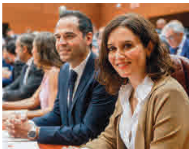
Isabel Díaz Ayuso e Ignacio Aguado

"Se cumple un año desde que PP y Ciudadanos acordamos seguir construyendo un Madrid más libre, abierto e integrador", señaló Ayuso, mientras que Aguado se refirió a "un acuerdo con 155 medidas para convertir Madrid en la región más próspera de Europa".