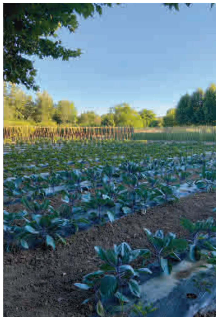
Un total de 15 hectáreas de huerta en el municipio de Carabaña

Situada a poco más de 40 kilómetros del centro de Madrid, en el municipio de Carabaña, se convierte en un paraíso para los ciudadanos de la capital y del resto de la Comunidad que quieren alejarse por unas horas del ruido y volver a los tiempos en los que un tomate sabía a tomate. Y es que el protagonista indiscutible de la huerta, que cuenta con 15 hectáreas, es este producto, del que tie-