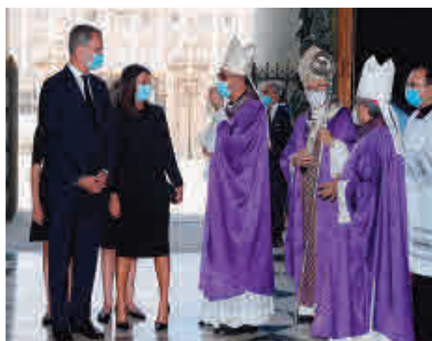
Misa en homenaje a las víctimas de la pandemia

La ausencia más comentada fue la del presidente del Gobierno, Pedro Sánchez • Alrededor de 400 personas estuvieron en La Almudena