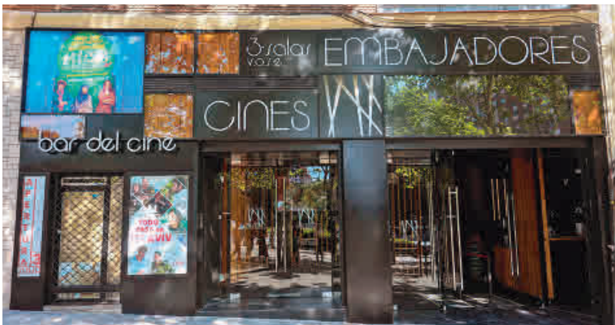
Imagen de la fachada de los Cines Embajadores

En primer lugar, su apertura estaba fijada para el mes de marzo, pero la pandemia del coronavirus y la posterior declaración del estado de alarma obligaron a aplazar este plan. La nueva fecha marcada en rojo era el viernes 3 de julio, pero como si de una maldición se tratara, un incendio en un edificio colindante volvió a trastocar los planes.