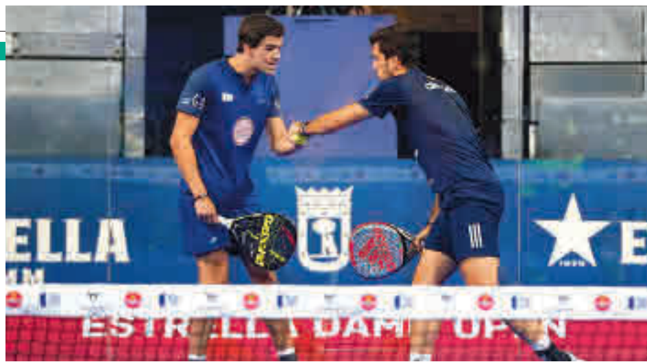
Juan Lebrón y Alejandro Galán ganaron el Estrella Damm Open 2020 WORLD PADEL TOUR

las sesiones. El espectáculo que brinda el pádel sigue ganando adeptos, pero con el contexto actual no queda más remedio que seguirlo desde la distancia, bien sea a través de canales de televisión (GOL) o plataformas en 'streaming'. Buena muestra de esta fiebre es que la reciente edición del Estrella Damm Open batió el récord histórico de audien-