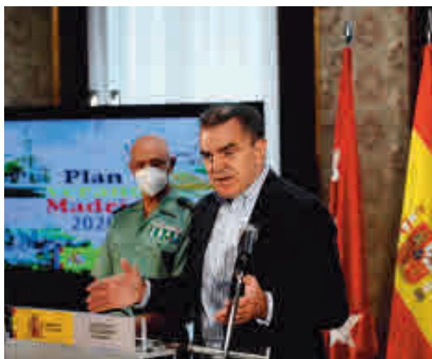
Presentación del Plan Verano 2020

Por lo que respecta a las separaciones, las que han llegado con un acuerdo previo han sido 105, un 16% menos que un año antes, mientras que las 35 no acordadas con anterioridad representan un 27,1% menos que las presentadas en 2019.