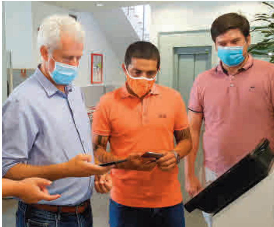
El alcalde y el vicecalde comprueban el funcionamiento del sistema

La nueva reubicación y el diseño del espacio físico de los puestos de Atención al Ciudadano, con una amplia y funcional sala de espera con pantallas informativas, supone también una mejora sustancial en la privacidad de las gestiones y proporciona en estos momentos las distancias de seguridad recomendadas para evitar la transmisión de la Covid-19.