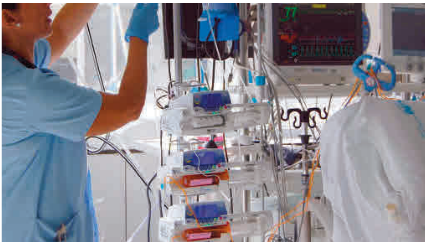
Las camas UCI son una herramienta fundamental contra el Covid-19