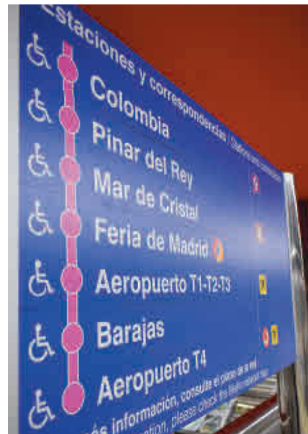
La Línea 8 de Metro llegará a Valdebebas

Según informaron fuentes del Gobierno regional, se trata de un área que va a crecer en los próximos años con la creación de infraestructuras "clave": el nuevo hospital público de Emergencias, la futura Ciudad de la Justicia, la ampliación de Ifema o la nueva terminal del aeropuerto que va a unificar las actuales terminales 1, 2 y 3. El proyecto en el que trabaja la Consejería de Transportes para llevar la Lí-