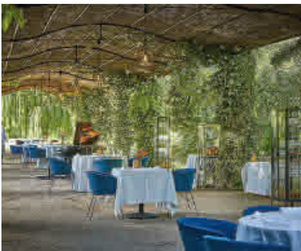
La espectacular terraza donde se sirven los almuerzos y cenas