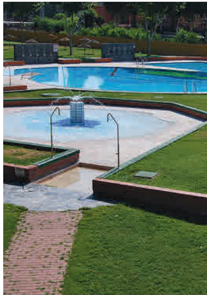
Instalaciones de El Juncal

ver ese pulso entre la actividad ciudadana y las medidas de seguridad impuestas sean las piscinas. Allí encuentran descanso y refresco muchos habitantes que no han podido escaparse a los destinos de playa y que tratan de combatir las altas temperaturas que ha traído aparejadas la llegada del mes de julio. Pero, ¿cómo acercarse hasta algu-