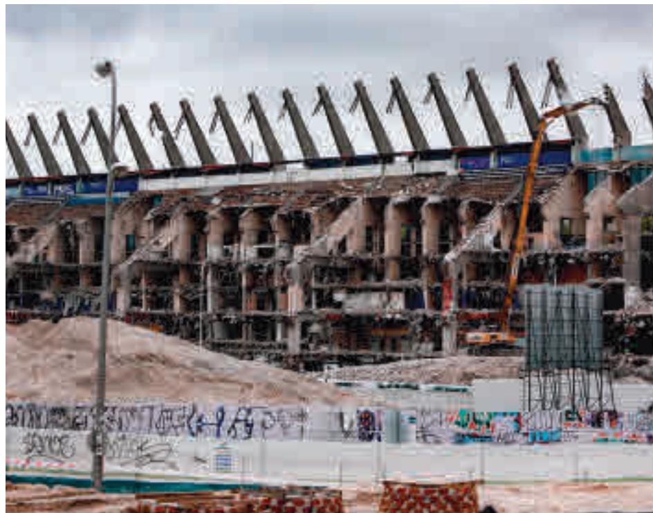
Obras de derribo del estadio Vicente Calderón