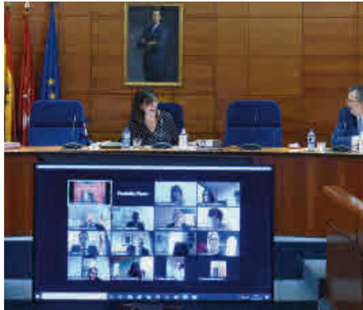
Debate del Estado del Municipio de Pozuelo

El primero de los siete pilares de este proyecto es contar con unos edificios municipales "que sean una referencia en cuanto a sus sostenibilidad". En segundo lugar estará el fomento y la ampliación de las zonas verdes, mientras que en tercero está la in-