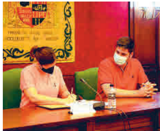
La alcaldesa firma el Pacto de Reconstrucción

También habrá bonificaciones para los autónomos de la ciudad.