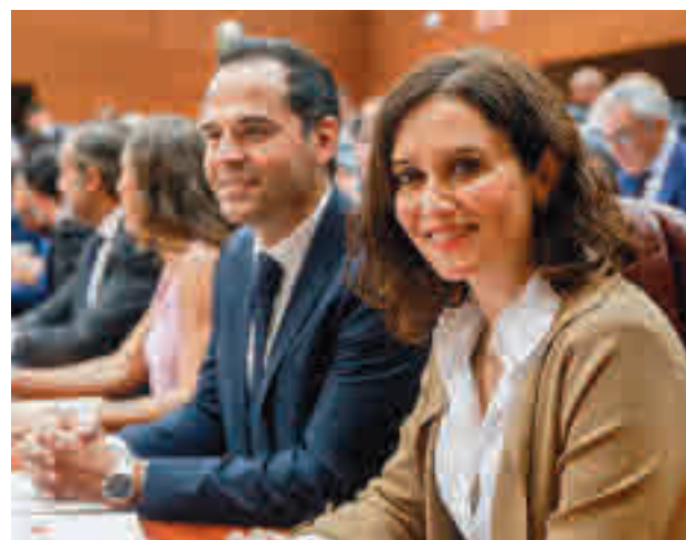
Isabel Díaz Ayuso e Ignacio Aguado

"Se cumple un año desde que PP y Ciudadanos acordamos seguir construyendo un Madrid más libre, abierto e integrador", señaló Ayuso, mientras que Aguado se refirió a "un acuerdo con 155 medidas para convertir Madrid en la región más próspera de Europa".