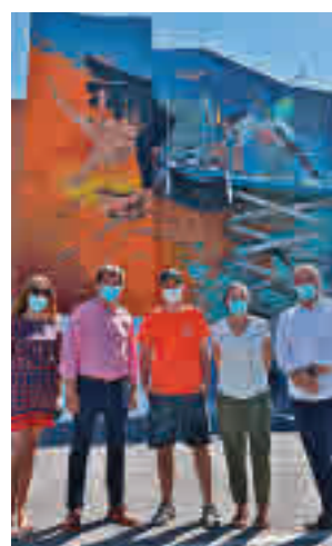
Mural del hospital

Se compone de 19 ilustraciones realizadas por el auxiliar de enfermería del área de Psiquiatría del hospital Víctor Rodríguez. La exposición es-