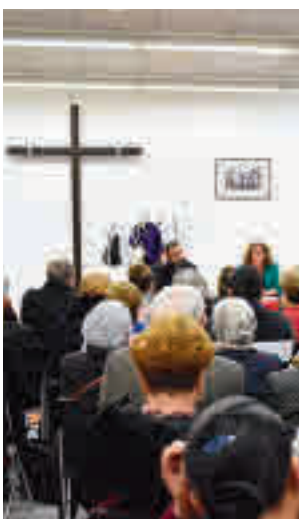
Hermandad en Alcorcón