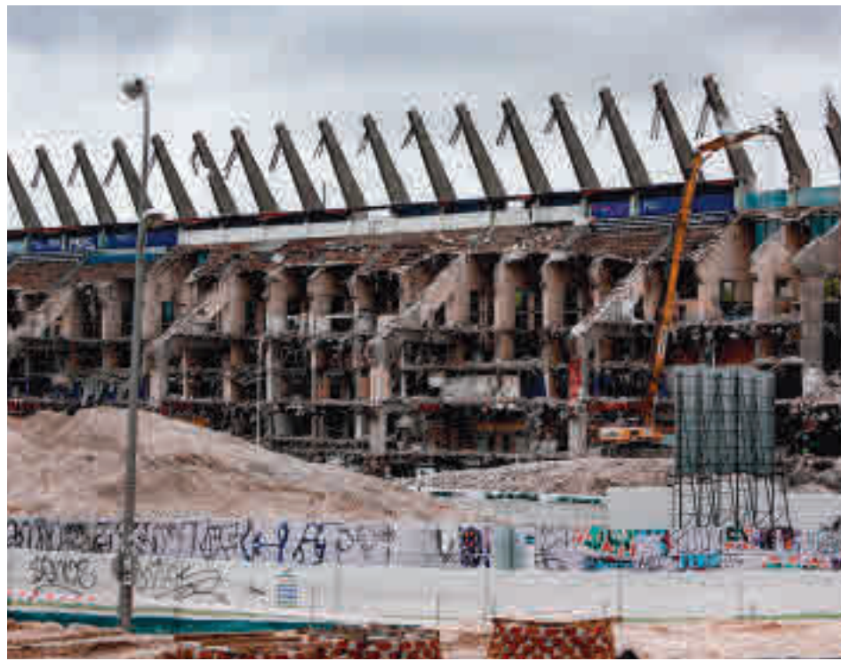
Obras de derribo del estadio Vicente Calderón