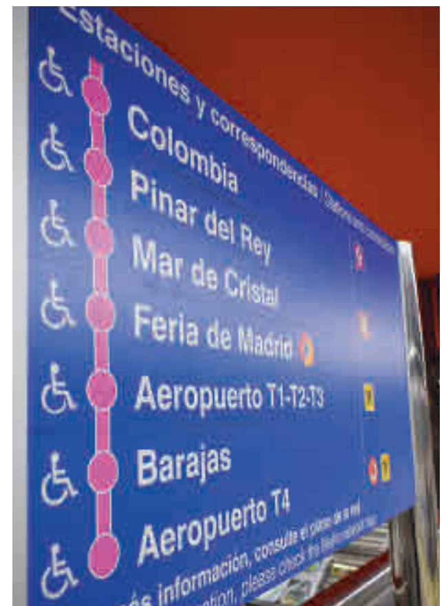
La Línea 8 de Metro llegará a Valdebebas

Según informaron fuentes del Gobierno regional, se trata de un área que va a crecer en los próximos años con la creación de infraestructuras "clave": el nuevo hospital público de Emergencias, la futura Ciudad de la Justicia, la ampliación de Ifema o la nueva terminal del aeropuerto que va a unificar las actuales terminales 1, 2 y 3. El proyecto en el que trabaja la Consejería de Transportes para llevar la Lí-