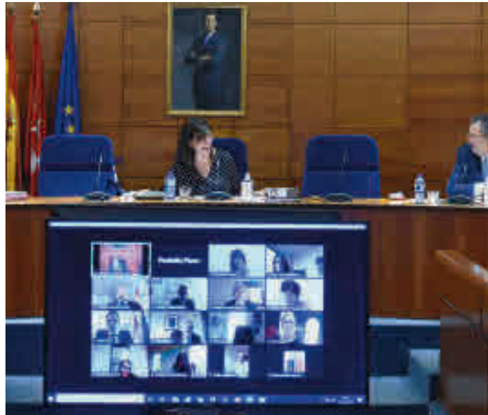
Debate del Estado del Municipio de Pozuelo

El nuevo departamento municipal se centrará en planificar el desarrollo sostenible de la ciudad • La eficiencia energética, las zonas verdes y los trámites 'online' son algunos de sus pilares