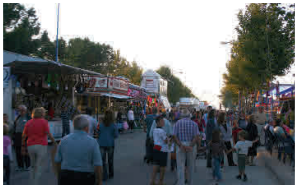
Pasada edición de las Fiestas de San Nicasio