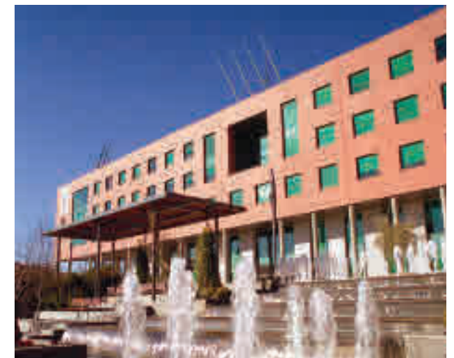
Ayuntamiento de Alcobendas

El Ayuntamiento de Alcobendas ha ampliado los espacios en los que se puede disfrutar de su red wifi abierta y gratuita. Tras su implantación en los edificios municipales, el Consistorio la ha extendido ahora a los siguientes emplazamientos: el campo de fútbol de Fuentelucha, el exterior del Espacio Miguel Delibes, los parques de Extremadura (en la zona cercana al Parque de Educación Vial) y Jardín de la Vega (Plaza del Invernadero, el área infantil Barco Pirata y Jardín Árabe) y las plazas Francisco Casillas, De la Artesanía, Del Pueblo y Mayor.