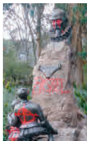
Cervantes en San Francisco

Bread, para ofrecer a la localidad madrileña como lugar que acoja a las estatuas de Miguel de Cervantes y Fray Junípero, que resultaron atacadas el pasado fin de semana en la ciudad norteamericana.