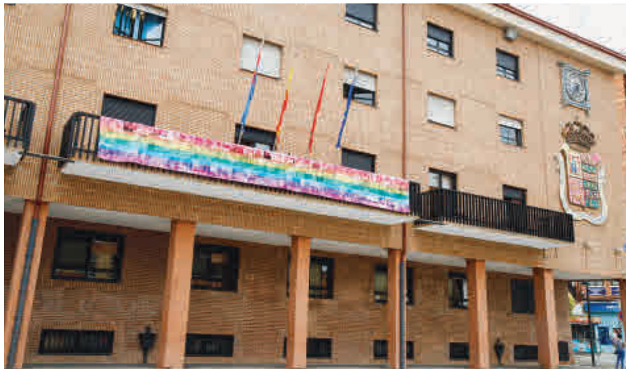
El Ayuntamiento de Móstoles desplegó una pancarta de apoyo al colectivo LGTBIQ+

“Esto coloca al municipio a la vanguardia de la lucha por la igualdad en derechos