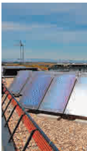
Edificios en Madrid