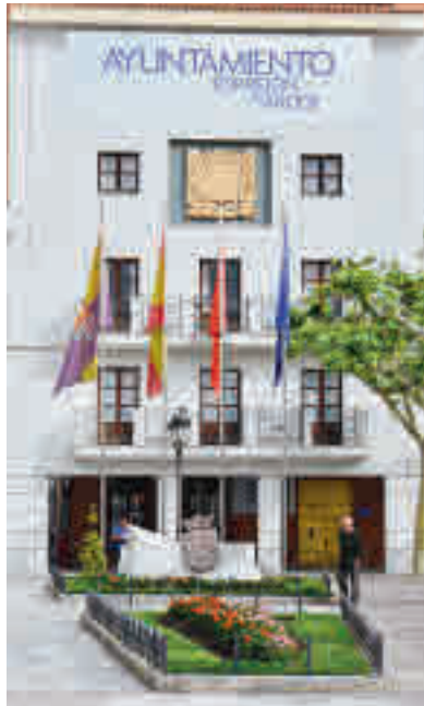
Ayuntamiento de Torrejón de Ardoz

En este sentido, Torrejón de Ardoz se ha convertido en una loable excepción. Las fuerzas representadas en el Consistorio de esta localidad