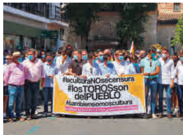
Un momento de la manifestación

gentedigital.es La información de los municipios del Este en nuestra web