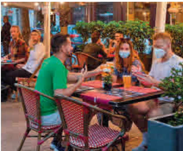
Terrazas en la Comunidad de Madrid