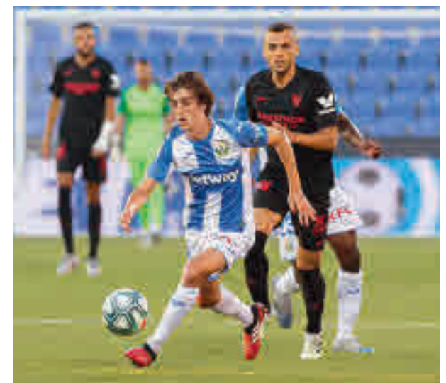
El Sevilla se llevó los tres puntos de Butarque

quema buena parte de las esperanzas pasan por ganar enfrentamientos directos como el que tendrá lugar este domingo 5 (17 horas) en Cornellá-El Prat. Allí se verán las caras el Espanyol, entrenado ahora por Rufete, y el CD Leganés, que hasta la fecha solo ha ganado uno de los 16 encuentros que ha disputado lejos de Butarque. Con los números en la mano, un empate sería insuficiente para las aspiraciones de ambos equipos, a los que no les queda otra opción que salir en busca del triunfo.