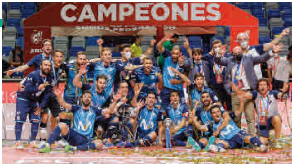
Movistar Inter cierra un ciclo con un nuevo trofeo en sus vitrinas

Sin público, sin margen para el error, con la salida de un pilar fundamental como Gadeia, sin el concurso de su máxima estrella, Ricardinho, y con varios jugadores, como Ortiz, Bebe, Marlon, Elissandro y Humberto ya comprometidos con otros equipos de cara a la próxima temporada, Movistar Inter se sobrepuso a todos los contratiempos para alzarse con el título tras dejar por el camino a un coreoso Jaén Paraíso Interior (3-1), a una de sus 'bestias