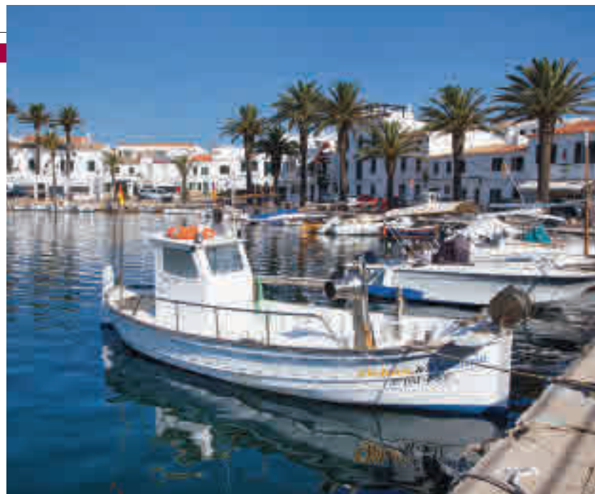
El puerto de Fornells, cuna de la caldereta de marisco