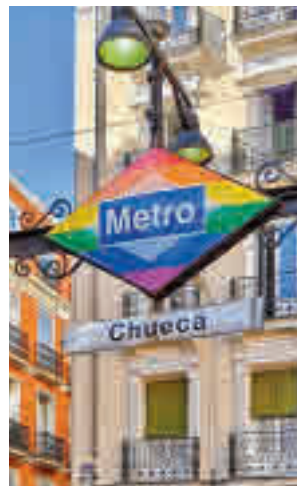
Logotipo de Metro en Chueca

En la presentación del nuevo logotipo estuvo el vicepresidente del Ejecutivo autonómico, Ignacio Aguado, que se congratuló de que el barrio de Chueca, el más icónico del movimiento LGBTi, sea receptor de esta acción durante la conmemoración del Orgullo, que sitúa a Metro de Madrid en la "vanguardia" de los valores del siglo XXI como el respeto a la diversidad.