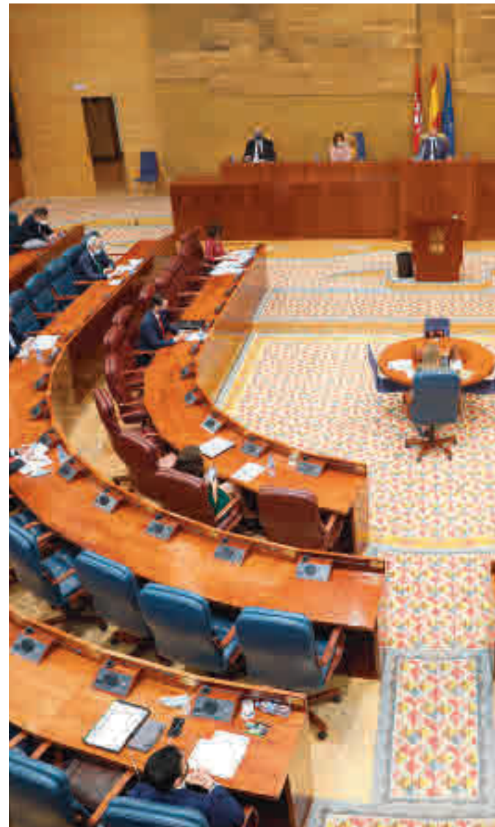
Asamblea de Madrid