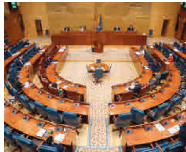
Asamblea de Madrid