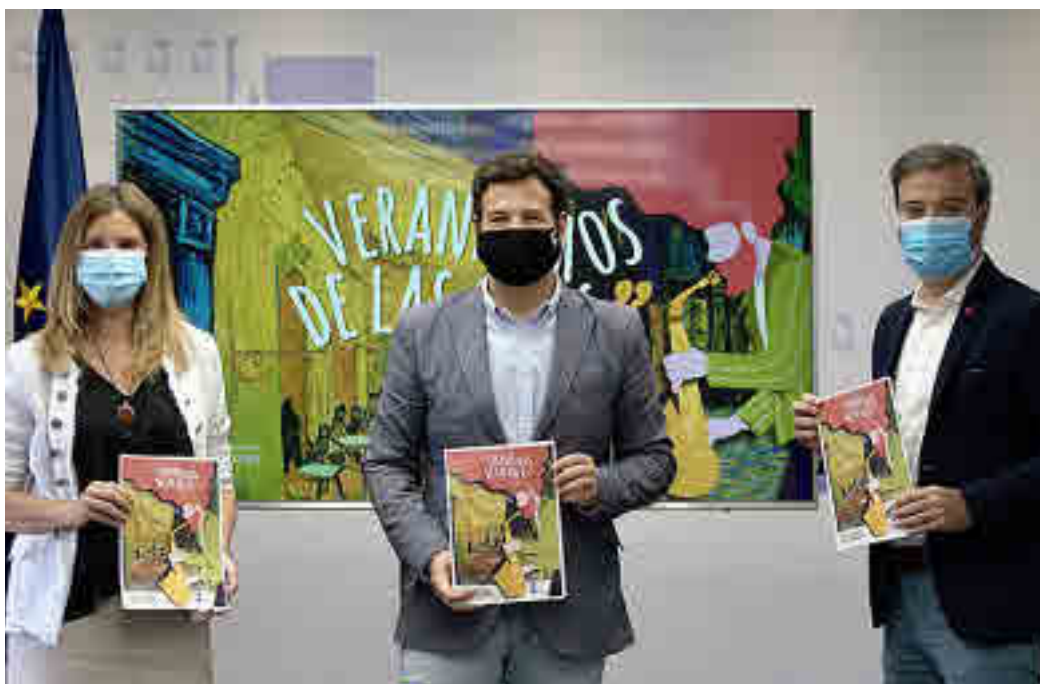
Presentación de los Veranísimos de Las Rozas