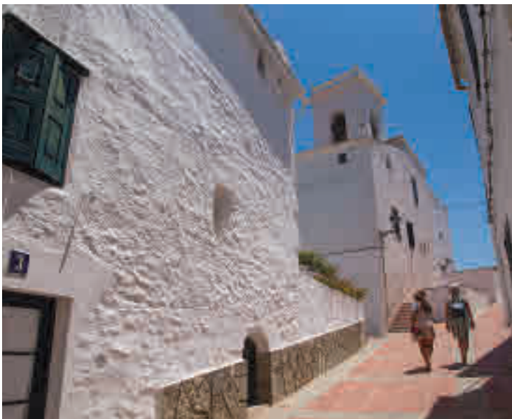
Para perderse, las calles de Es Mercadal