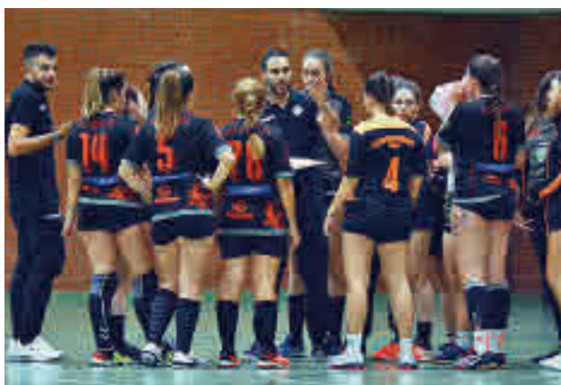
Imagen de la plantilla durante un encuentro FMBALONMANO