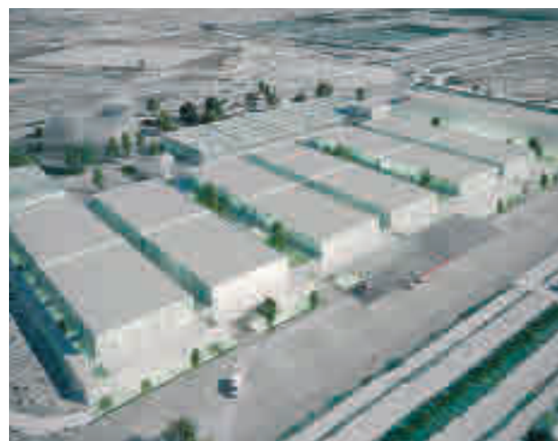
El hospital se levantará en la zona de Valdebebas

El proyecto ampliará los recursos asistenciales de la sanidad pública madrileña aportando hasta 1.000 nuevas camas y supondrá una inversión de alrededor de 50 millones de euros. Uno de sus objetivos será el de hacer frente a emergencias como la del Covid-19.