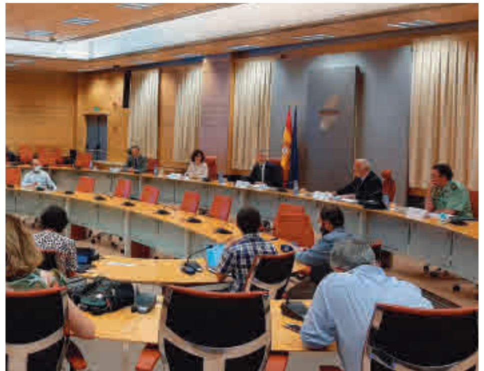
Presentación de la campaña de verano de la DGT

Durante estos dos meses funcionarán 764 radares fijos de control de velocidad (80 de ellos de tramo), 548 móviles, 12 helicópteros, 216 cámaras de control del cinturón de seguridad y del teléfono móvil, 11 drones (tres de ellos con capacidad de denuncia) y 15 furgonetas camufladas. También se realizarán tres campañas de vigilancia: una sobre velocidad, otra sobre motos y