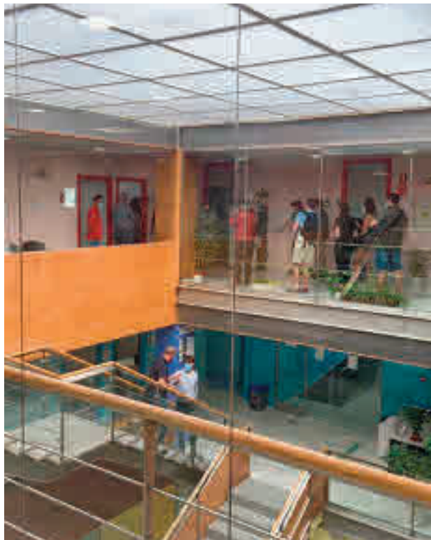
Interior de la nueva dotación municipal

En sus instalaciones se gestionan los servicios de teleasistencia, ayuda a domi-