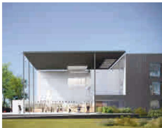
Futuro Palacio de Justicia de Valdemoro

El objetivo es que esta nueva infraestructura, que se construirá sobre una superficie de 10.445 metros cuadrados y dará cabida a un total de 16 juzgados actualmente repartidos entre sedes, pueda entrar en funcionamiento en 2022. El diseño de este equipamiento se basa en la protección de las víctimas, sobre todo los menores y las mujeres vulnerables.