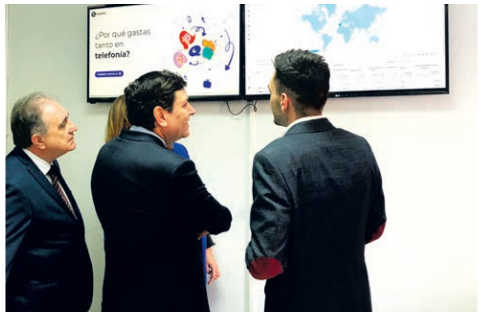
Roams expuso al consejero que está presente, además de en España, en México, Francia y recientemente Reino Unido.

D E todas las informaciones relacionadas con la composición del nuevo Gobierno, creo