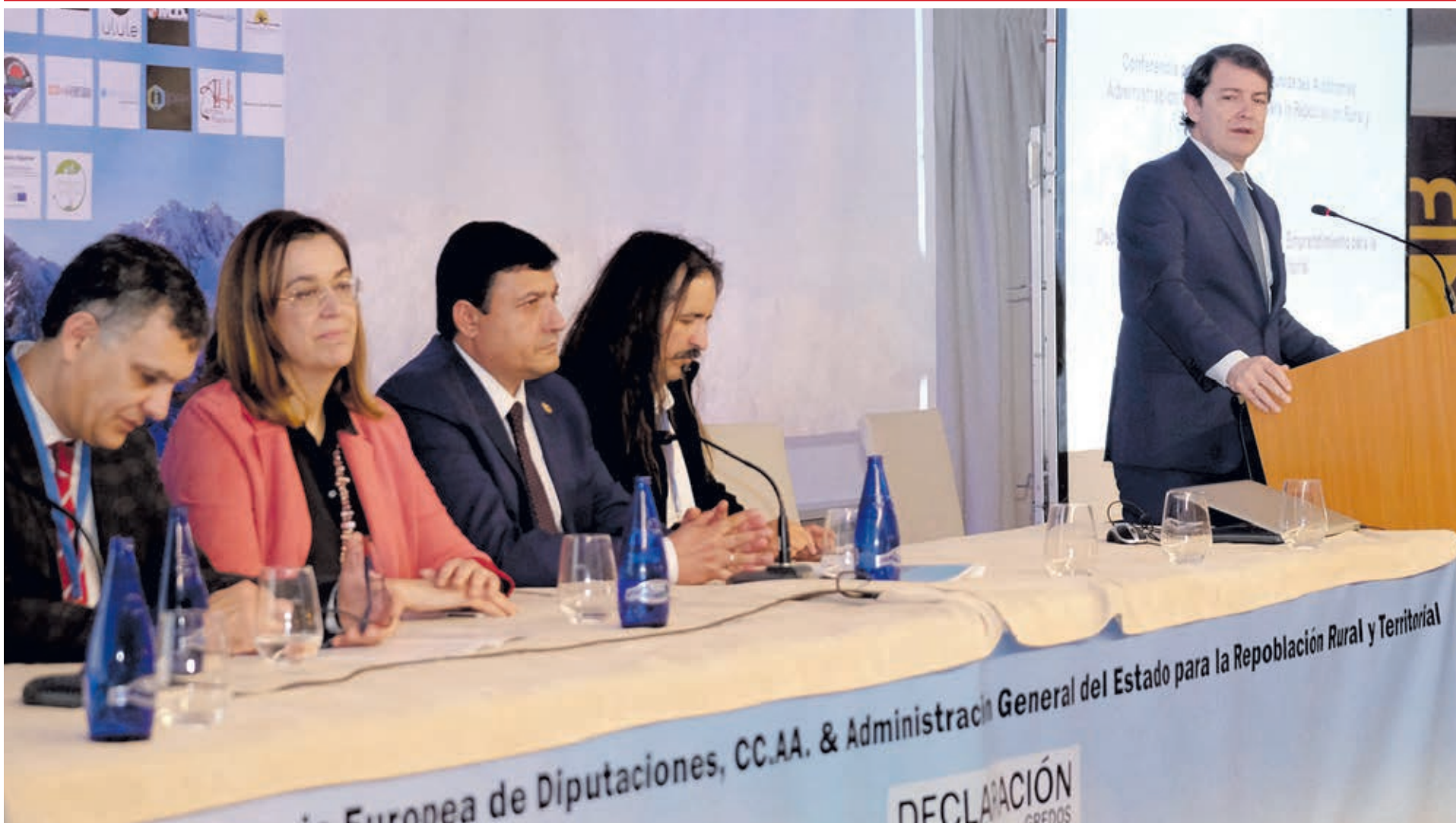
Alfonso Fernández Mañueco, durante su intervención en la Conferencia Europea de Diputaciones, Comunidades Autónomas y Administración General del Estado.