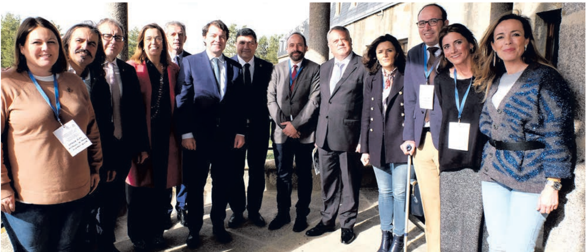
La Conferencia Europea de Diputaciones provinciales, Comunidades Autónomas y Administración General del Estado para la repoblación rural y territorial en el Parador Nacional de Gredos en Ávila, fue todo un éxito de convocatoria.