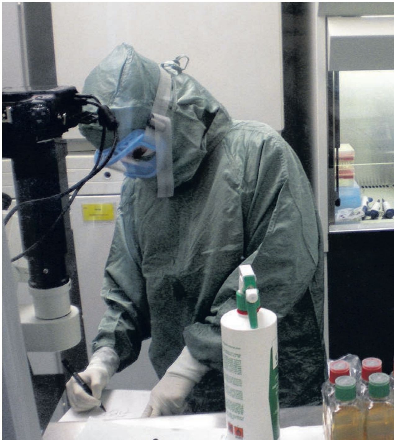
Investigadores en el interior de la Unidad de Producción Celular (IBGM). Información de DiCYT- Fundación 3CIN.

Los investigadores vallisoletanos tienen una amplia trayectoria en la preparación de células madre para su utilización en diferentes terapias regenerativas, por ejemplo, en los ámbitos cardiológico y oftalmológico. En este caso, el