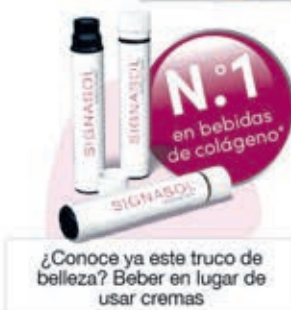
¿Conoce ya este truco de belleza? Beber en lugar de usar cremas

en la mayoría de los casos poco o nada, ya que sus moléculas de colágeno a menudo son demasiado grandes para llegar desde el exterior hasta el interior de la piel. Sin embargo, expertos dermatológicos han logrado dividir las moléculas de colágeno de tal forma que el cuerpo las puede absorber bien desde el interior.