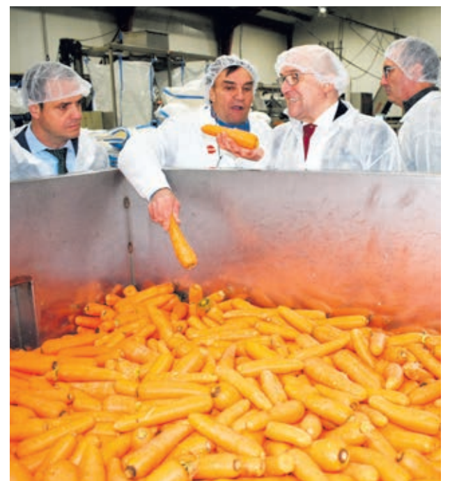
Momento de la visita a las instalaciones de la empresa segoviana.

rativas agroalimentarias. Se priorizan las inversiones que se ubiquen en el territorio rural, el carácter asociativo de la empresa y la participación de los productores primarios en el proyecto y también se prima el fomento de los circuitos cortos para favorecer la transformación de los productos más próximos a la industria. Se pueden solicitar hasta el 2 de abril, y se destinan un total de 35,3 millones de euros.