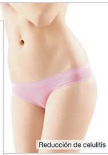
Reducción de celulitis

en la mayoría de los casos poco o nada, ya que sus moléculas de colágeno a menudo son demasiado grandes para llegar desde el exterior hasta el interior de la piel. Sin embargo, expertos dermatológicos han logrado dividir las moléculas de colágeno de tal forma que el cuerpo las puede absorber bien desde el interior.