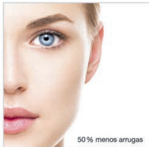
50 % menos arrugas

Es el sueño de toda mujer: una piel firme y bella, sin arrugas ni celulitis. Es algo que fortalece la autoestima y hace sentirse guapa y atractiva. Una exclusiva bebida de colágeno (Signasol, disponible en farmacias) puede reafirmar la piel y volverla radiante desde el interior.