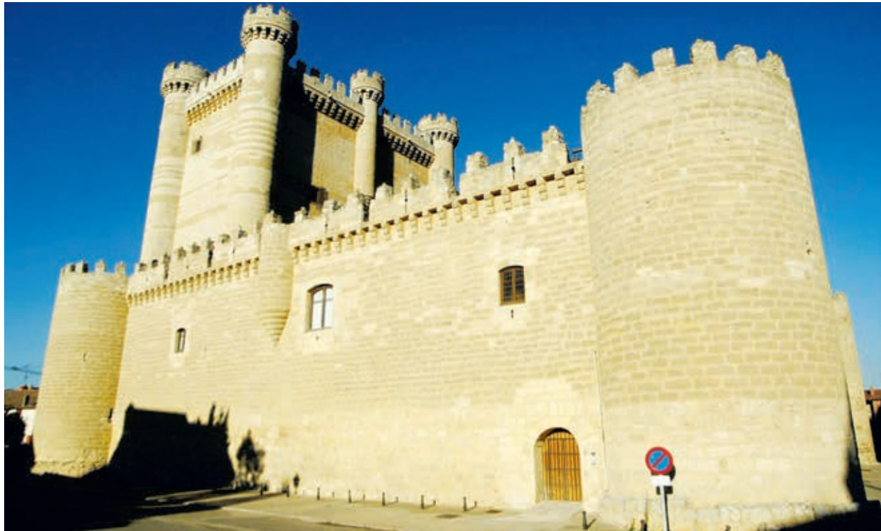
Imagen del Castillo de Fuensaldaña en Valladolid.