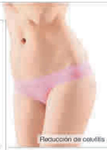
Reducción de celulitis

Consecuentemente, tiene un tacto mucho más terso y suave.