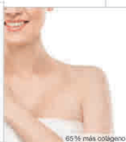
65% más colágeno