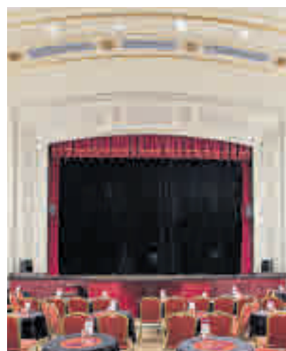
LA CHOCITA DEL LORO: Desde 1998 La Chocita del Loro es todo un referente al acoger cada semana en sus diferentes sedes a los mejores monologuistas.

El Teatro Coliseum alberga la segunda temporada del conocido musical Anastasia que el próximo 31 de marzo dejará la capital tras alcanzar un importante éxito de público y crítica. No en vano, este montaje fue agasajado con 7 galardones en las edición número 12 de la Gala de los Premios del Teatro Musical.