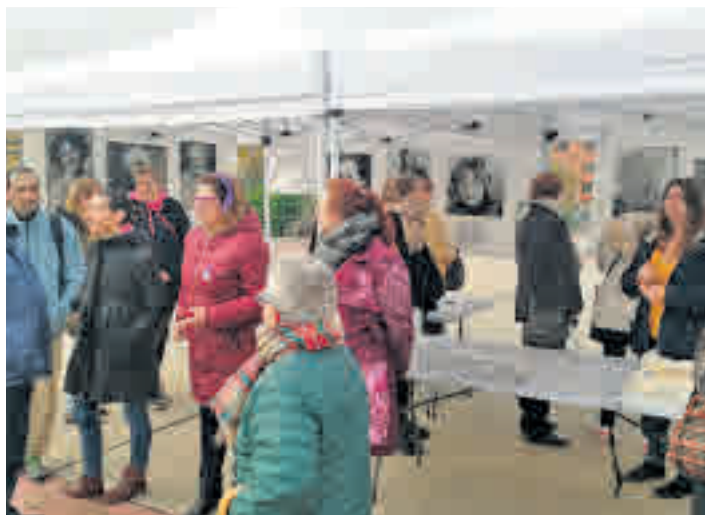
Mesa informativa: El próximo domingo 26 de enero, diversos representantes de la Asociación de Vecinos Leganés Norte instalarán una mesa informativa en la plaza del Laberinto, a las 12 horas, para informar sobre la instalación de estas antenas, entre otras cuestiones.

A finales de 2018 se instaló una antena de 1.500 kilos de peso en la azotea del mencionado inmueble, que actualmente es propiedad de un fondo de inversión. Un año más tarde, en concreto el 23 de diciembre de 2019, se procedió al asentamiento de una nueva estructura en el mismo edificio, pero en un