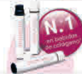
¿Conoce ya este truco de belleza? Beber en lugar de usar cremas

en la mayoría de los casos poco o nada, ya que sus moléculas de colágeno a menudo son demasiado grandes para llegar desde el exterior hasta el interior de la piel. Sin embargo, expertos dermatológicos han logrado dividir las moléculas de colágeno de tal forma que el cuerpo las puede absorber bien desde el interior.