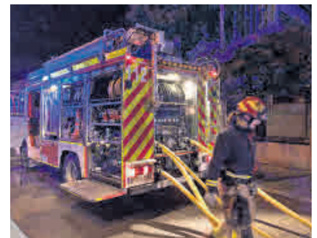
Incendio registrado el pasado 19 de enero EMERGENCIAS 112

Pese a todo, no hubo heridos ni intoxicados.