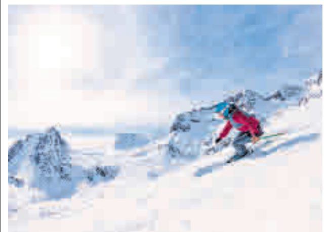
El esquí vuelve a la Comunidad de Madrid

Estas palabras llegaron después de que la portavoz de Vox en la Asamblea, Rocío Monasterio, señalase que su partido "es imprescindible para aprobar cualquier ley" y que una de sus condiciones es la aprobación del 'pin parental'.