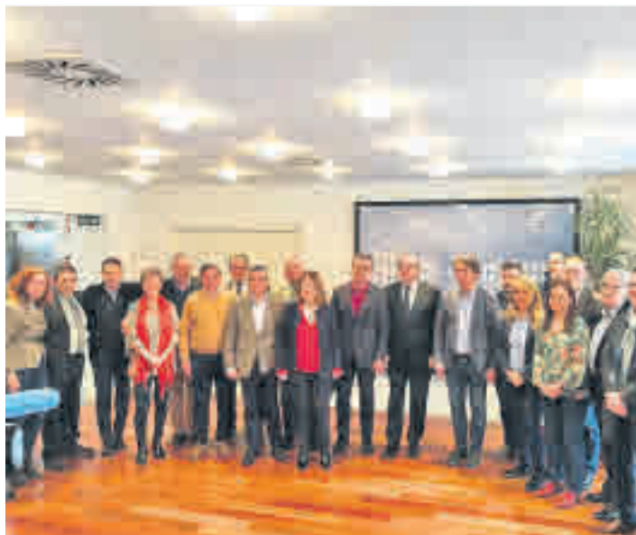
Reunión de los alcaldes socialistas del sur en Alcorcón

Con respecto a los asuntos que se trataron en la reunión, el líder de los socialistas madrileños destacó dos por encima del resto. El primero de ellos fue el de la gestión de la basura, para lo que pidió la creación de un consorcio.