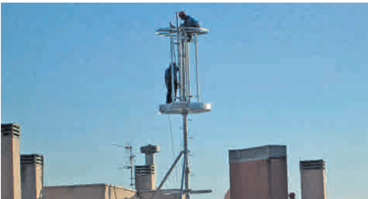
El inmueble pertenece a un fondo de inversión GUSTAVO GUZMÁN / @GUSGUZCAS