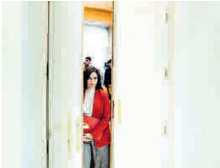
Isabel Díaz Ayuso, tras el Consejo de Gobierno

La presidenta de la Comunidad de Madrid, Isabel Díaz Ayuso, rechazó esta semana el 'pin parental' propuesto por Vox porque considera que es "innecesario", dado que en la autonomía "no se adoctrina a los niños". "No está en el acuerdo de investidura con el que se creó este Gobierno. Nosotros vamos a cumplir lo que hemos acordado. Los problemas de la educación no están en eso. No están por aquí", señaló tras la reunión de su Ejecutivo.