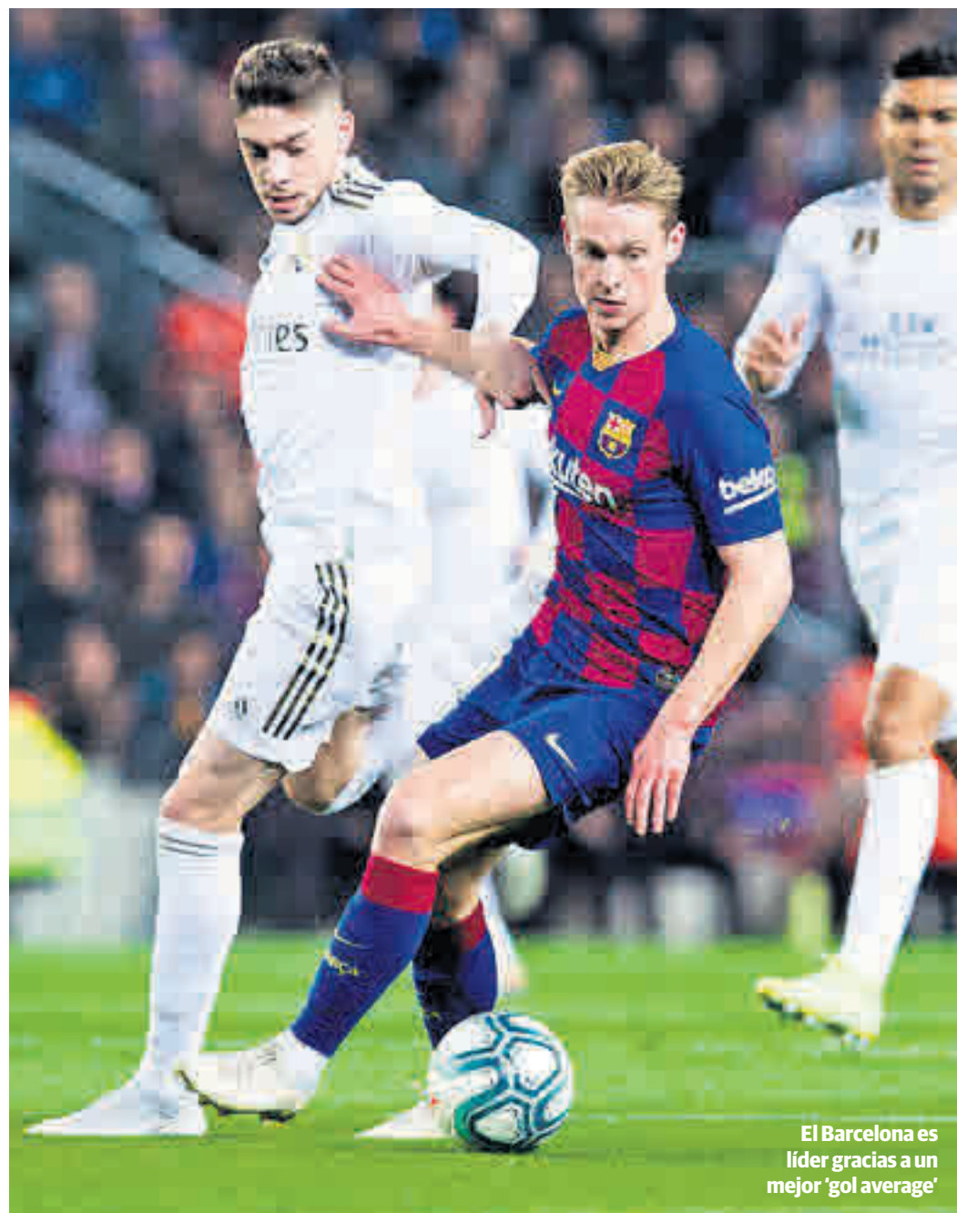
El Barcelona es líder gracias a un mejor 'gol average'

cado territorio cuando apenas acaba de arrancar la segunda vuelta del torneo de la regularidad. Por ejemplo, de los cuatro conjuntos que viajaron a Arabia Saudí para disputar la Supercopa de España, solo Barça y Real Madrid