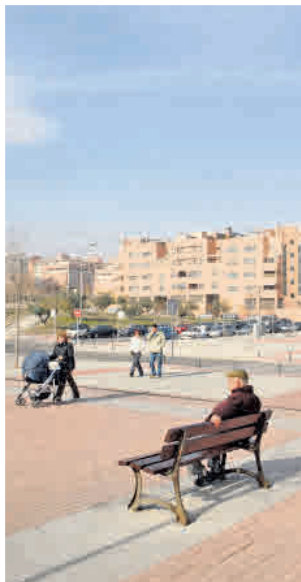
La desigualdad es muy elevada en Alcobendas GENTE

En el otro extremo también encontramos una amplia re-