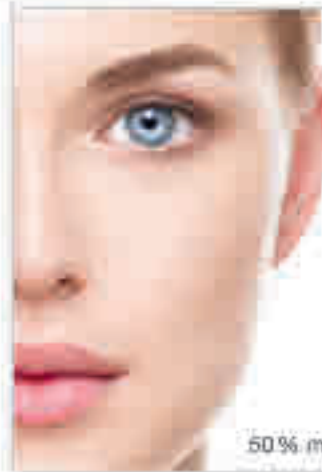
50% menos arrugas

Es el sueño de toda mujer: una piel firme y bella, sin arrugas ni celulitis. Es algo que fortalece la autoestima y hace sentirse guapa y atractiva. Una exclusiva bebida de colágeno (Signasol, disponible en farmacias) puede reafirmar la piel y volverla radiante desde el interior.