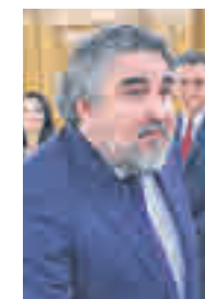
José Manuel Rodríguez Uribes MINISTRO DE CULTURA Y DEPORTES