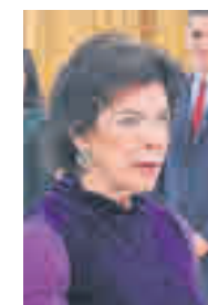
Isabel Celaá MINISTRA DE EDUCACIÓN Y FORMACIÓN PROFESIONAL