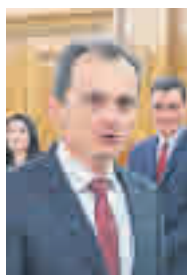
Pedro Duque MINISTRO DE CIENCIA E INNOVACIÓN