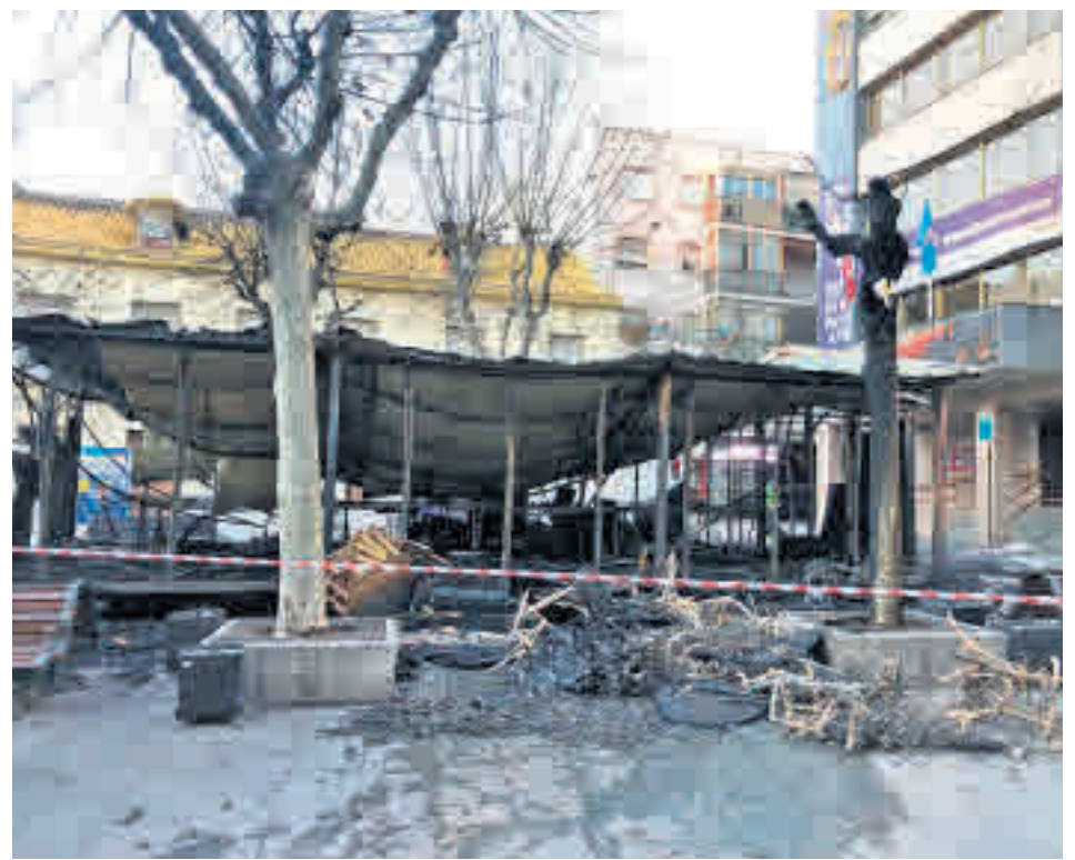
Imagen del estado en el que ha quedado la carpa

Agentes de la Policía Local y Nacional se personaron en el enclave tras un aviso ciudadano y pudieron comprobar cómo las "grandes llamas" estaban quemando la carpa, por lo que se procedió a dar aviso a los Bomberos. En la actualidad, los efectivos investigan si el incendio pudo