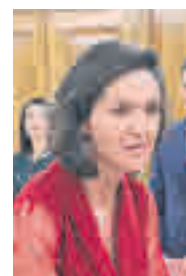
Reyes Maroto MINISTRA DE INDUSTRIA, COMERCIO Y TURISMO