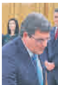
José Luis Escrivá Belmonte M º SEGURIDAD SOCIAL, INCLUSIÓN Y MIGRACIONES