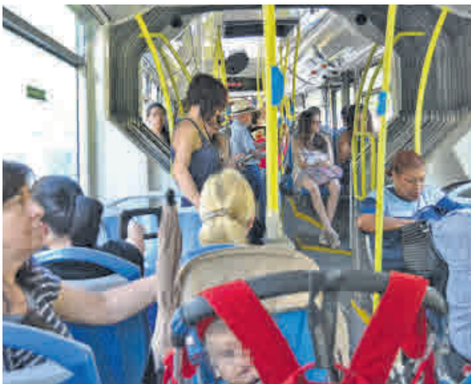
Moovit ha analizado los trayectos que realizan los madrileños CHEMA MARTÍNEZ / GENTE