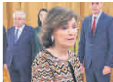
Carmen Calvo VICEPRESIDENTA PRIMERA. MINISTRA DE PRESIDENCIA Y RELACIONES CON LAS CORTES