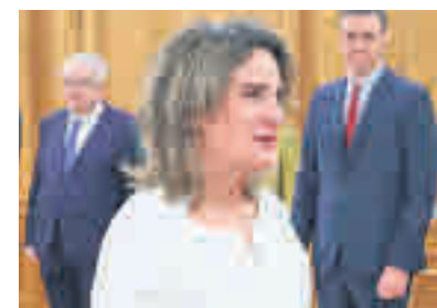
Teresa Ribera VICEPRESIDENCIA DE TRANSICIÓN ECOLÓGICA Y EL RETO DEMOGRÁFICO