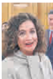
María Jesús Montero PORTAVOZ DEL GOBIERNO Y M ª DE HACIENDA