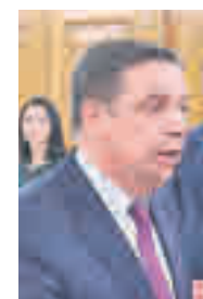
Luis Planas MINISTRO DE AGRICULTURA, PESCA Y ALIMENTACIÓN