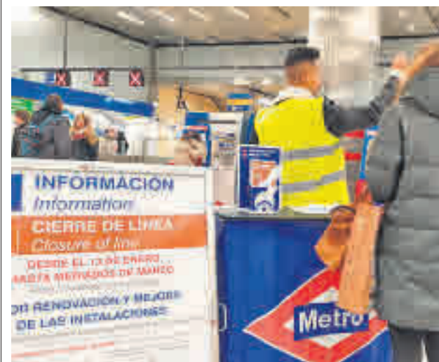
Información al viajero en la Línea 4 C. M. / GENTE

Cuando se trata de evaluar los motivos que ayudan a utilizar más el transporte público, los usuarios valoran una mayor frecuencia de vehículos y unos tiempos de espera más cortos en las paradas. Asimismo, reclaman horarios de llegada precisos y fiables y tarifas más bajas.