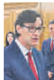
Salvador Illa MINISTRO DE SANIDAD