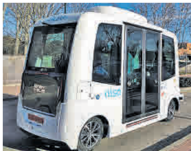
Bus autónomo de la Universidad Autónoma

El bus circulará por un recorrido circular de 3,8 kiló-