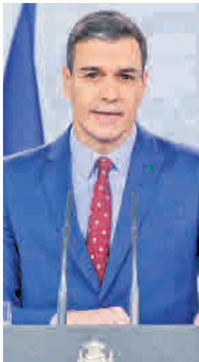
Pedro Sánchez PRESIDENTE DEL GOBIERNO