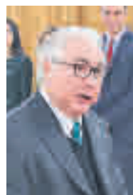
Manuel Castells MINISTRO DE UNIVERSIDADES