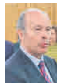
Juan Carlos Campo Moreno MINISTRO DE JUSTICIA