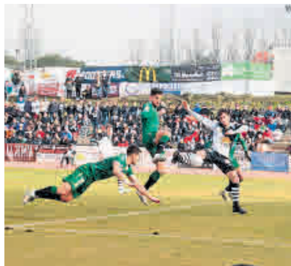
Unionistas, rival del Real Madrid, eliminó al Deportivo

Además, el calendario que tiene por delante parece un poco más accesible que el de sus vecinos. Para empezar, este sábado 18 (21 horas) visita al Eibar, la primera de las tres citas ante equipos de la zona media y baja de la tabla: Granada y Leganés serán sus rivales previos al derbi del día 1 de febrero en el Bernabéu.