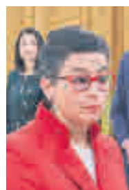
Arancha González Laya M ª DE ASUNTOS EXTERIORES, UE Y COOPERACIÓN