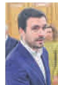
Alberto Garzón MINISTRO DE CONSUMO