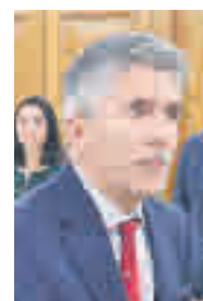
Fernando Grande Marlaska MINISTRO DE INTERIOR