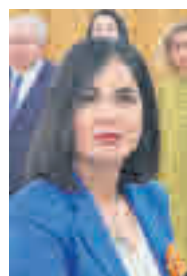
Carolina Darias MINISTRA DE POLÍTICA TERRITORIAL Y FUNCIÓN PÚBLICA