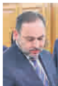
José Luis Ábalos MINISTRO DE TRANSPORTES, MOVILIDAD Y AGENDA URBANA