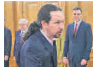
Pablo Iglesias VICEPRESIDENCIA DE DERECHOS SOCIALES Y AGENDA 2030