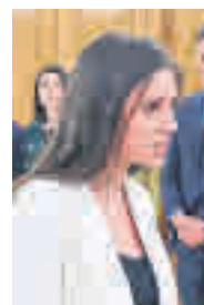
Irene Montero MINISTRA DE IGUALDAD