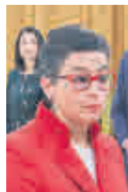
Arancha González Laya M ª DE ASUNTOS EXTERIORES, UE Y COOPERACIÓN