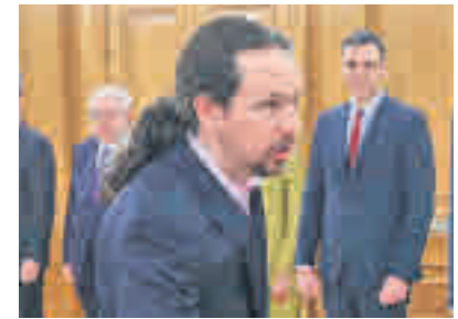
Pablo Iglesias VICEPRESIDENCIA DE DERECHOS SOCIALES Y AGENDA 2030