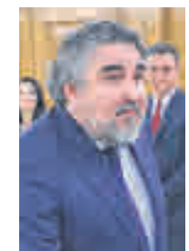
José Manuel Rodríguez Uribes MINISTRO DE CULTURA Y DEPORTES