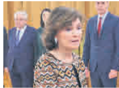
Carmen Calvo VICEPRESIDENTA PRIMERA. MINISTRA DE PRESIDENCIA Y RELACIONES CON LAS CORTES