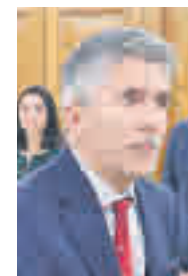
Fernando Grande Marlaska MINISTRO DE INTERIOR