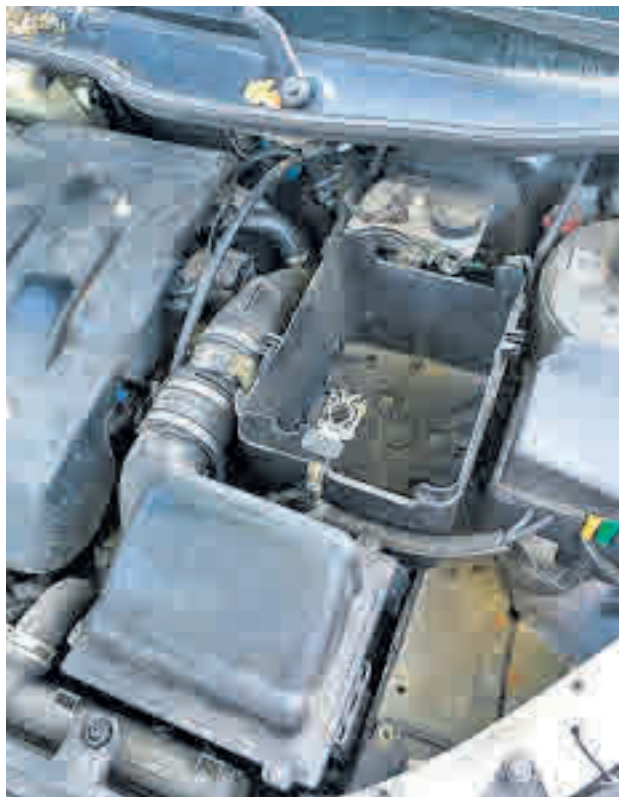
Uno de los coches afectados, al que los amigos de lo ajeno le sustrayeron la radio y la batería