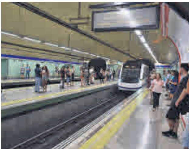
El informe analiza la movilidad en Madrid

La empresa Moovit ha realizado un estudio a nivel mundial que ofrece datos sobre Madrid ● Los vecinos de la capital son los que menos tienen que andar de España a la hora de desplazarse