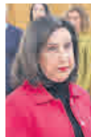
Margarita Robles MINISTRA DE DEFENSA