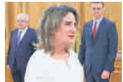
Teresa Ribera VICEPRESIDENCIA DE TRANSICIÓN ECOLÓGICA Y EL RETO DEMOGRÁFICO