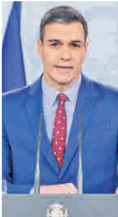
Pedro Sánchez PRESIDENTE DEL GOBIERNO