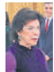
Isabel Celaá MINISTRA DE EDUCACIÓN Y FORMACIÓN PROFESIONAL