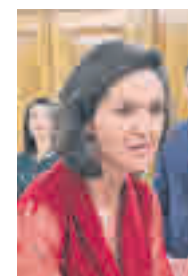
Reyes Maroto MINISTRA DE INDUSTRIA, COMERCIO Y TURISMO