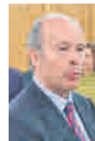
Juan Carlos Campo Moreno MINISTRO DE JUSTICIA