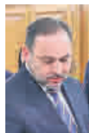
José Luis Ábalos MINISTRO DE TRANSPORTES, MOVILIDAD Y AGENDA URBANA