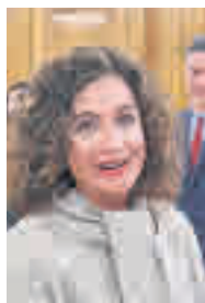
María Jesús Montero PORTAVOZ DEL GOBIERNO Y M º DE HACIENDA