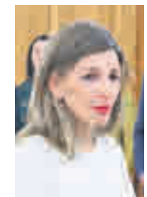
Yolanda Díaz MINISTRA DE TRABAJO