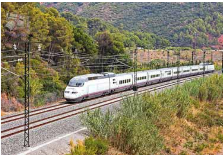
Facua considera que usar este trayecto no es una opción factible para los consumidores.

En este sentido, denuncia que "usar el tren que une Santander y Bilbao no es una opción factible para los consumidores". Facua opina que "el buen funcionamiento del transporte público tiene efectos positivos en cualquier sociedad, como una menor contaminación y la disminución de atascos, entre otros".