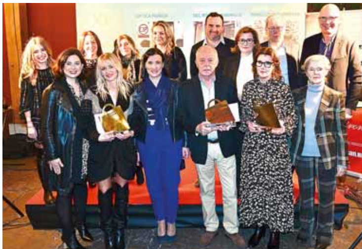
Los premiados con la alcaldesa, la concejala de Comercio y los representantes de COERCAN.

El objetivo de estos premios es poner en valor la calidad y el buen hacer del comercio santanderino reconociendo aquellas iniciativas que destacan por su innovación y adaptación a las nuevas formas de