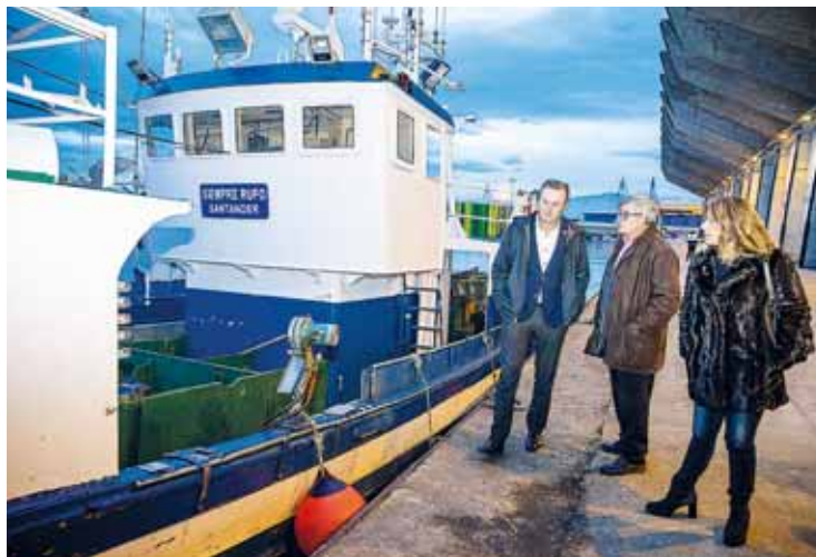
El consejero de Pesca, durante una visita al puerto pesquero de Santander esta semana.

que el Gobierno intermedie con el Ministerio para conseguir que los barcos cántabros puedan trabajar durante todo el año en la zona del Cantábrico y, sobre todo, los que se dedican a la captura de chicharro, ya que, con el nuevo reparto, con una bajada de la cuota de has-