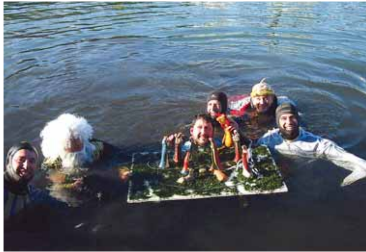
Miembros del Club Galatea con su Belén Subacuático del pasado año.

Posteriormente, han organizado su comida solidaria. Una excusa perfecta para disfrutar de una jornada con amigos y vecinos al tiempo que aportas tu pequeño granito de arena para colaborar con las personas más desfavorecidas. Así, todas las personas que deseen participar, pueden sumarse a la iniciativa aportando un kilo de productos no perecederos con destino al Banco de Alimentos municipal.