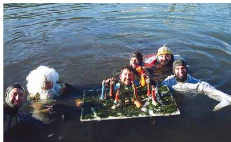
SUANCES. El Club Galatea instala el sábado su Belén Subacuático. Pág. 12

El organismo será el cauce específico de representación ciudadana en el proceso de ejecución de la Estrategia en la capital del Besaya.