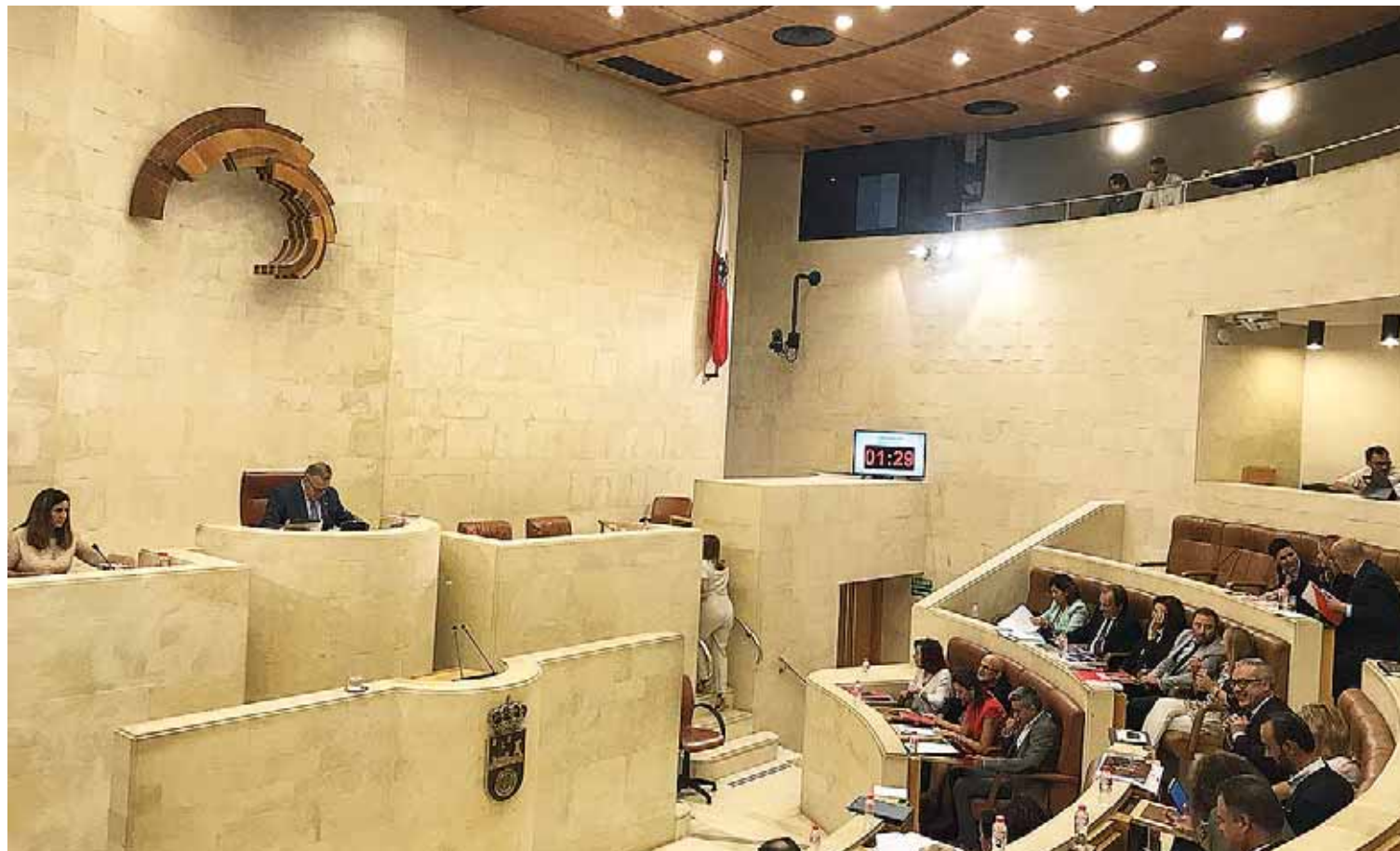
El Pleno del Parlamento de Cantabria aprobó, con los votos de todos los grupos de la Cámara, el Presupuesto del propio Parlamento, que asciende a 8.071.428 euros.

El proyecto, registrado en el Parlamento el pasado 13 de noviembre, se orienta según el bipartito a "blindar" el Estado del Bienestar, con incrementos de las cuantías destinadas a Sanidad, Educación y Dependencia, y en luchar contra la despoblación en el medio rural, mientras que las inver-