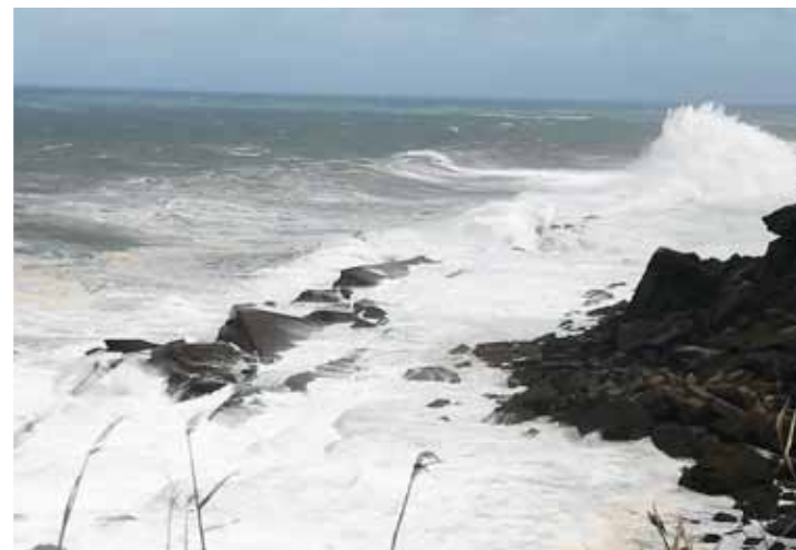
Según la AEMET, Cantabria tendrá unas navidades anticiclónicas.

METEOROLOGÍA | El invierno entra el día 22 a las 5:19 horas