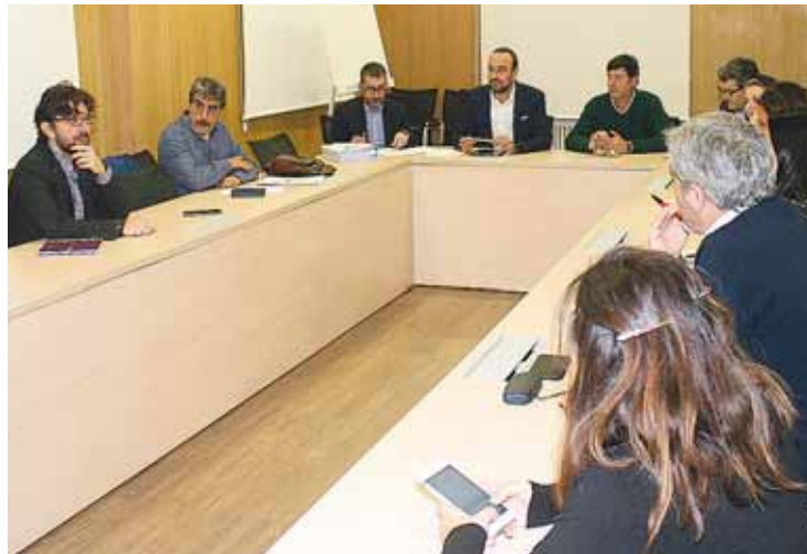
Un momento de la reunión del Consejo.

“Estamos muy satisfechos por la constitución de este Consejo, que va a ser el pistoletazo de salida para la formalización del proyecto EDUSI en Torrelavega, fondos europeos que van a ser transfor-