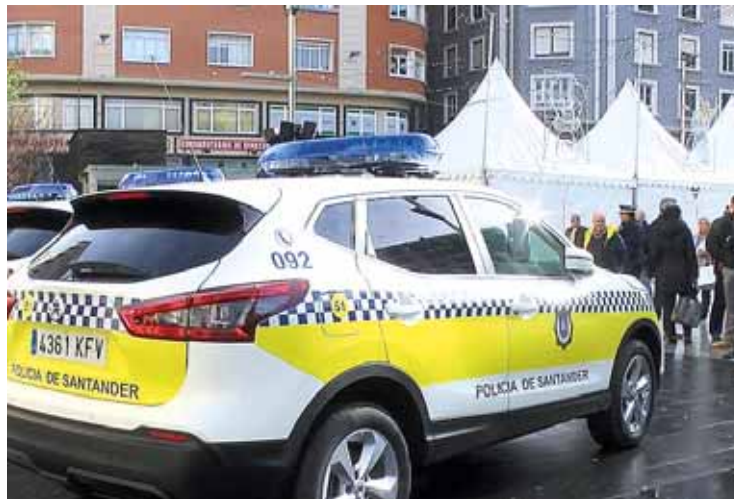
La plaza del Ayuntamiento es una de las zonas en las que se reforzará la presencia policial.

Entre las zonas en las que se reforzará la labor policial se encuentran el mercado navideño y el tobogán, en la plaza de Alfonso XIII; la pista de Patinaje, en la Porticada; o el Belén y las atracciones infantiles del Ayuntamiento.