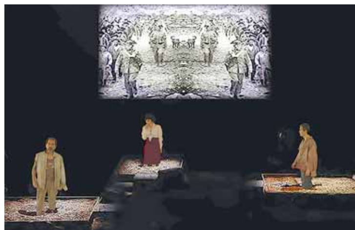
Imagen de la obra 'Coordenadas', de Laurentzi Producciones.

Con guión, espacio escénico y dirección de Lander Iglesias, 'Coordenadas' supone un antídoto con-