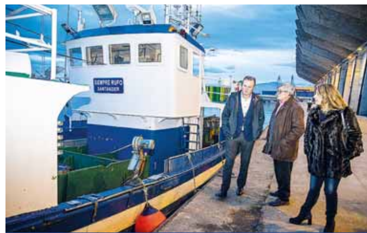
Cantabria reclama que se consiga más cuota de chicharro. Pág. 4