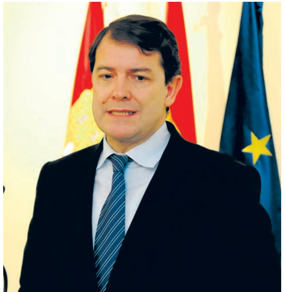
El presidente de la Junta de Castilla y León, Alfonso Fernández Mañueco, tras la conversación telefónica con Pedro Sánchez

y al resto de España. En este sentido, hizo referencia a la necesidad de que el Estado abone las cuantías que debe a las Comunidades Autónomas y mejore el modelo de financiación autonómica, algo que debe hacerse desde el consenso multilateral en el Consejo de Política Fiscal y Financiera y garantizando la igualdad de los españoles en el acceso a los servicios públicos en todo el territorio. Asimismo, le pidió que agilice las infraestructuras pendientes, como el tren de alta velocidad, el ferrocarril convencional, las autovías y el Corredor del Noroeste, y que impulse la Estrategia Demográfica Nacional con políticas de Estado para el medio rural de la región.