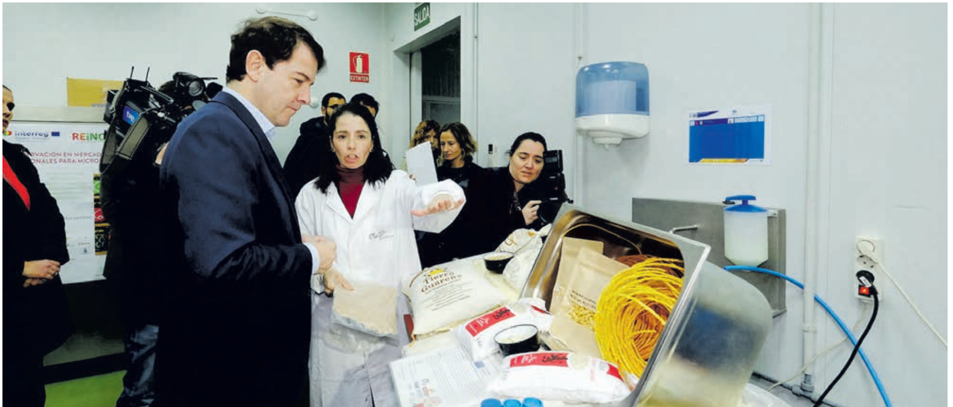
El presidente de la Junta de Castilla y León, Alfonso Fernández Mañueco, durante su visita a las instalaciones del Instituto Tecnológico Agrario de Castilla y León (ITACYL).

Comunidades Autónomas de la Vía de la Plata que se desarrolló en Santiago de Compostela. El objetivo es impulsar la Ruta Jacobea con el horizonte del Año Santo Jacobeo, en el año 2021, con un Plan Nacional. Pág. 8