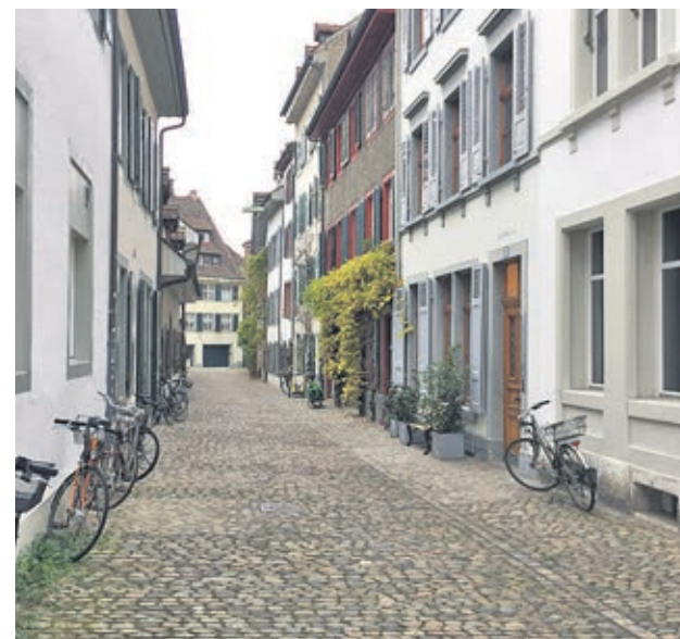
UNA ZONA CON MUCHO ENCANTO: A tan solo unos metros de dos de las plazas más céntricas de la ciudad, Marktplatz y Barfüsserplatz, se encuentra el silencio en algunas calles residenciales, muy cerca de la iglesia Leonardskirche.

discutible de la ciudad, con el que recomendamos cruzar el puente de piedra Mittlere para llegar a Claraplatz, otra importante arteria comercial en el lado nuevo de Basilea, donde hacer compras para estas fiestas que están a punto de comenzar.