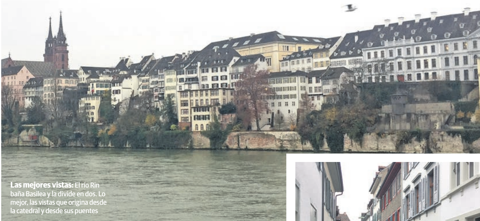
Las mejores vistas: El río Rin baña Basilea y la divide en dos. Lo mejor, las vistas que origina desde la catedral y desde sus puentes