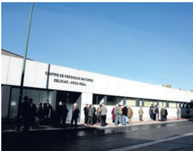
Esta iniciativa se ha puesto en marcha por el Ayuntamiento de Valladolid.

navideñas, se ha puesto en marcha la iniciativa 'Contigo en Navidad' que ofrece a las personas mayores de 80 años que vivan solas, la posibilidad de cenar, tanto el día de Nochebuena como el día de Nochevieja, y/o comer Navidad y Año Nuevo en distintas residencias de personas mayores de Valladolid.