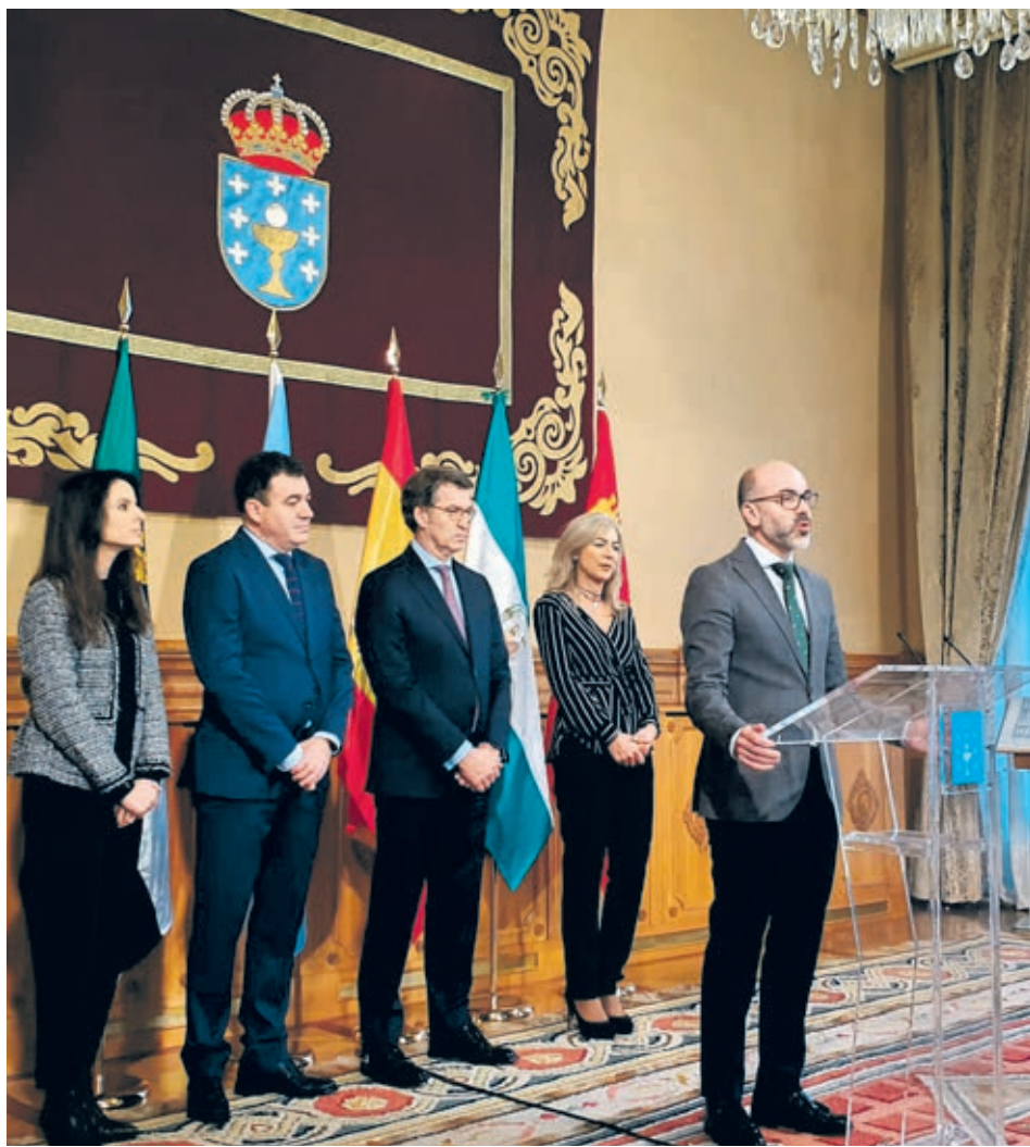
El consejero de Cultura y Turismo de la Junta, Javier Ortega, durante su intervención.