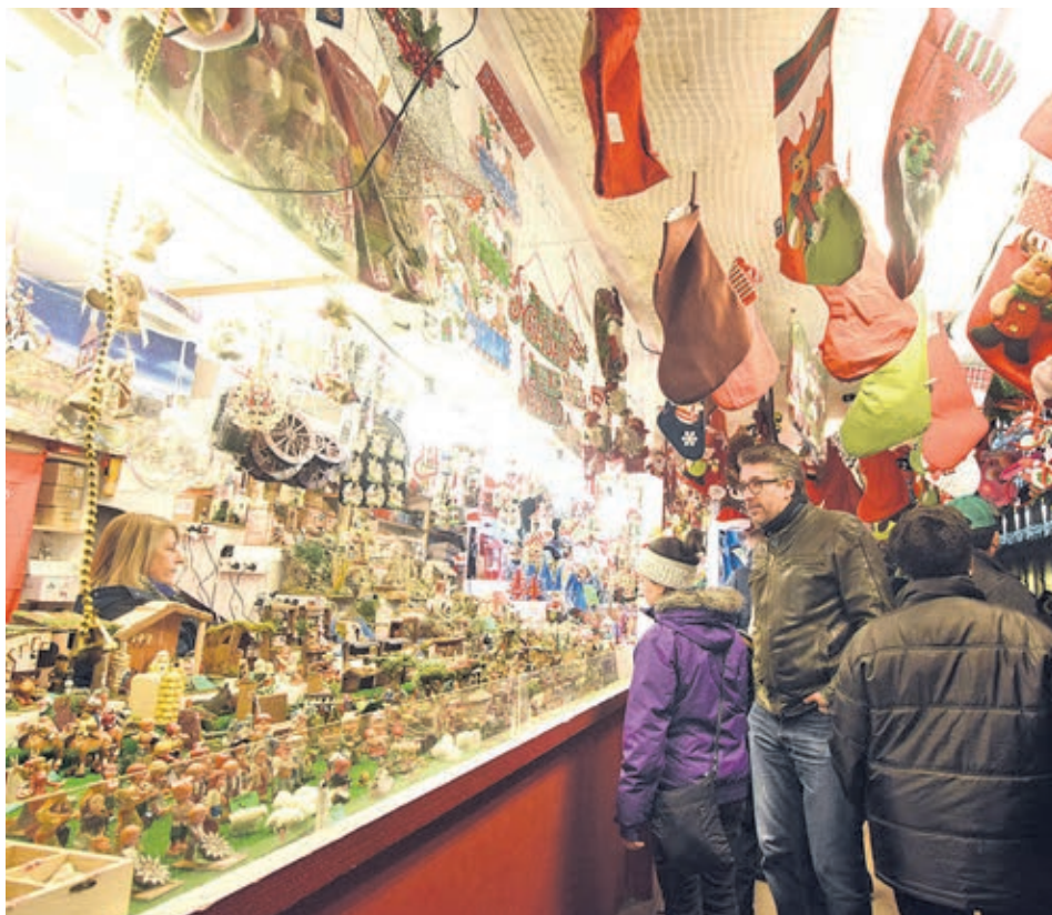
Los mercadillos toman las calles de muchas ciudades.