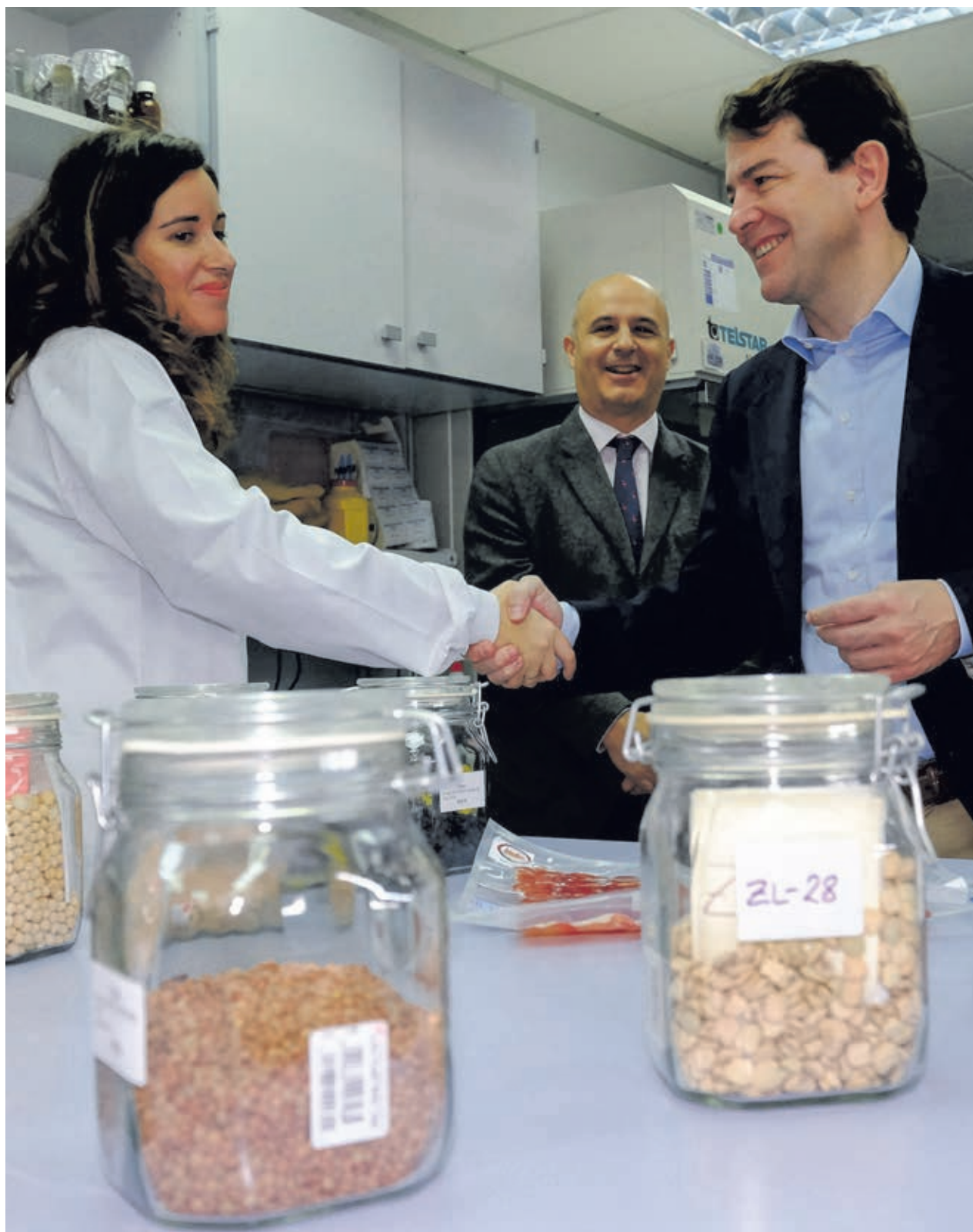
Alfonso Fernández Mañueco, durante su visita a las instalaciones del Instituto Tecnológico Agrario de Castilla y León (ITACYL).

Castilla y León está planteando también que haya una ayuda directa principal o ayuda básica a la renta regionali-