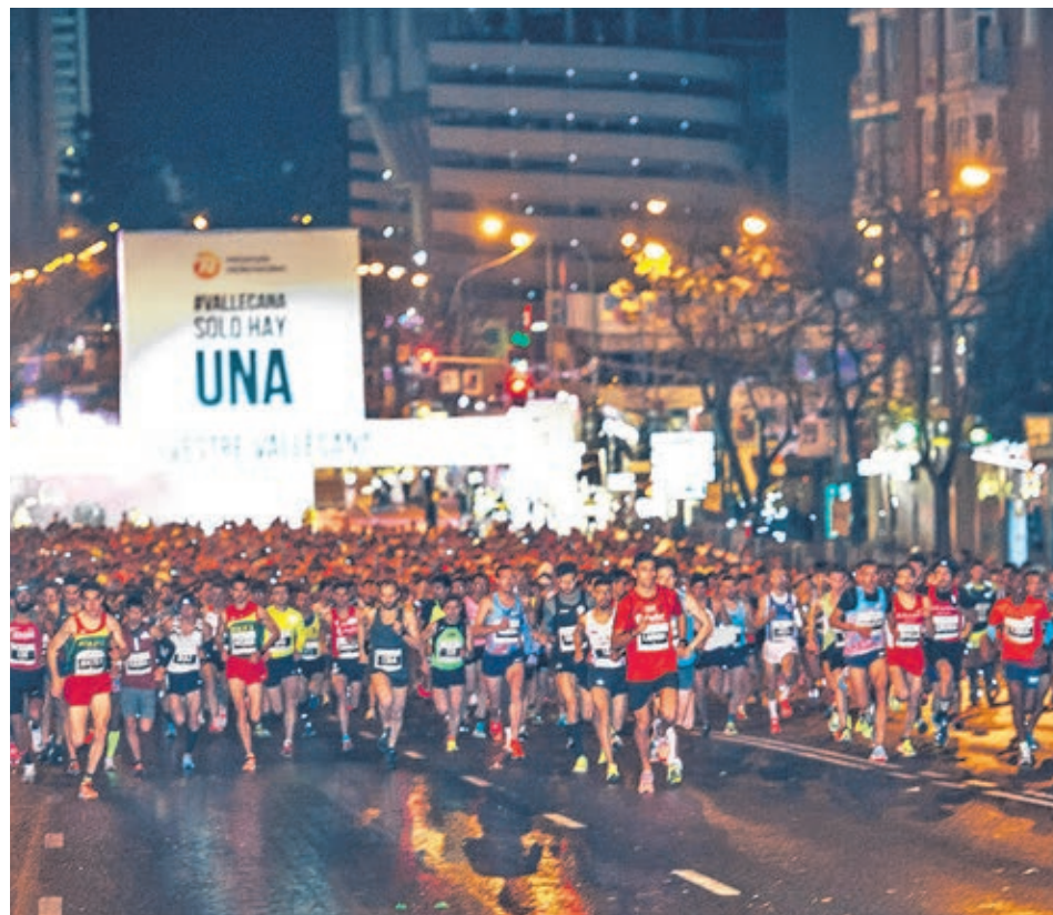
La San Silvestre, principal referente deportivo de estas fechas.