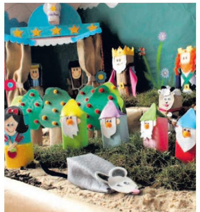
Uno de los belenes participantes en la edición de este año.

El jurado, compuesto por belenistas y profesionales de los medios de comunicación, visitará las creaciones realizadas por toda la provincia.