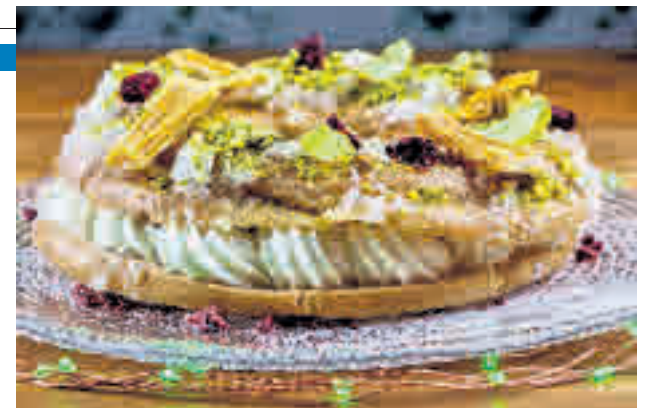
AITATXU: ¿Un Roscón de Reyes con masa tipo buñuelo? Esa es la original propuesta de uno de los restaurantes de moda. Además lleva relleno de chantilly, fruta deshidratada y polvo de pistacho. >> C/Claudio Coello, 122 | 910515434 | 12 euros/450 gr. aprox.