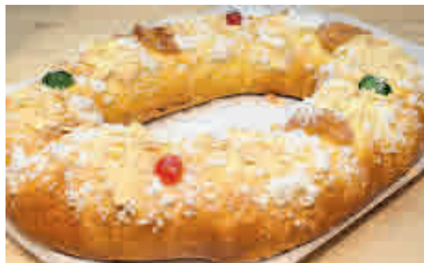
PAN. DELIRIO: El afán por rescatar la magia del roscón llevó a un padre y a su hijo a abrir un lugar donde elaborar el suyo propio. Ha sido reconocido como el mejor de Madrid y se vende todo el año. >> C/Juan Bravo, 21 | 912680588 | Precio: 39 euros/kg.