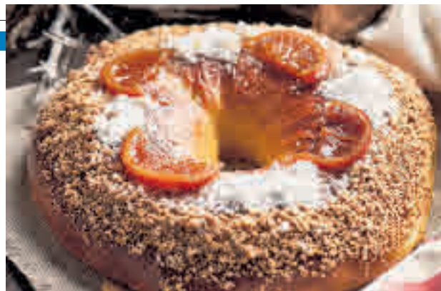
LA MIGUIÑA: La mejor opción es encargarlos a través de su web e ir a recogerlos. El relleno va aparte y, para los que no quieran esperar, hay una pequeña zona donde consumirlo allí mismo. >> C/Teruel, 26 | 652163698 | 25,90 euros/750 gr.

Bien sin cobertura, bien con frutas escarchadas y almendras. Sencillo o con infinidad de rellenos como nata, trufa o crema. Mojado en leche, en chocolate, maridado con un vino dulce o sin nada. Las formas de consumirlo son varias. En este artículo te desvelamos cuáles son aquellos que no debes dejar de probar en Madrid.