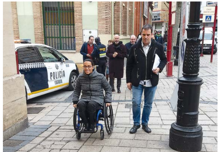
La medallista paralímpica y el concejal de Servicios Sociales durante el paseo.

A preguntas de la prensa, el alcalde se refirió a la posible peatonalización provisional de San Antón durante las navidades. Hermoso de Mendoza confirmó que ha habido conversaciones con vecinos y comerciantes en este sentido y reflexionó acerca de la contrariedad que supone tener aceras estrechas en una de las vías con más circulación de peatones. "Nos estamos encontrando que en Logroño muchas aceras son demasiado angostas y eso no está pensado en materia de accesibilidad, ya no solo para quien va en silla de ruedas, sino para todos. Ampliar la aceras y ganar espacio público es una característica de este mandato y existe un consenso, también en San Antón, para ampliar las aceras y reducir el espacio de los coches como ya se ha hecho en Múgica o Albia de Castro y ahora en la universidad", afirmó.