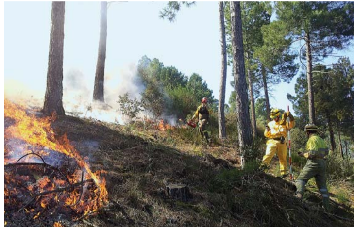
Los agentes forestales utilizan fuego técnico en la extinción de un incendio en el monte.