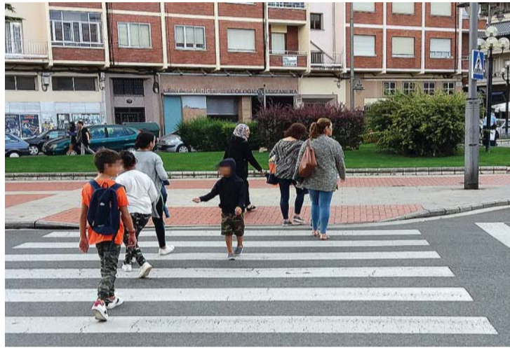
El programa de Educación Vial está dirigido a alumnos de Infantil y Primaria.

También proseguirá el programa de Educación Vial dirigido a