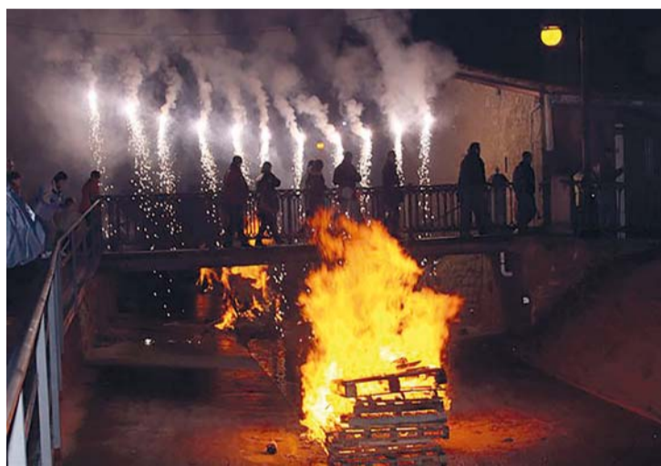
Más de 100 hogueras se repartirán por todo el municipio este sábado 7.

A las 19 horas, la fiesta comenzará con el repique de campanas que anuncia el encendido de las hogueras y la visita a 'Los Marchos' en compañía de la banda de gaiteros.