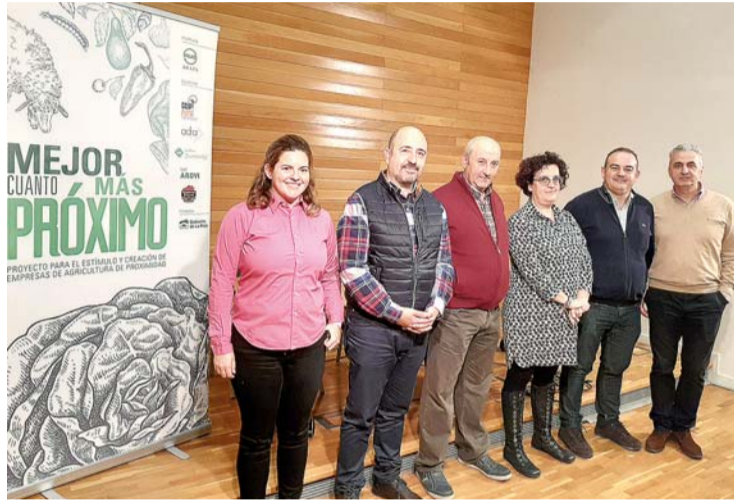
Los promotores de esta iniciativa, durante la presentación el lunes 2.

Este proyecto se desarrollará en toda la región, excepto en el área metropolitana de Logroño, y cuenta con un presupuesto de 39.850,54 euros, que financia el Gobierno de