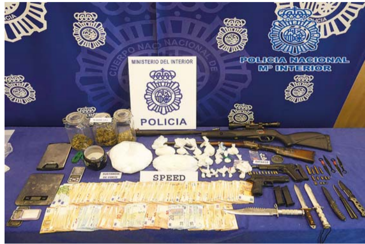
Los delitos por tráfico de drogas se incrementaron en un 50% -suben de 56 a 84-.

Los delitos por tráfico de drogas registraron un aumento del 50% en estos nueve primeros meses de año -pasaron de 56 a 84-. También se dieron ligeras subidas en los delitos graves y menos graves de lesiones y riñas tumultuarias -9