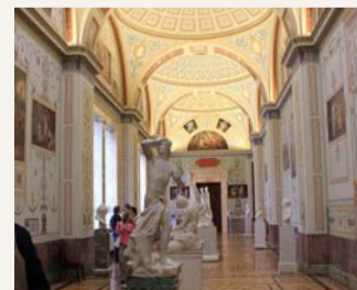
Museo del Hermitage, San Petersburgo.

la Lengua se dan más importancia... Vaya usted a saber. Estoy seguro de que en el futuro desaparecerán. Veo a nuestros chicos mezclar palabras en español e inglés o alemán. Ellos le van a dar mucha menos importancia a las reglas gramaticales y de ortografía que nosotros. A mí me costó mucho aprenderme que ermita era sin 'H', pues yo me acordaba de que el Museo del Hermitage se escribe con 'H' y ermita en inglés, noruego, sueco o luxemburgués se escribe con 'H', y nosotros y los franceses o portugueses sin ella. O sea, que me sigue pareciendo que son ganas de liar la manta.