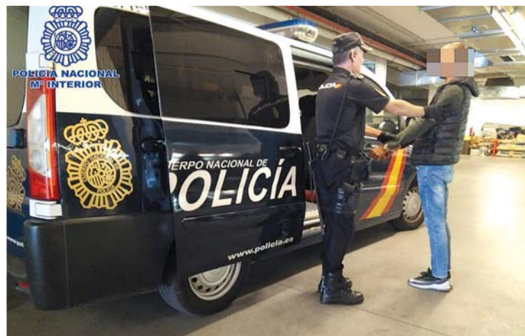
El individuo, en el momento de ser arrestado, llevaba éxtasis y speed.

RECLAMADO JUDICIALMENTE | Antecedentes penales