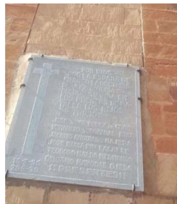
Homenaje a los Caídos, en Tricio.

Durante todo el año se realizó la investigación con el fin de localizar y categorizar los distintos vestigios franquistas y de exaltación de la Guerra Civil y la dictadura, con el objetivo de dar cumplimiento a las diferentes disposiciones sobre Memoria Histórica. El equipo de investigación interdisciplinar es-