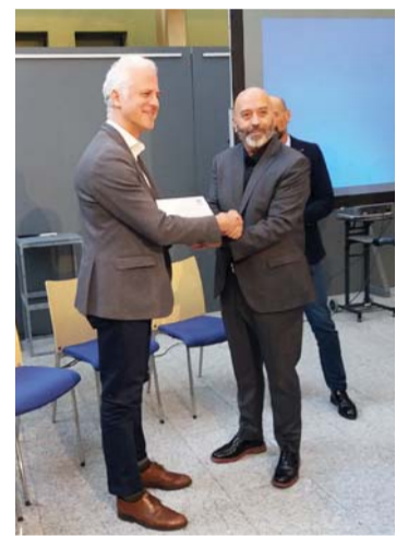
El alcalde recogió el premio 'Mapcesible'.