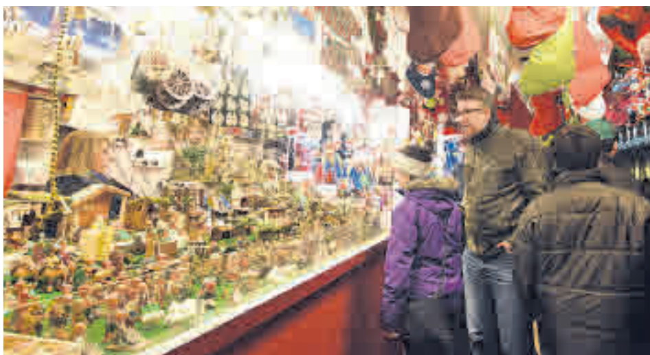
Los mercadillos toman las calles de muchas ciudades