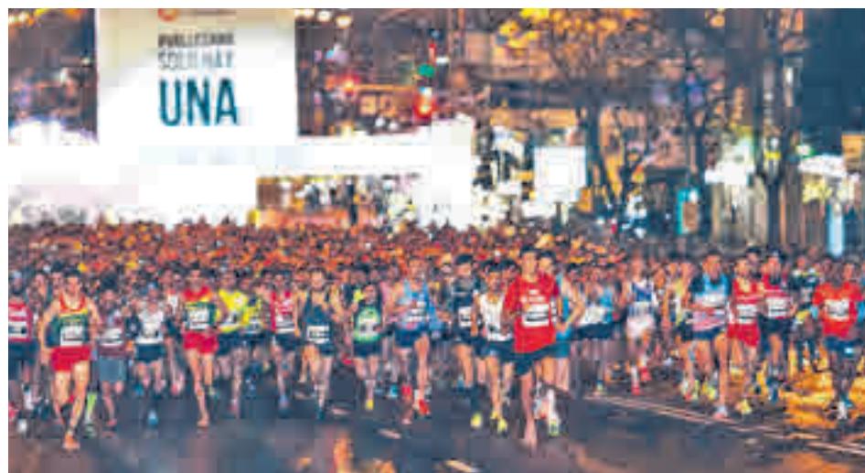
La San Silvestre, principal referente deportivo de estas fechas