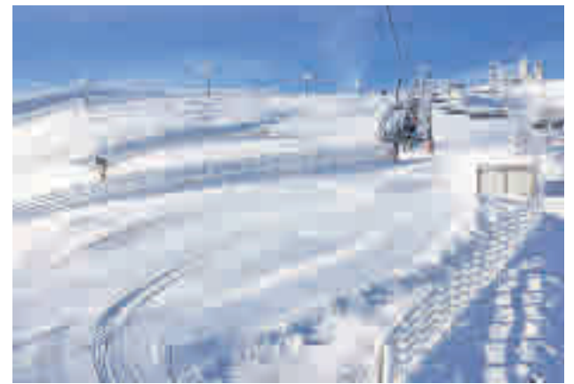
Valgrande-Pajares lidera el ránking

Llega el invierno, las montañas se visten de blanco y los amantes de los deportes de nieve se preparan para la acción • Repasamos las mejores estaciones relación calidad-precio que se pueden encontrar en España