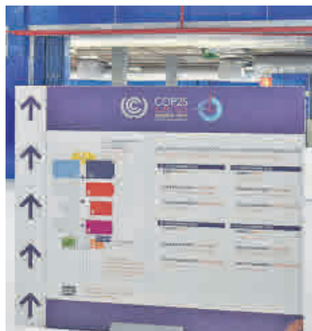
Algunos de los paneles de la COP25

de Madrid cifra el impacto en la región en unos 200 millones de euros, de los que 148 repercutirían directamente en la capital. La inversión pública correrá a cargo del Gobierno central y se prevé que esté en torno a los 86 millones de euros, de los que el Ministerio de Transición Ecológica espera recuperar unos 17 millones.