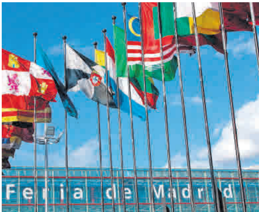
Los actos tendrán lugar en el Recinto Ferial de Ifema

Por otro lado, la Comunidad impulsará un debate sobre la tecnología satelital y la previsión de contaminantes, un proyecto que está llevando a cabo de la mano de la Agencia Estatal de la Meteorología (Aemet). También habrá dos coloquios, uno sobre cómo aplicar las políticas sanitarias y medioambientales a la adaptación del cambio climático y otro sobre diversidad con Seo Birdlife.