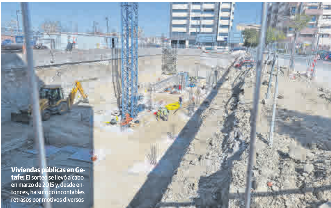
Viviendas públicas en Getafe: El sorteo se llevó a cabo en marzo de 2015 y, desde entonces, ha sufrido incontables retrasos por motivos diversos