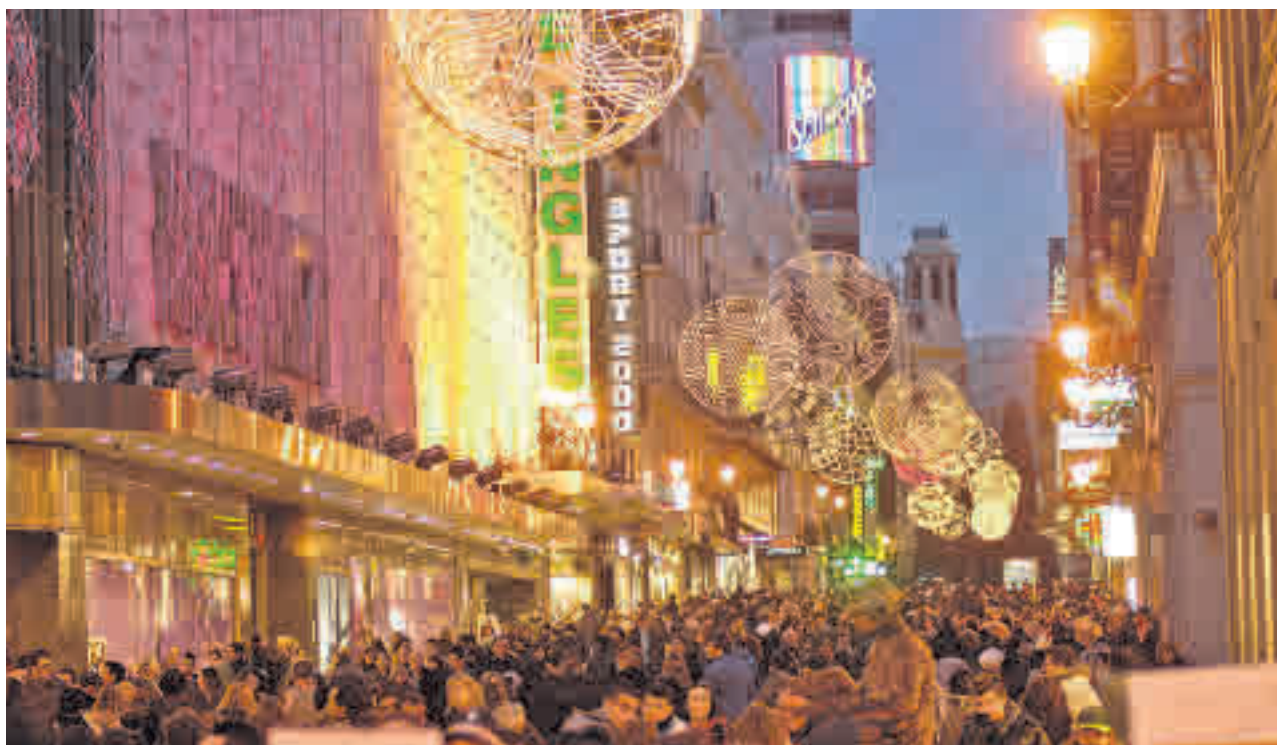
El 81% de los españoles participará en esta jornada GENTE

No en vano, los artículos de electrónica o moda serán los más demandados. Una