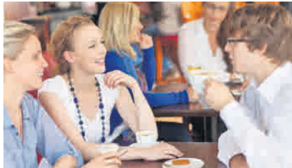
El comprador español es el más fiel a esta cita

Si bien, de acuerdo con el estudio elaborado para la ocasión por el Observatorio Cetelem muestra que en esta nueva edición los españoles gastarán un 6% menos que la celebrada en 2018. No obstante, el comprador en España suele ser el más fiel a esta cita.