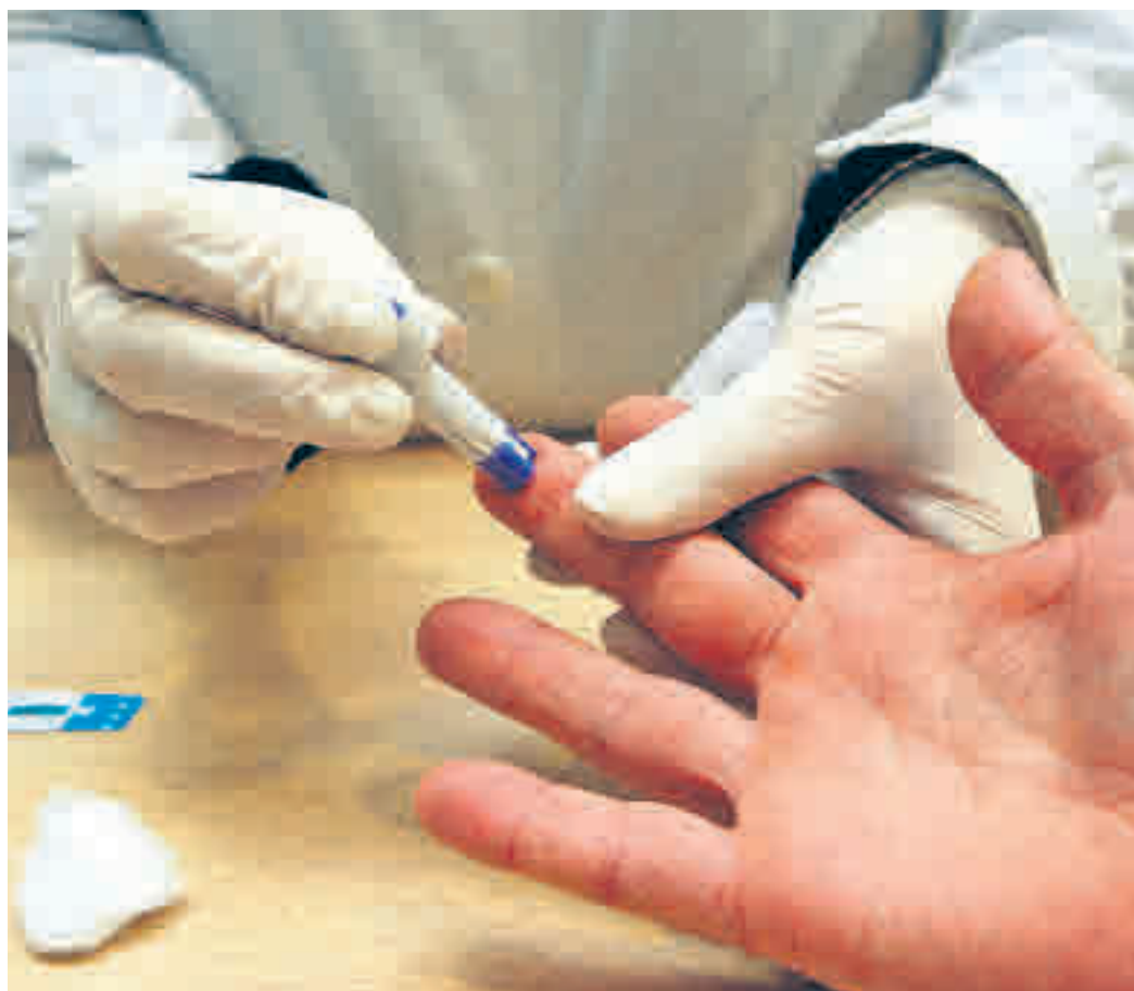
Una persona se somete a una prueba de detección del VIH

"Todas las personas que hubieran podido tener una opción de riesgo, deberían ha-