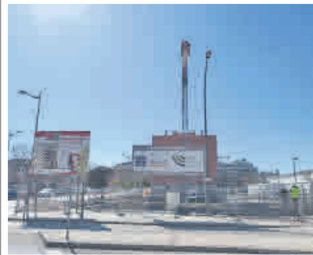
Viviendas públicas en construcción en El Rosón