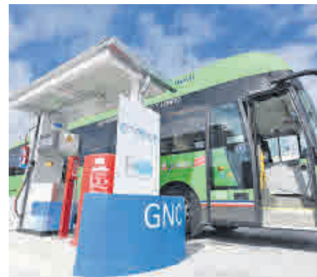
'Gasinera' en la Comunidad de Madrid

Uno de los sectores más beneficiados por la celebración del evento es el de la hostelería. La asociación del gremio prevé que los visitantes dejen alrededor de 13,75 millones de euros en los bares, cafeterías y restaurantes. Hay que tener en cuenta que la ciudad recibirá a unos 600.000 turistas en estos días por las compras navideñas.