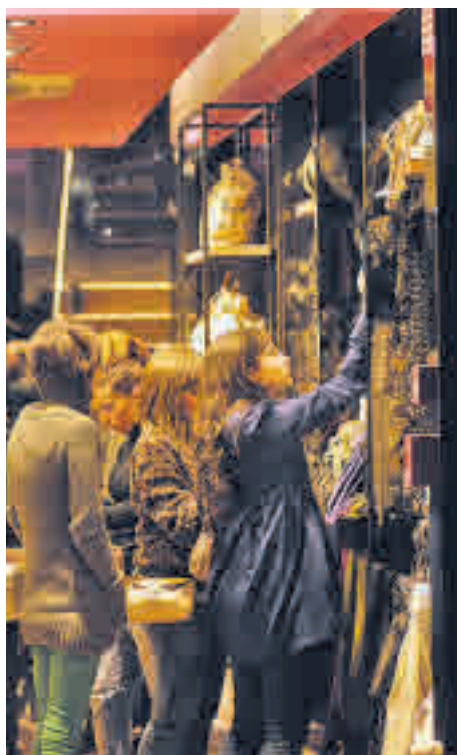
Las mujeres prefieren adquirir moda GENTE