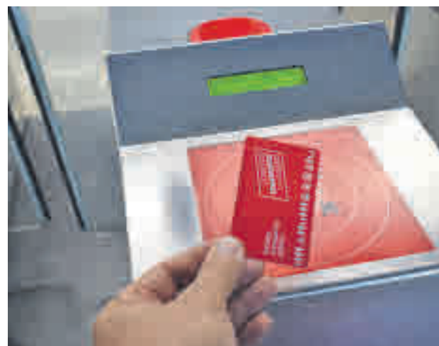
El móvil servirá como título de viaje

de cara al futuro más próximo (antes de 2023) apuesta por "una gran aplicación que permita a cualquier usuario elegir la mejor combinación de transporte público y privado también". "Esa es la gran herramienta que falta y eso es hacia donde nos tenemos que dirigir, ese gran gestor inteligente de todo el transporte en la Comunidad de Madrid que facilite la vida a