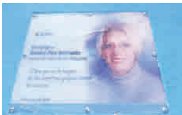
Una de las placas que ha amanecido rota