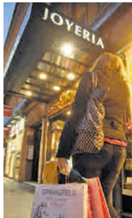
El gasto medio será de 258 euros GENTE

elección que, de acuerdo con la consultora, aún está condicionada por los roles clásicos de género. Así, la encuesta pone de relieve que los hombres se decantarán por la informática (56%), mientras que las mujeres optarán por el sector textil (47%). En cuanto a los principales canales que