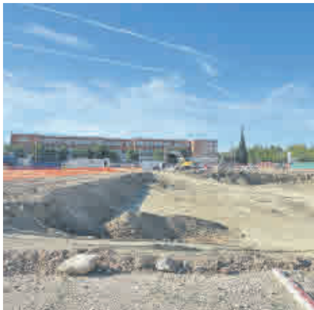
El polideportivo San Isidro

La rotura fortuita el pasado 22 de noviembre de una tubería de abastecimiento a presión del Canal Isabel II en la calle Toledo de Getafe retrasará unos días las obras del polideportivo de San Isidro. Según la previsión, los trabajos de cimentación de la estructura podrán comenzar en los primeros días del mes de diciembre, siempre que las condiciones meteorológicas lo permitan, dado que este hecho ha provocado que la excavación de los terrenos