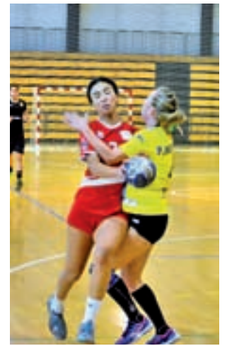
El Villaverde es penúltimo

Por su parte, el Ikasa BM Madrid se liberó de parte de esa presión al sumar su pri-