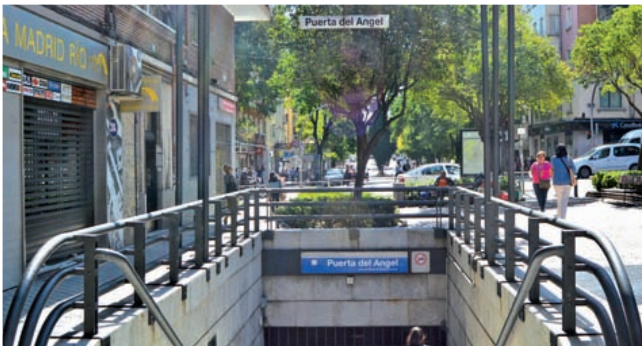
Una de las entradas a la estación de Alto de Extremadura