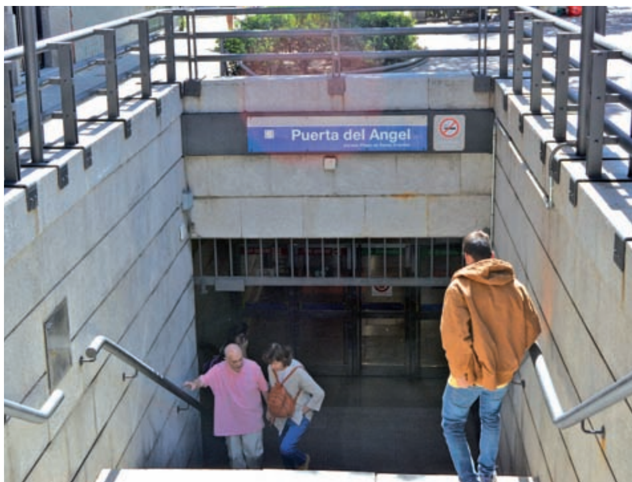
PEPE RIOFRÍO / GENTE