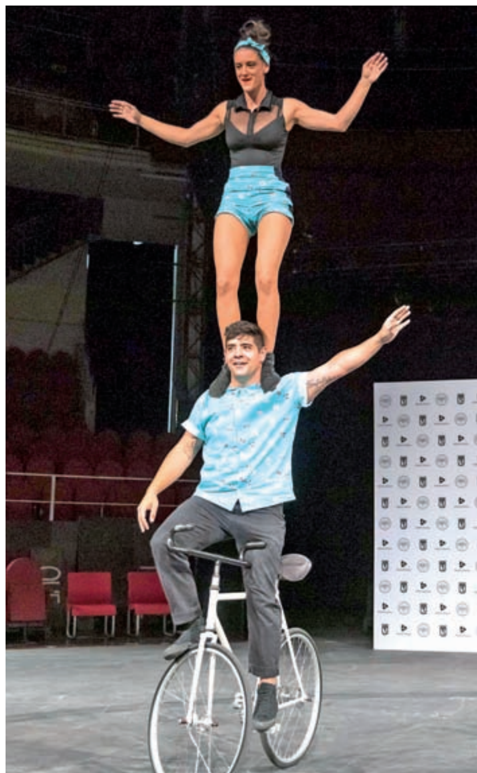
El número de bicicleta acrobática de la compañía Alta Gama se podrá ver en FIRCO

EL PROGRAMA ARRANCA ESTE FIN DE SEMANA CON 'LE VIDE-ESSAI DE CIRQUE'