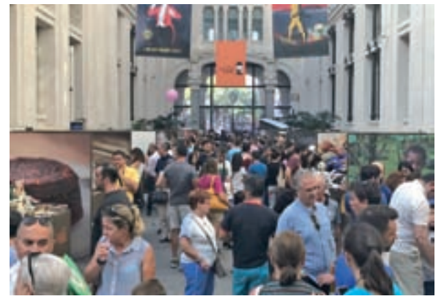
Ambiente en el Salón Internacional del Chocolate 'CHOCOMAD'

Del 20 al 22 de septiembre tendrá lugar la segunda edición del Salón Internacional del Chocolate 'CHOCOMAD' en el Palacio de Cibeles • Recordamos a la ciudad que, en el siglo XIX, fue la Villa del Chocolate, Pinto