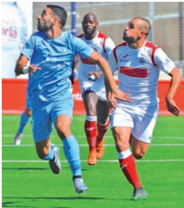
Una jugada del Sanse con el Ibiza

La UD Sanse se prepara para visitar este domingo 15 de septiembre a las 12 horas al Atlético Baleares, en el que será el tercer partido de la