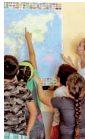
Entrega del material

Con tres modalidades distintas para adaptarse a cada ciclo educativo (Infantil, Primaria y Secundaria), los kits incluyen una mochila, un estuche (con bolígrafo multico-