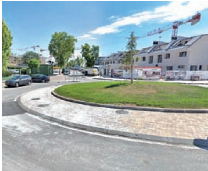
Las viviendas de La Carrascosa A están terminadas y ocupadas en parte

El motivo para esta impugnación es, según dichas sentencias, que el Plan aprobado el 26 de junio de 2012, “es contrario a Derecho”.