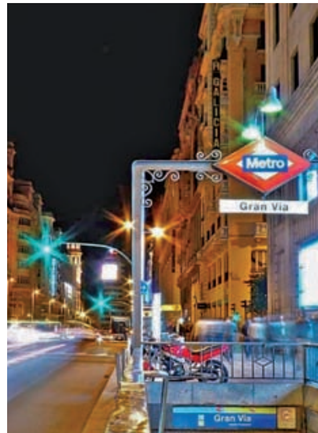
Metro abrirá los fines de semana

Aguado también se refirió a la posible ampliación de algunas de las líneas de Metro