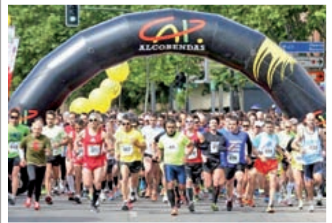
Salida de la anterior edición

Por su parte, su rival de este domingo, el Atlético Baleares, está quinto en la clasificación, habiendo sumado seis puntos. El equipo comenzó la temporada ganando 0-1 al Langreo y 1-0 a Las Palmas Atlético. Sin embargo, en la última jornada cayó 2-1 en el partido contra el Rayo Majadahonda.