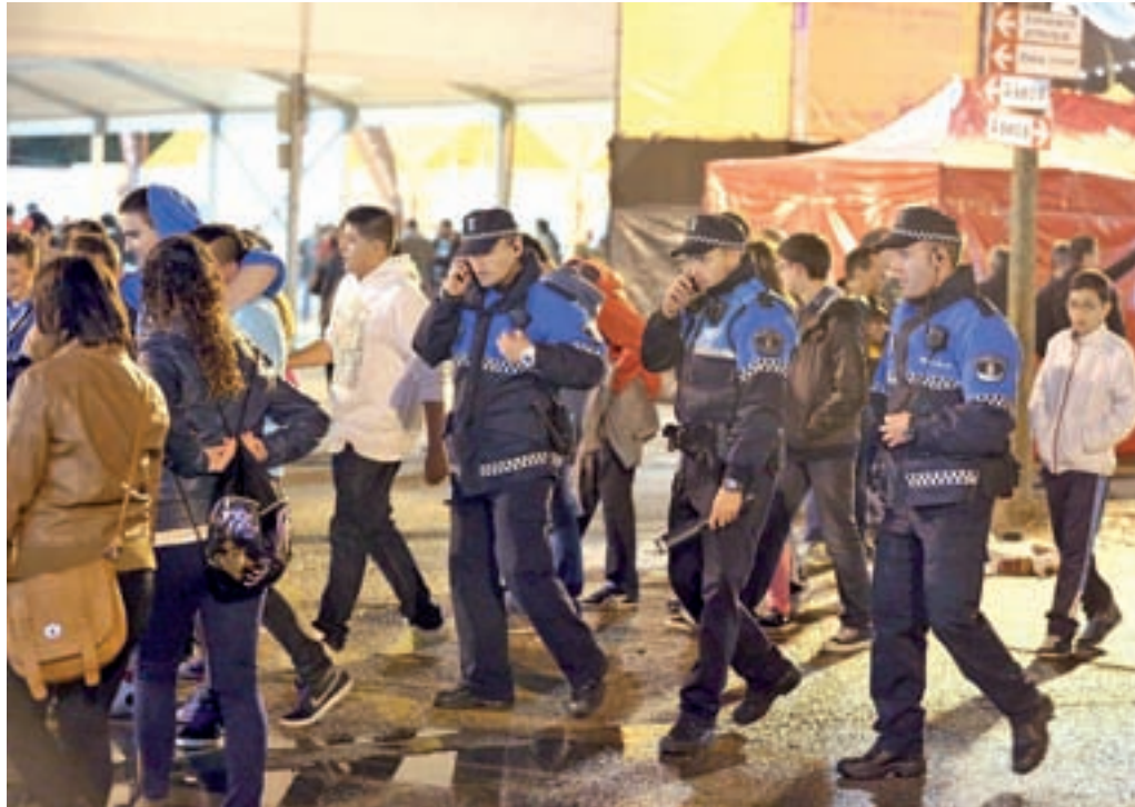
Alcobendas es la ciudad más insegura

En segundo puesto se sitúan las sustracciones de vehículos, que suben significativamente un 95,6%, pasando de 68 a 133 casos. Por otro lado, los robos con fuerza en establecimientos y otras instalaciones crecen un 45,8%, de 153 a 223. En la misma línea se sitúan los robos con fuerza en domicilios, que