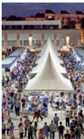
Imagen de la feria

Durante cuatro jornadas, un total de 24 casetas quedarán instaladas en la Plaza Mayor, junto al Ayuntamiento,