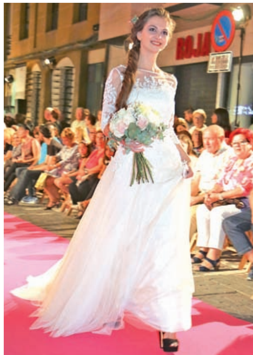
Desfile de vestidos de novia en la edición de 2017