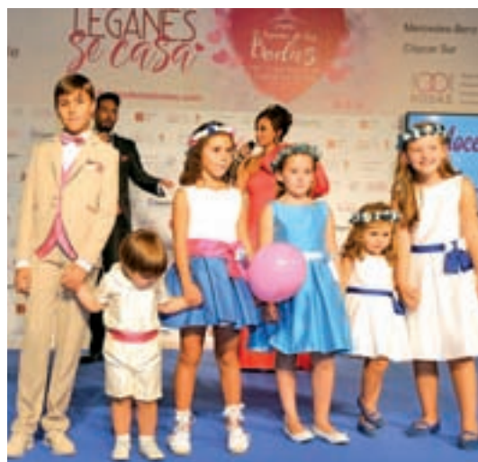
Arras sobre la pasarela