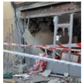
Imagen de los daños