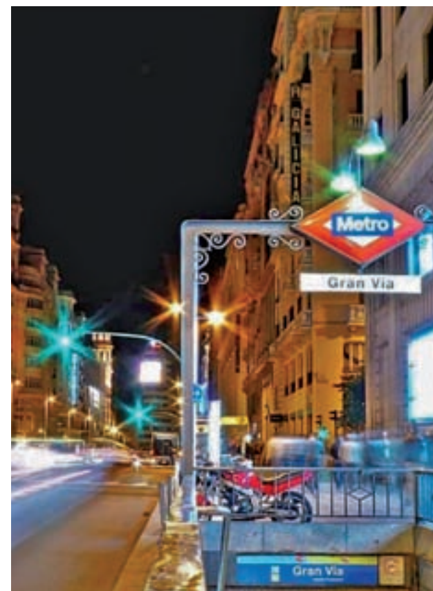
Metro abrirá los fines de semana