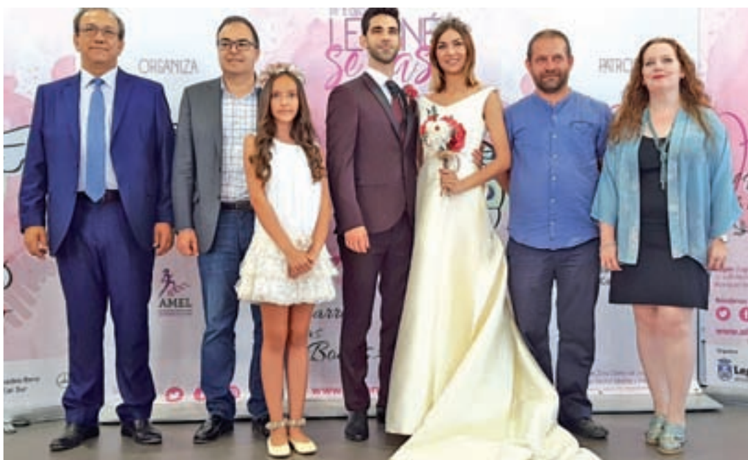
Presentación oficial de 'Leganés se casa'