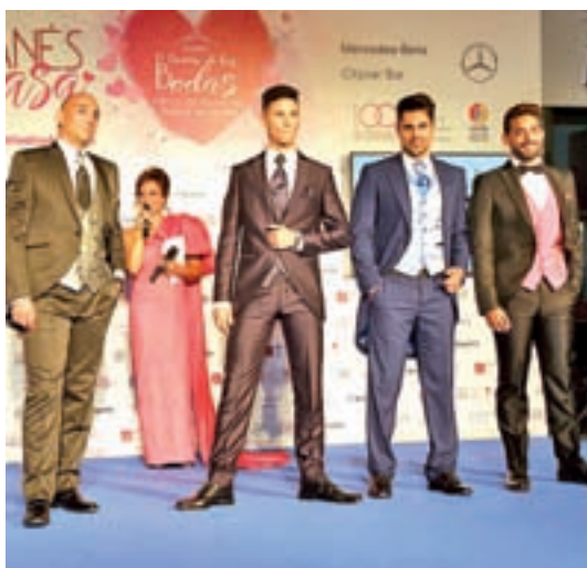
Desfile de trajes de novios