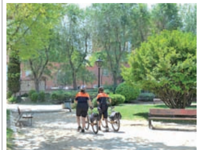
Voluntarios de Protección Civil en Valdemoro

Según fuentes policiales, el herido fue detenido y trasladado a un centro hospitalario por el servicio municipal de Emergencias (PIMER-Protección Civil), al tiempo que quedó en custodia de la Guardia Civil. Las fuerzas de seguridad también detuvieron a un segundo implicado.