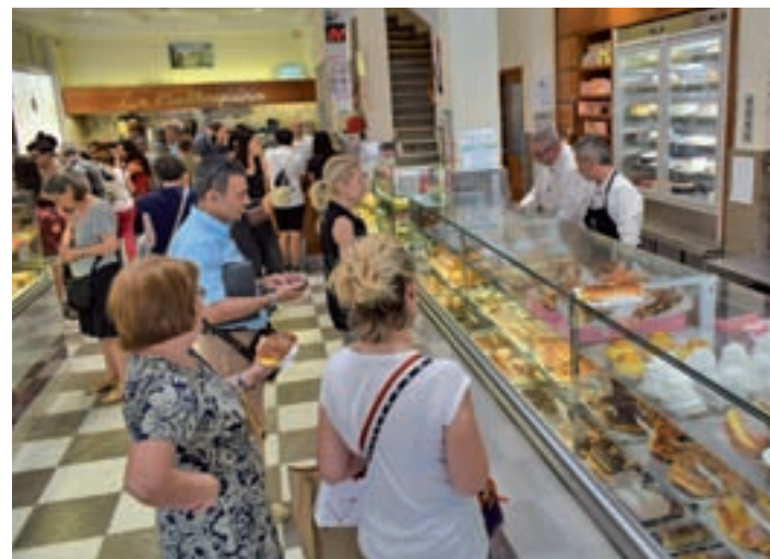
Dulces manjares: En la actualidad es posible encontrar en sus apreciados estantes desde sus clásicas napolitanas de crema, sus palmeras de chocolate o sus bambas de nata a granizados de mango o fresa. Bollos que elaboran a diario en su obrador, “el más céntrico de España”, indica Quiroga.