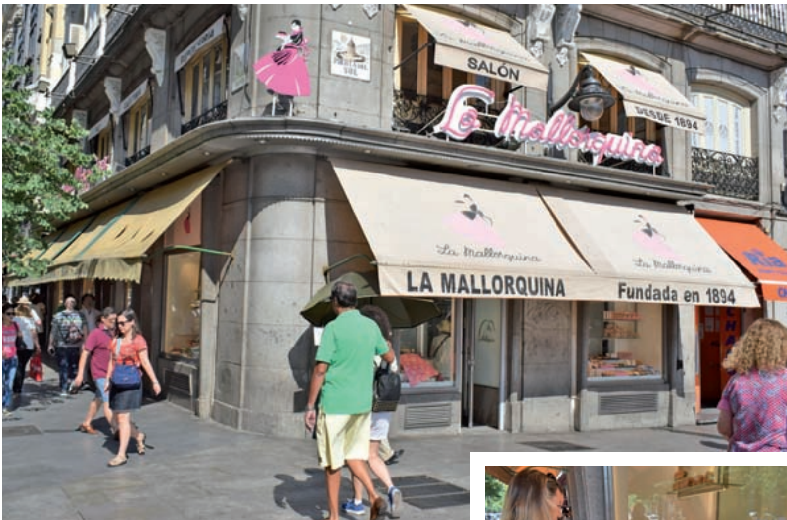
Escaparate principal de la confitería