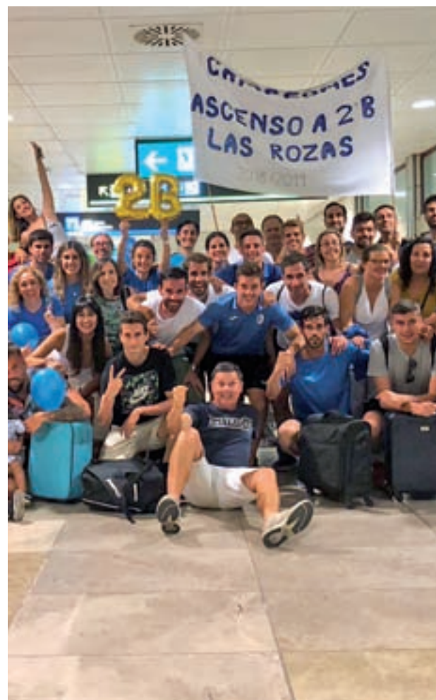
Jugadores y aficionados, a su llegada a Barajas