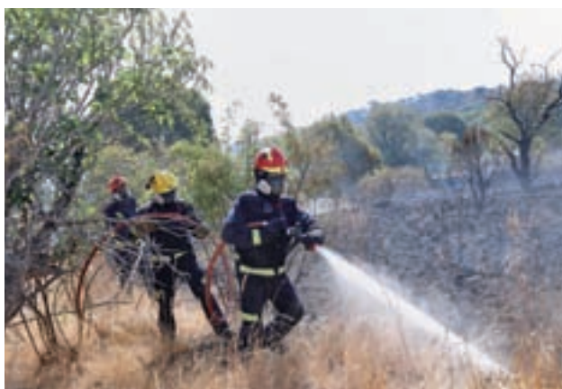
Bomberos de la Comunidad apagando el fuego