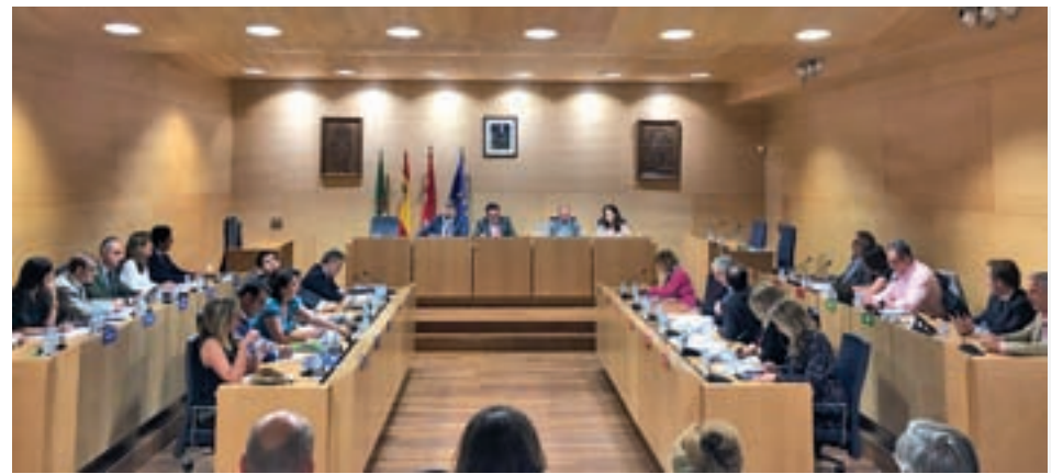
El Pleno de Boadilla del Monte

más de 80.000 euros y algunos cargos de confianza 73.000 euros, lo único que han hecho es bajarse el sueldo. "Durante estos últimos ocho años, hemos devuelto hasta pagas extra por sensibilidad con la situación social", añaden estas mismas fuentes.