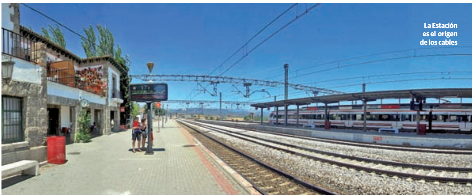
La Estación es el origen de los cables