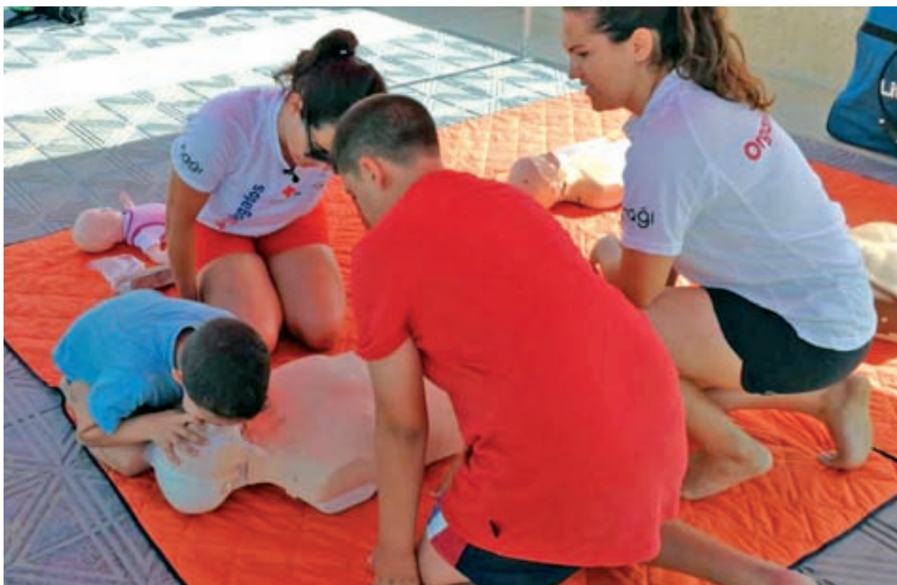
Taller de prevención de ahogamientos organizado por la Federación de Salvamento y Socorrismo