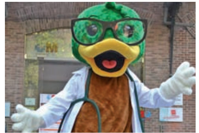
La doctora Cuac ya forma parte de la plantilla del hospital

La doctora Cuac se estrena como la mascota del Hospital Niño Jesús visitando a los niños ingresados • Será la protagonista de un juego en 3D para disimular las temidas agujas y pinchazos en los más pequeños