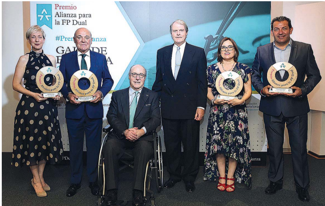
La FER, reconocida por impulsar la FP Dual, acompañar a las empresas y establecer mecanismos de mejora del modelo dual.

La institución ha sido premiada por liderar con éxito este proyecto