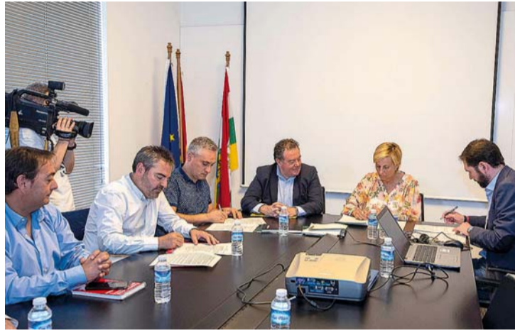
Reunión de la mesa sectorial de industria.

La firma se llevó a cabo durante la reunión de la mesa sectorial de industria que ultima un estudio sobre la situación del sector mediante un análisis pormenorizado de los polígonos de pro-