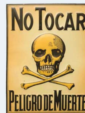
Letrero de "No tocar".