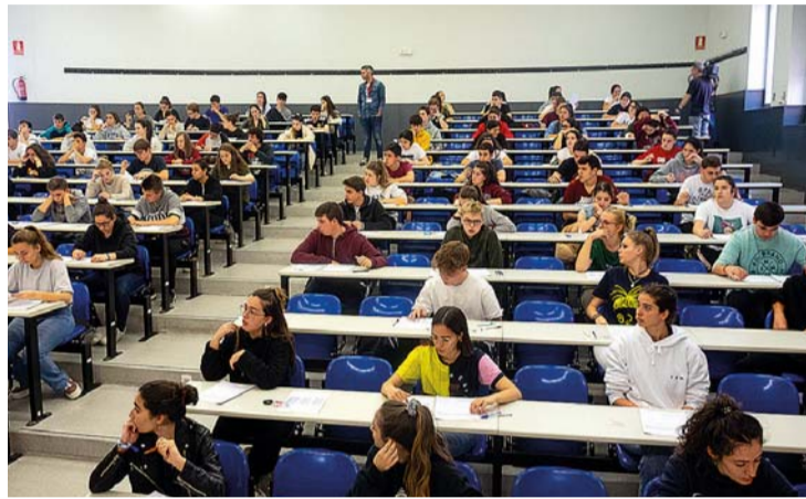
Las pruebas de la EBAU se celebraron en La Rioja del 5 al 7 de junio.

En el caso de los estudios de máster, el plazo ordinario de admisión finaliza el 24 de junio. Las listas provisionales de admitidos se harán públicas el 5 de julio y la matrícula