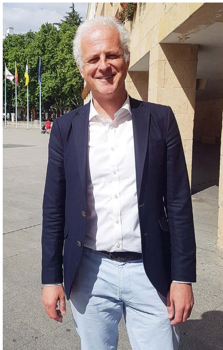
Hermoso de Mendoza está en fase de aclimatación a su nuevo cargo.

Un tripartito es una opción novedosa en Logroño donde sí