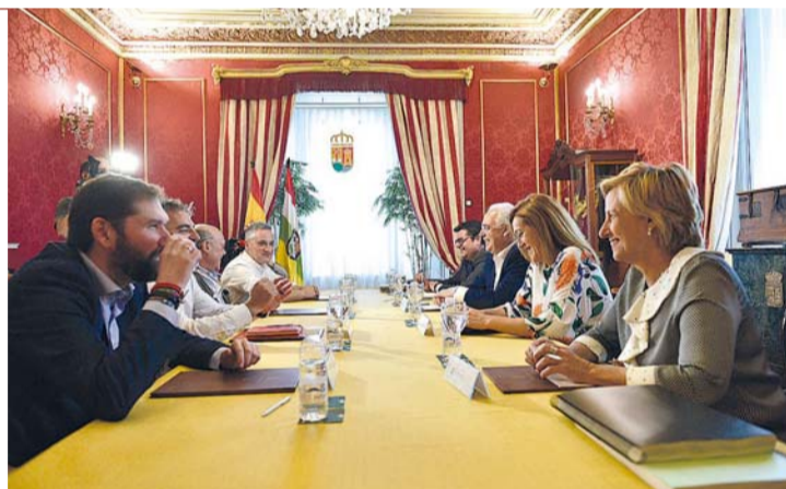
Reunión del Consejo Riojano del Diálogo Social el martes 18.

El objetivo es dar a conocer de una forma concreta y visual las iniciativas turísticas y culturales más singulares de la región, tanto a los riojanos como a los turistas nacionales e internacionales que nos visitan, según señalaron desde el Gobierno de La Rioja.