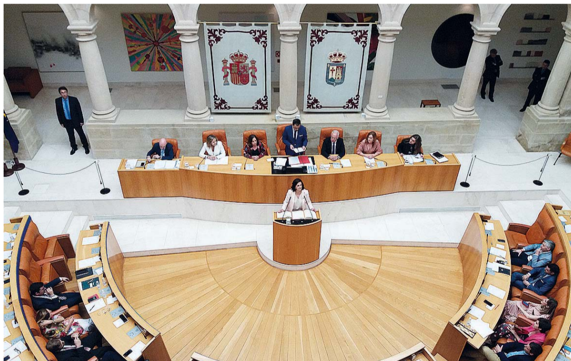
Los diputados en el momento de prometer su cargo durante la sesión de apertura de la décima legislatura celebrada el jueves 20.

rando para siempre determinadas conductas de las que hemos sido testigos en momentos pretéritos en los que se ha antepuesto el interés partidista y electoralista por el encima del respeto a esta institución y a la voluntad de sus diputados" en referencia a la Ley de Protección Animal recurrida por PP y el Ejecutivo regional.