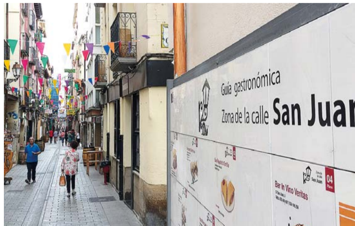
La calle San Juan es una de las zonas de pinchos del casco antiguo por excelencia.