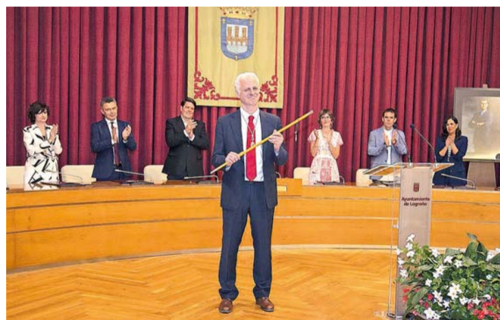
Pablo Hermoso de Mendoza, nuevo alcalde de Logroño.

La celebración de los plenos de investidura despejó las incógnitas existentes en Santo Domingo de la Calzada y Cervera del Río Alhama. En el primer caso, finalmente fue elegido alcalde el socialista Javier Ruiz como candidato más votado en las elecciones