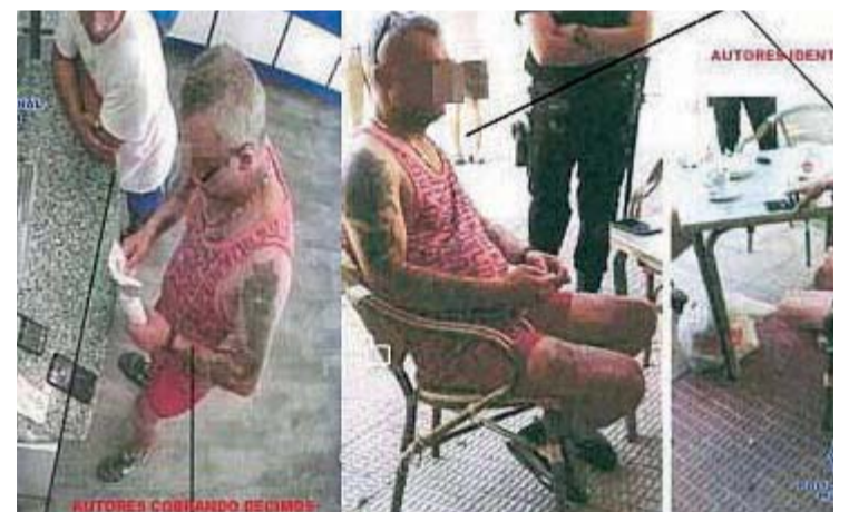
Dos delincuentes fueron identificados al tratar de cobrar décimos de lotería robados.

A esta banda se les imputa siete delitos y la Policía Nacional continúa con las investigaciones para su localización y detención al tratarse de hechos graves tanto por la traumática experiencia vivida por las víctimas como por el botín obtenido que supera los 3.500 euros.