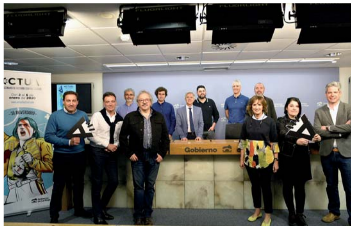
Organizadores y colaboradores del Festival de Culturas Contemporáneas Actual.

A falta de perfilar detalles, se pretende exponer una retrospectiva del 30º aniversario de Actual en la Biblioteca de La Rioja, donde se mostrarán diferentes elementos de su historia como audiovisuales, cartelería, entradas y fotografías.