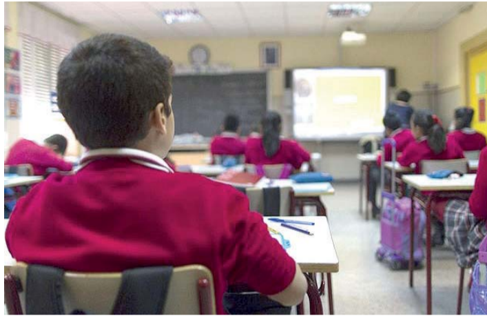
Alumnos siguen las clases en un centro educativo.

La cuantía de las ayudas dependerá de la renta per cápita del solicitante. Cuando sea inferior o igual a 4.000 euros o los tutores hubieran percibido en 2018 la renta de ciudadanía,