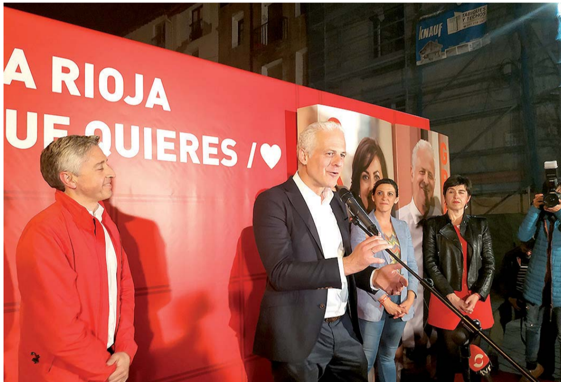
Pablo Hermoso de Mendoza se dirige a los simpatizantes y afiliados socialistas tras conocerse los resultados electorales.

Ciudadanos mantiene sus 4 representantes y su capacidad de influencia, Unidas Podemos-IU-Equo entra con 2 y el PR+, también determinante, sigue con Rubén Antoñanzas como único concejal.