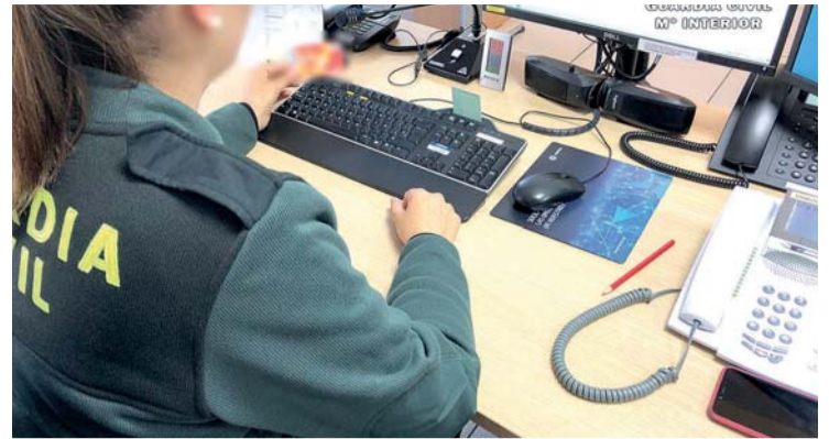
Las falsas denuncias provocan la pérdida de recursos en otras investigaciones.

por lo que se investigó al amigo y se detuvo al denunciante, que podría enfrentarse a dos años de prisión y a multas económicas por simular un delito.